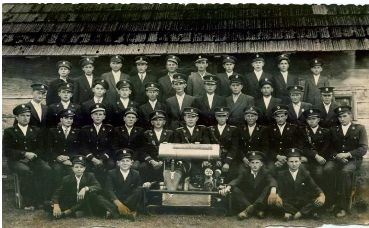
Prilog 8. Članstvo DVD-a Trebovec 1976. godine, slikano povodom 55 godina osnutka društva. U donjem redu članovi „omladinaca“