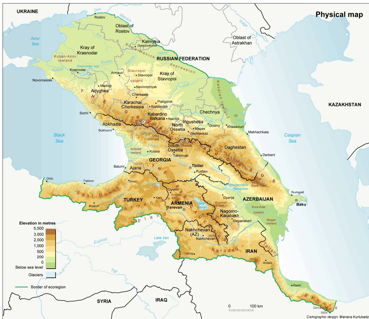
Slika 6: North and South Caucasus physical map. 243