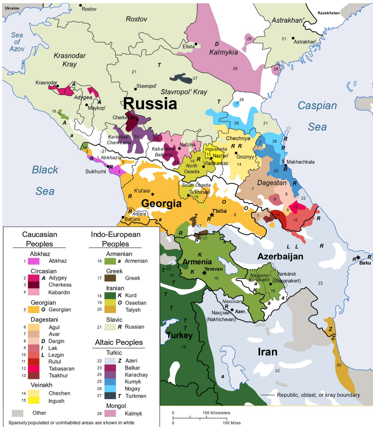
Slika 5: Ethno-linguistic groups in the Caucasus region. 242