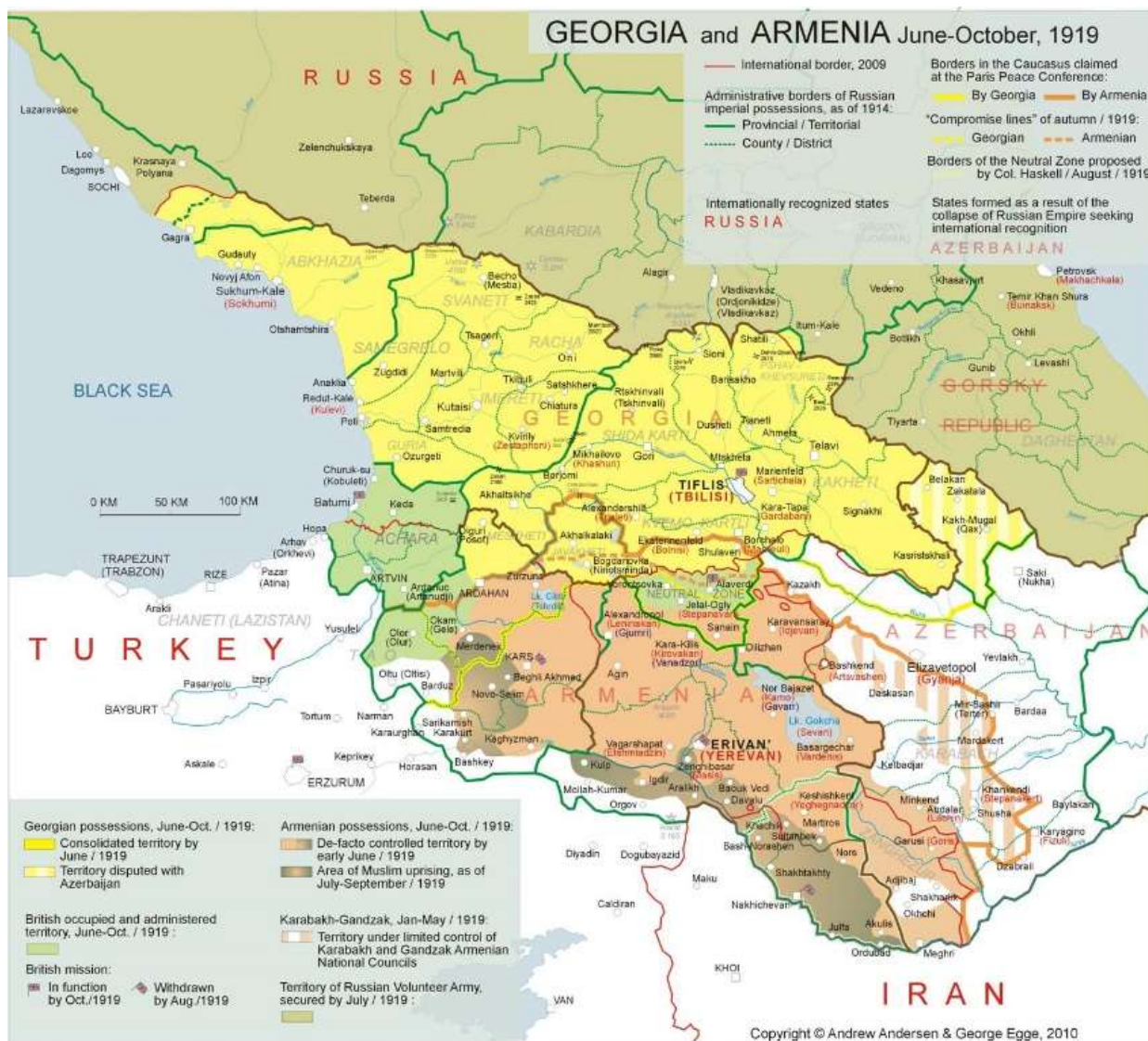
Slika 2: Georgia and Armenia, June – October 1919. 239