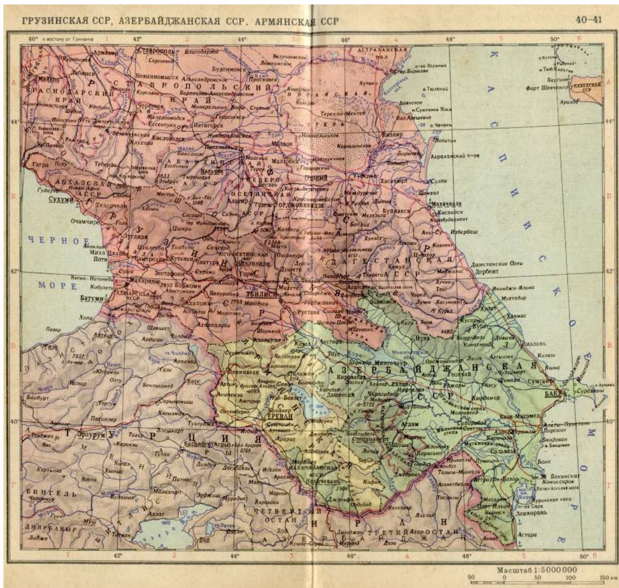
Slika 4: Soviet Caucasus, 1956: Political Map. 241