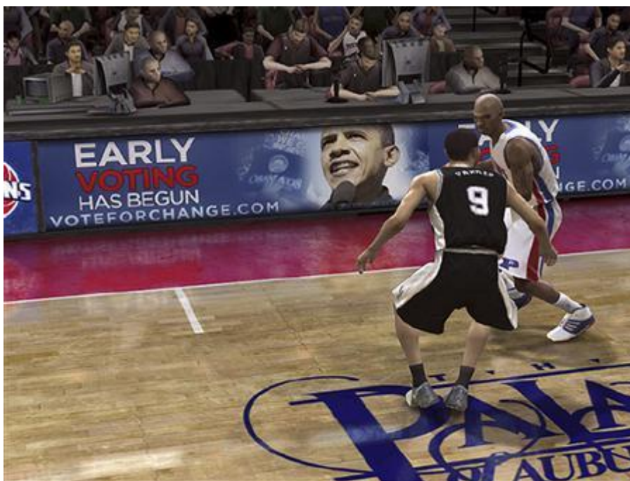
Slika 5. Reklama za predsjedničkog kandidata Baracka Obamu u videoigri NBA Live 08 .

čini prvi slučaj oglašavanja predsjedničke kampanje u videoigrama. Zanimljiv je slučaj igara zvanih igre ruba (eng. brink play ). U njima je konflikt između kulturnih pravila i pravila igre integralan igri. Primjeri takvih igara su Twister, boca istine i izazova i razne igre ljubljenja i dr. U tim slučajevima, kako kaže Stenros, Batesonovom konceptu metakomunikacije se namiguje, govoreći „Ovo je samo igra!“ 91 To postaje problematično u igrama koje uključuju nemoralne radnje, makar virtualne, kao što su silovanje majke i dvije kćeri kao cilj igre RapeLay , prikrivanje pedofilije usmjerene od svećenika prema djeci kao cilj igre Operation: Pedopriest , ili pokolj studenata i profesora u igri Super Columbine Massacre RPG! . 92