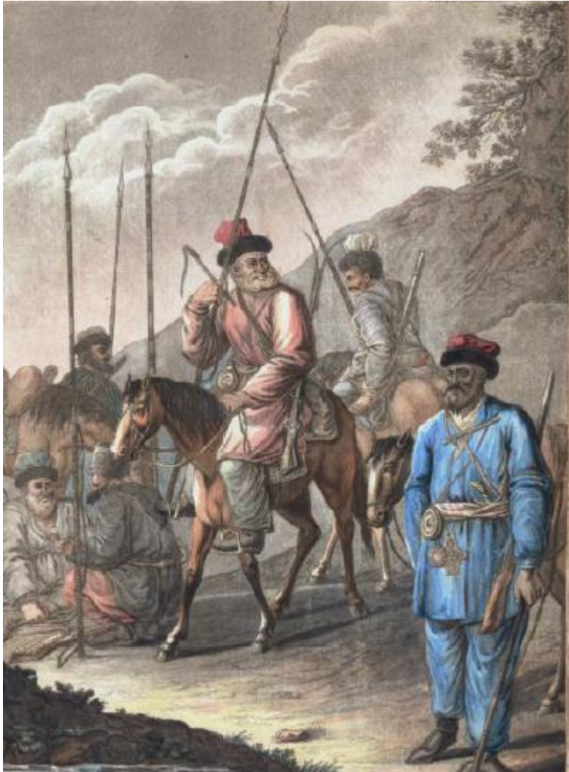
Prilog br. 1. « Uralski kozaci na pohodu »