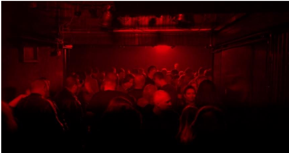
Slika 6. Vrlo mračna unutrašnjost Jabuke. Fotografija je preuzeta s Facebook stranice GK Jabuke. Datum objave je kolovoz 2019. godine.

„tunel“ ili „hodnik“) na čijem se kraju nalazila DJ kabina. Kada sam tijekom istraživanja saznala da je riječ o bivšoj Titovoj kuglani, takav tlocrt, odnosno taj izduženi pravokutni dio potpuno je poprimio smisao s obzirom na to da je izvorno riječ o stazi za kuglanje.