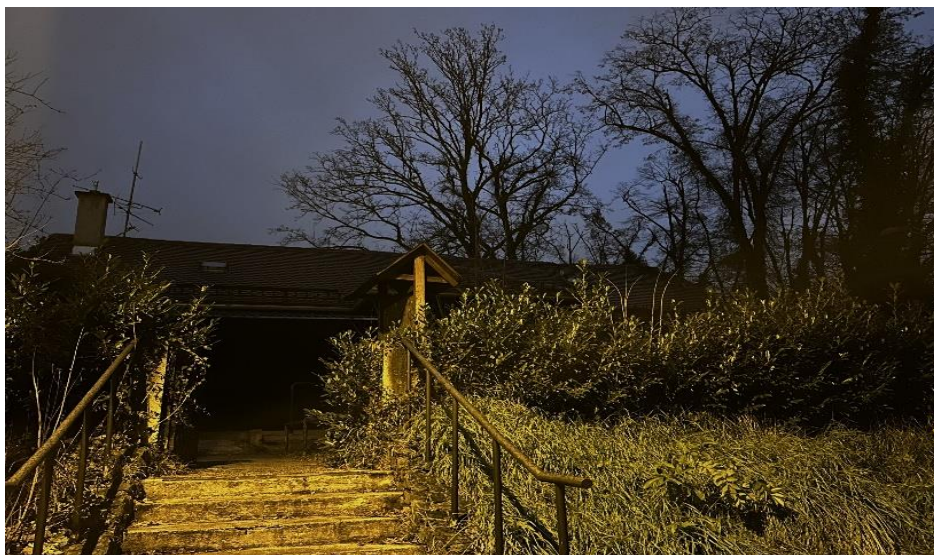
Slika 4. U mraku skrivena Jabuka te stepenice koje vode do njezinog ulaza osvjetljene obližnjom uličnom rasvjetom. Osobna fotografija, snimljena u studenom 2019. godine.