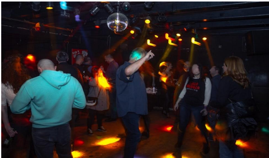
Slika 5. Plesni podij Jabuke. Fotografija je preuzeta s Facebook stranice GK Jabuke. Datum objave je ožujak 2020. godine.

Po ulasku u Jabuku kročilo bi se u malenu prostoriju poput predsoblja koja je služila kao garderoba. Iz te prostorije ulazilo se na plesni podij – prostoriju za koju mi je misao pri svakom dolasku bila kako je moguće da je mračnije nego vani. To je bila prostorija s podnim pločicama koje kazivačica Lina uspoređuje s onima u mjesnim odborima, crno obojanim zidovima, niskim stropom s čije sredine je visjela disko kugla te stropnim reflektorima koji su u šarenim snopovima bacali okomitu svjetlost te predstavljali jedini izvor svjetla.