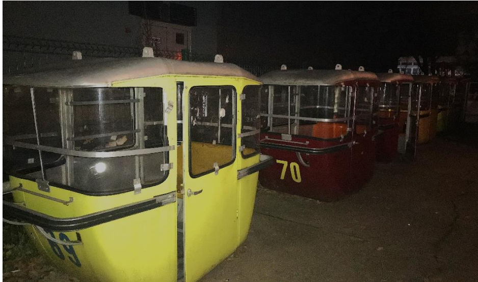
Slika 7. Gondole stare sljemenske žičare smještene u dvorištu Jabuke. Osobna fotografija, snimljena u listopadu 2019. godine.

Prema Jutarnjem listu , vlasnik Stiv ih je odlučio kupiti jer se radi o „jednom od simbola starog Zagreba“: „[n]isam htio da jedan od njih bude zaboravljen pa sam zato odlučio kupiti kabine i dovesti ih u klub kako bi zajedno i dalje pripovijedali o povijesti grada“. U gondole se uvijek moglo ući, a ljudima su najčešće služile kada bi htjeli privatnost. Taj „stari Zagreb“ koji je potaknuo vlasnika Jabuke da otkupi gondole zapravo implicira osamdesete godine prošlog stoljeća, a koje su u zagrebačkom širem diskursu pa tako i kod mojih kazivača često podvrgnute idealizaciji. Dijelom jer je riječ o razdoblju njihove proživljene mladosti, a dijelom jer to povijesno razdoblje smatraju prosperitetnijim, s raznolikijim i kvalitetnijim kulturnim sadržajem. Kao što će se pokazati kroz rad, Jabuka je upravo bila mjesto koje je kazivačima omogućavalo jednu vrstu povratka u to razdoblje.