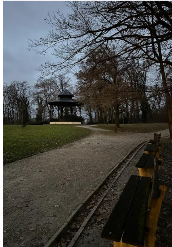
Slika 3. Početak Park-šume Tuškanac gdje se nalaze paviljon i spomenik Vladimiru Nazoru te okolne klupice na kojima se družilo do odlaska u Jabuku.

Nedaleko šume, na kraju ulice Jabukovac, s lijeve strane je u mraku i zaklonjena grmljem i granama (bila) smještena tamna, niska i s ceste jedva uočljiva kućica – Glazbeni klub Jabuka. Iako obližnja ulična lampa osvjetljava stepenice koje vode do njezinog ulaza, ukoliko osoba ne zna za njezino postojanje, vrlo moguće je da bi prolaskom pored nje uopće ne bi ni zamijetila.