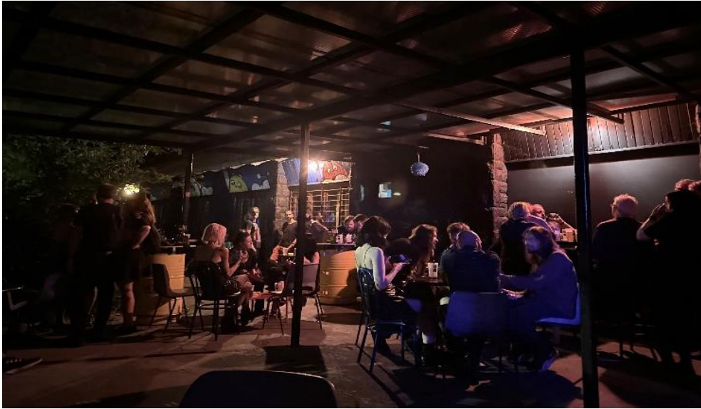
Slika 8. Terasa Jabuke. Osobna fotografija, snimljena u svibnju 2019. godine.

Dosad se prilikom opisa Jabuke prvenstveno polazilo od vizualne i interakcijske dimenzije osvještavanja i „upijanja“ okoline. Međutim, nastavno na prethodni Tomijev opis „trodiobe“ prostora Jabuke, predstavljanje konstrukcije njezinog prostora bilo bi nepotpuno bez uključivanja i zvučne dimenzije, odnosno zvučolika Jabuke. Time se podrazumijeva cjelokupno zvučno okruženje prostora koje, za razliku od onog vizualnog, pojedinca okružuje sa svih strana te mu pruža osjećaj potpune uronjenosti u prostoru (usp. Kinayoglu 2009:47). Primjenjujući takvo razmatranje u kontekstu Jabuke, može se uvidjeti da su aktivnosti u njezinim različitim dijelovima zapravo bile uvjetovane zvukom – onim „odozgo“, odnosno glazbom koja je okruživala pojedince, te onim „odozdo“, odnosno zvukovima koje su pojedinci stvarali sami – kretanjem u prostoru, međusobnim razgovorima, pjevanjem ili pak tišinom. Slijedom toga, glasnoća glazbe određivala je interakciju na podiju te kod šanka. Zbog prožetosti podija vibracijama glazbe, dominantne aktivnosti u toj prostoriji bile su plesanje i pjevanje, dok je zbog neposredne blizine šanka, tamošnja komunikacija bila obilježena međusobnim nadglasavanjem te izražajnim ekspresijama lica i pokretima tijela. S druge strane, izlaskom na terasu, glazba je postala „pozadinski zvuk“, zbog čega su aktivnosti bile nešto „umjerenije“. Na terasi se tako uglavnom sjedilo i razgovaralo, dok su gondole, ne propuštajući unutra okolni žamor, bile mjesto potpune privatnosti.