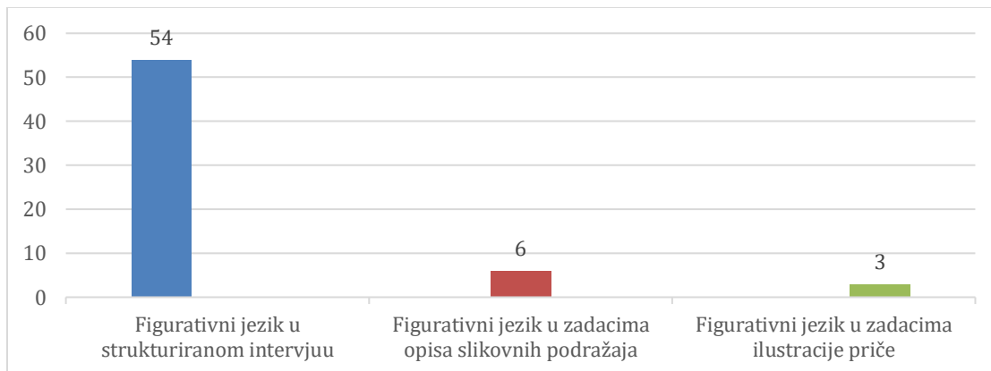
Slika 3. Distribucija figurativnog jezika s obzirom na pojedinačne zadatke (strukturirani intervju, opis slikovnih podražaja i ilustracija priče)

Očekivano je manje figurativnog jezika u zadacima ilustracije priče, no razlika između dvaju zadataka slikovnih podražaja nije značajna. Zaključci su ovog istraživanja dakle činjenica da se klinički sudionici s dijagnozom shizofrenije (F20) ili akutnom psihozom iz spektra shizofrenije (23) oslanjaju na brojne oblike figurativnog jezika, odnosno da je taj oblik pragmatičke kompetencije očuvan. Figurativni se jezik pojavljuje u dvama modalitetima, ali u znatno većoj mjeri u verbalnom (strukturiranom intervjuu). Razlika u pojavnosti figurativnog jezika, iako ide u prednost zadacima opisa slikovnih podražaja projekcijske prirode, nije značajna u odnosu na zadatak ilustracije priče.