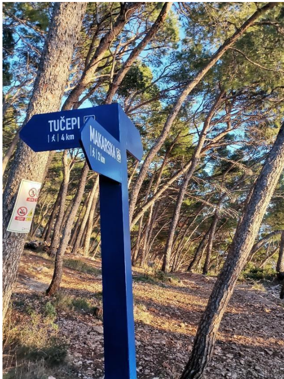
Slike 3. i 4. – putokazi koje su postavili članovi UZOR Osejava / Fotografirano: 21.01.2024.