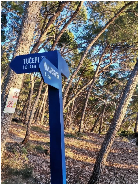
Slike 3. i 4. – putokazi koje su postavili članovi UZOR Osejava / Fotografirano: 21.01.2024.