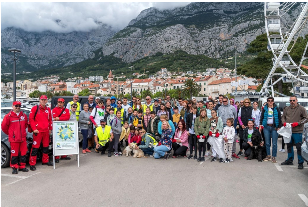
Slika 8. Zelena Čistka 2024.

vrećama, koje su predstavnici udruge skupljali uz put na quadovima s prikolicom, s obzirom da je ipak riječ o makadamskoj stazi kojoj je onemogućen pristup automobilima. Kako sam prolazila i gledala lica sudionika, svi su mi izgledali vrlo zadovoljni obavljenim poslom te sam čula nekoliko komentara kako je svake godine sve čišće. Slične informacije sam i dobila kroz provedene intervjuje s članovima udruge. Većina ljudi s kojima sam razgovarala vjeruje kako ljudi ne žele bacati kad vide da je čisto, tako da sam prema ovim dobivenim dojmovima uspjela zaključiti da je mnogo toga dobrog proizašlo iz ove akcije koju Udruga održava zadnjih nekoliko godina. Također sam od sudionika saznala da zapravo mnogo njih i njihovih poznanika godinama sudjeluje u akciji te ne odustaje od cilja i predani su postizanju čistog poluotoka Osejava, u kojem svi zajedno možemo uživati. Akcija je završila najavljenom zakuskom koja je napravljena zahvaljujući donacijama među kojima je i Grad Makarska. Ista stvar vrijedi i za nabavku materijala koji je podijeljen prije skupljanja (rukavice, vreće i sl.). Zakusku su činila razna pića te makaroni s bolonjez umakom - na veliko oduševljenje mališana koji su pohrlili s osmjesima prema velikom loncu i vraćali se s punim tanjurima kako bi se okrijepili nakon rada. Atmosfera nakon čistke, bila je gotovo zarazna - svi su bili veseli, pozitivno umorni i ponosni na svoj rad.