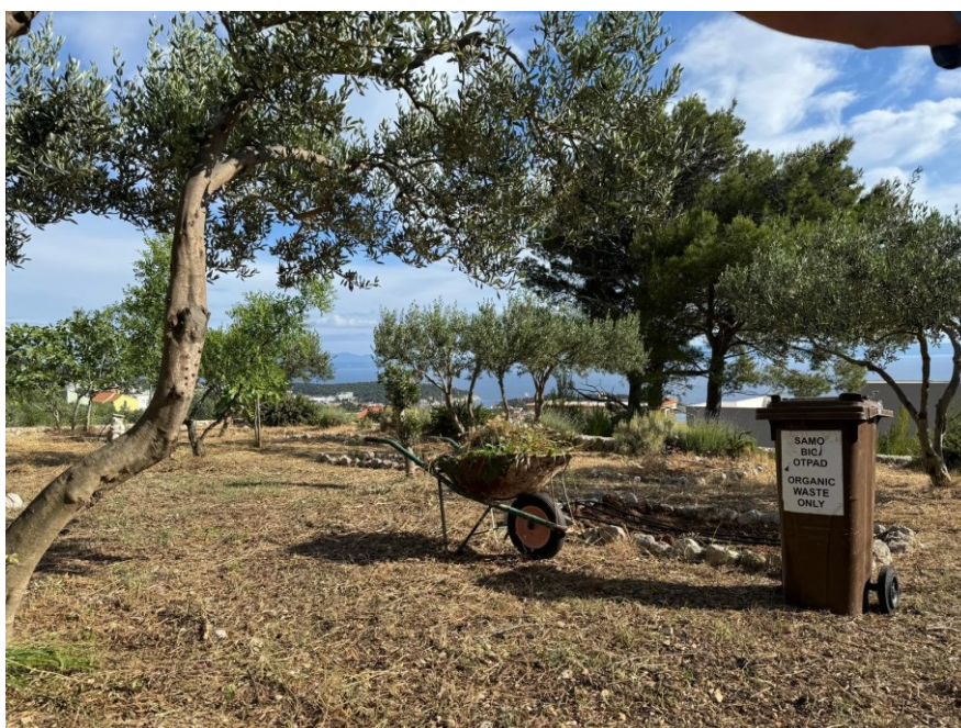
Slike 9. i 10. Vrt gdje se održavala radionica kompostiranja / Fotografirano 01.06.2024.