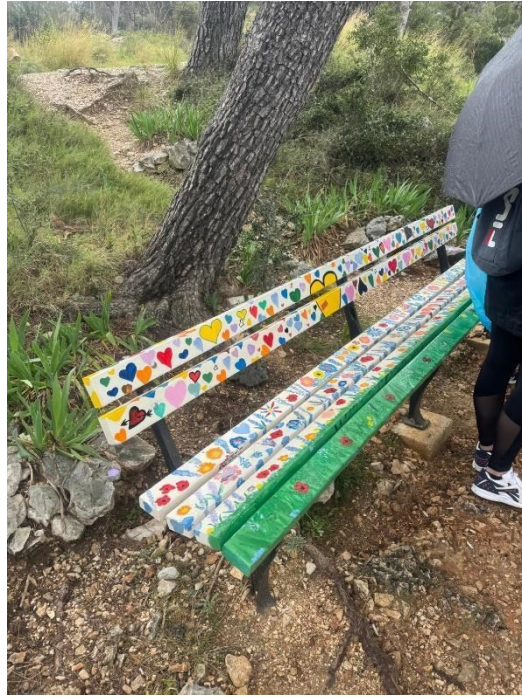
Slika 6. Klupa koju su osnovnoškolci Oca Petra Perice oslikali u suradnji s udrugom - jedna od etapa na Zelenoj šetnji / Fotografirano: 16.03.2024.