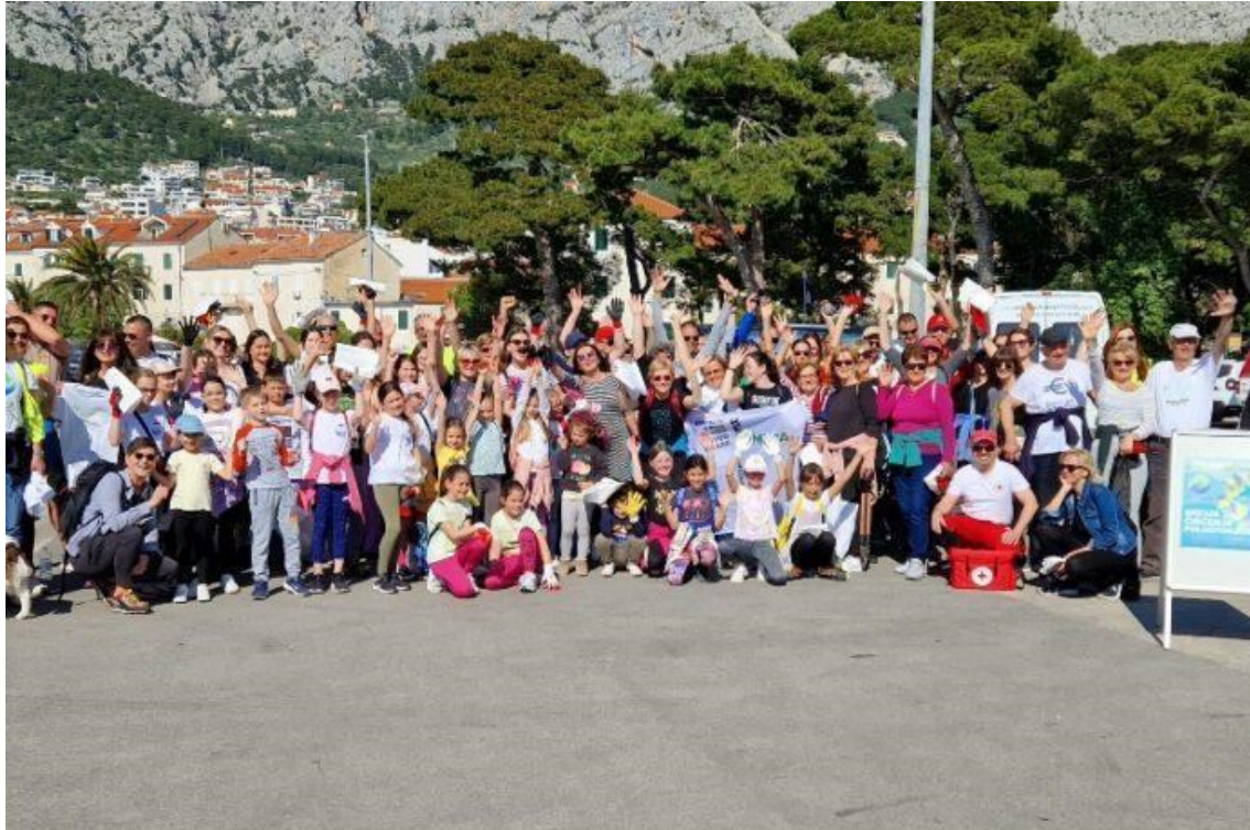
Slika 2. Zelena čistka 2023.

Budući da je autorica ovog rada rođena u Makarskoj te tamo trenutno i boravi, njen odabir ove teme za istraživanje upravo i jest na jedan način posvećen tom gradu te želji za boljom budućnosti i pametnijem razvoju grada. Makarska se posljednjih nekoliko godina provlači kroz medijske objave kao sinonim betonizacije te apartmanizacije, koja utječe na čitavo područje Republike Hrvatske čije je glavna djelatnost turizam. Ovome svjedoči i podatak da je u posljednjih desetak godina u Makarskoj izgrađeno preko 1600 novih stanova 4 , a podaci pokazuju da se potrošnja vode koja u zimskim mjesecima iznosi otprilike 100.000 metara kubnih mjesečno u ljetnim mjesecima penje i do 800.000 metara kubnih mjesečno 5 . Sve ovo je doprinijelo tome da je grad Makarska zadnjih nekoliko godina Makarska postao simbol nekontrolirane gradnje koja je potpomognuta nedostatkom planskog uređenja. Makarski slučaj je tako postao još poznatiji široj javnosti objavom HRT-ove serije Apsurdistan – Prvi red do mora , objavljene 18. travnja 2022. gdje je Makarska uzeta kao jedan od školskih primjera problema apartmanizacije u današnjem društvu. U sklopu ove dokumentarne serije koja tematizira betonizaciju i apartmanizaciju obalnog područja, ovaj problem je temeljito istražen