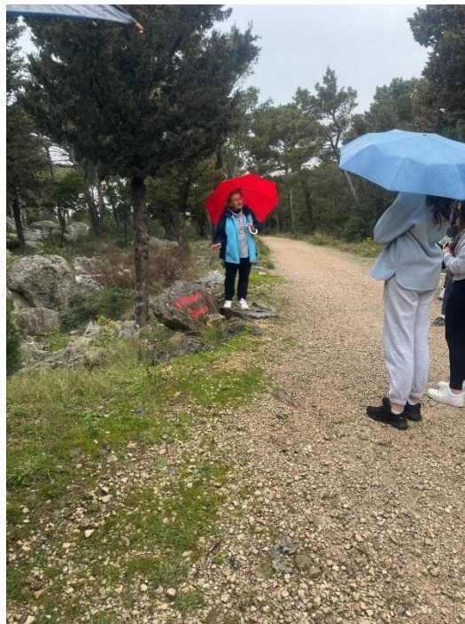
Slika 7. Članica udruge objašnjava akcije koje održavaju za uklanjanje grafita - jedna od etapa na Zelenoj šetnji / Fotografirano: 16. 03.2024.