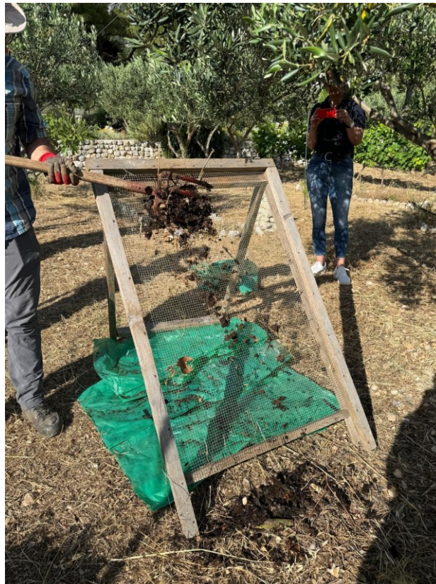
Slika 12. Prosijavanje komposta / Fotografirano 01.06.2024.