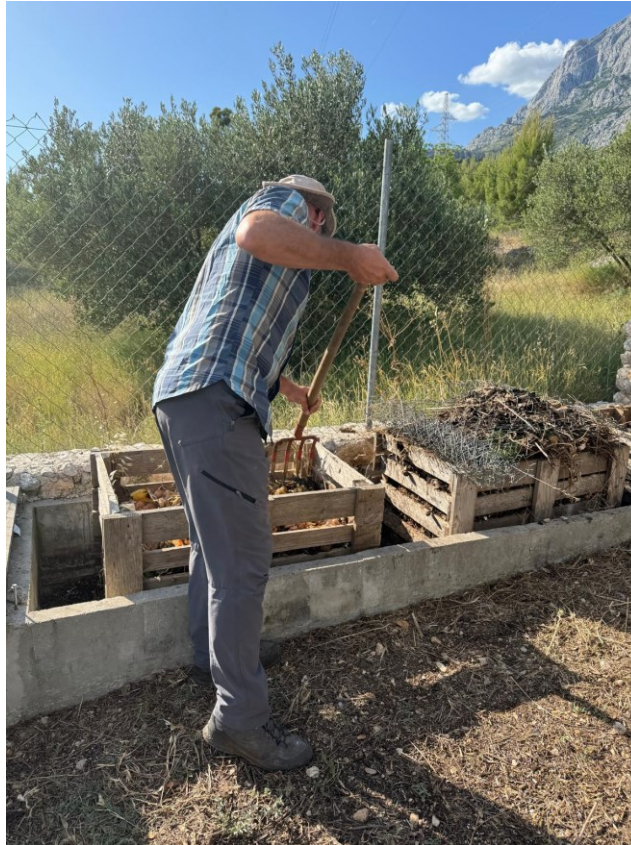
Slika 11. Miješanje komposta / Fotografirano 01.06.2024.