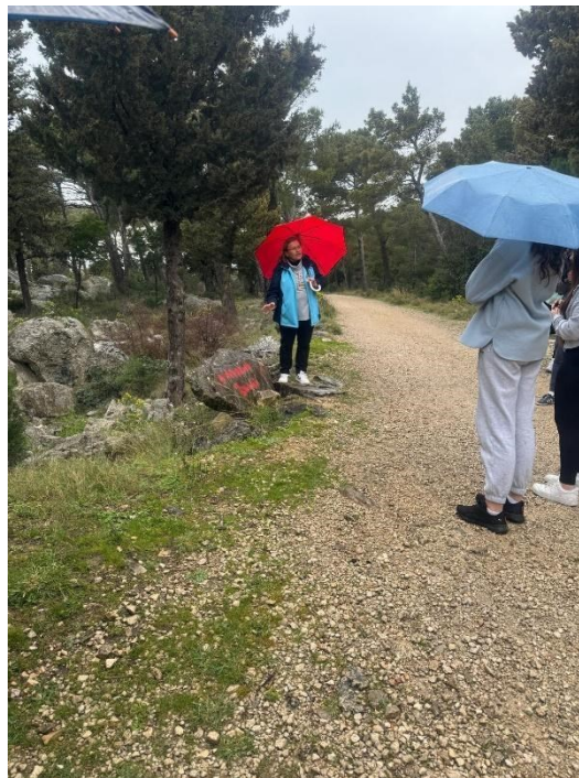
Slika 7. Članica udruge objašnjava akcije koje održavaju za uklanjanje grafita - jedna od etapa na Zelenoj šetnji / Fotografirano: 16. 03.2024.