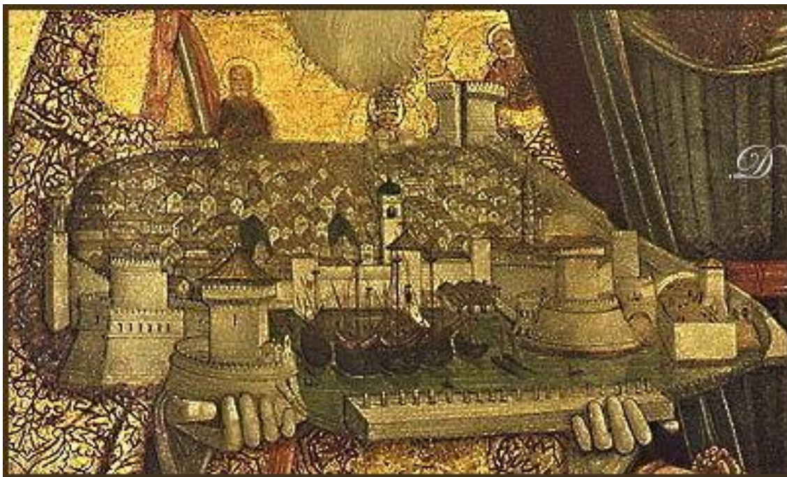
2. Nikola Božidarević, Triptih Bogorodice sa svecima (Triptih obitelji Bundića) , oko 1500., detalj, Dubrovnik, Zbirka dominikanskoga samostana