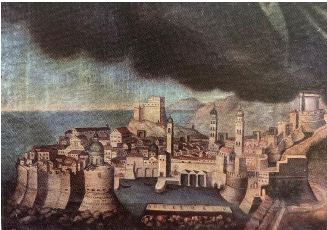
3. Carmelo Reggio, Sv. Petar, sv. Lovro i sv. Andrija (sv. Petilovrijenci) , 1812., detalj, Dubrovnik, katedrala, oltar sv. Petra, Lovra i Andrije