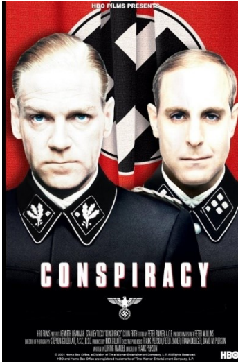
Slika 1. Conspiracy (2001)