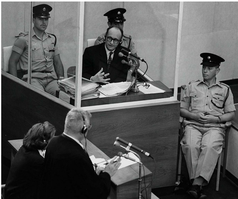
Slika 4. Suđenje Adolfu Eichmannu u Jeruzalemu

Nakon toga, nastavnik i učenici pokušavaju primijeniti znanje iz rasprave na lik Adolfa Eichmanna. Budući da se očekuje da učenici neće imati saznanja o njemu iz prijašnjih nastavnih jedinica, nastavnik im na prezentaciji prikazuje sljedeću fotografiju (slika 4.):