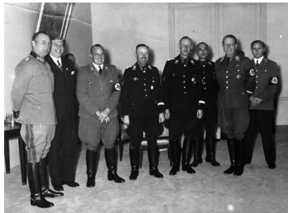
Sastanak stručnjaka za administrativno i policijsko pravo u jesen 1936. Prvi slijeva je Karl Daluege, a onda redom Stuckart, Hans Frank, Heinrich Himmler i Reinhard Heydrich.