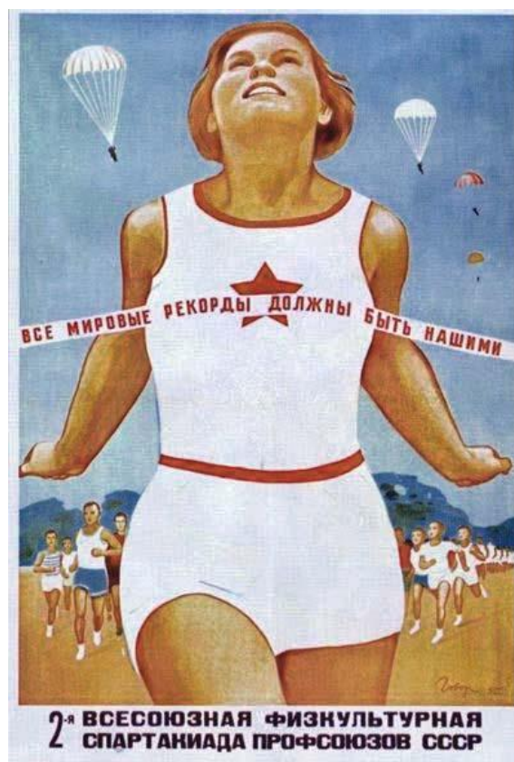
Рис. 11 Все мировые рекорды должны быть нашими! Иванович, В.Г. (1935)

В лингвистическом анализе плаката самым интересным кажется использование притяжательного местоимения «наш» здесь в творительном падеже. Иванович использовал механизм визуализации символа пятиконечной звезды, изображенного на футболке бегуни, без указания имени, на которое притяжательное местоимение относится в тексте плаката. Таким образом он связал местоимение с узнаваемым символом социалистического режима и дал понять, что местоимение фактически заменяет имя существительное «Советский Союз». Автор плаката использовал нежесткую стратегию высказывания, не прибегая к резкой или агрессивной лексике, косвенно намекая на то, что СССР заслуживает быть чемпионом всех мировых спортивных рекордов.