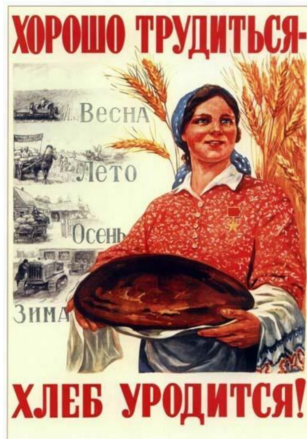
Рис. 9 Хорошо трудиться – хлеб уродиться! Соловьёв, М.М. (1947)

Как уже упоминалось в таблице в разделе 4, самые частые образы героев – «рабочие, крестьяне, молодежь, партийные лидеры и т.п.; и антигероев – капиталисты, милитаристы, а также различные шпионы и провокаторы» (Федосов 2016). Когда речь идет о героях рабочего класса в советском плакате, они послужили вдохновением для многих художников, и на эту тему есть множество плакатов. Мы выделили два: «Хорошо трудиться – хлеб уродиться!» и «Восстановим!»