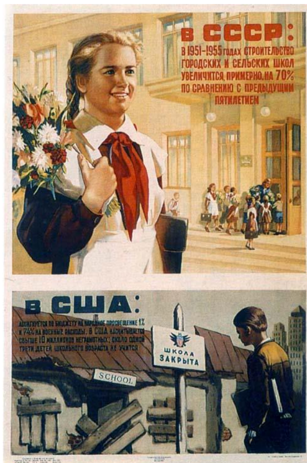
Рис. 13 Образование в СССР, в США. Корецкий, В. (1950)

США насчитывается свыше 10 миллионов неграмотных; около одной трети детей школьного возраста не учатся». Советская часть плаката изображена в светлых теплых тонах и показывает веселую школьницу, идущую в школу. Американская часть наоборот изображает полуразвалившуюся мрачную и закрытую школу и школьника-мальчика, стоящего перед ней и не имеющего возможности учиться, из-за того, что 74% государственного бюджета Америки тратится на военные расходы.