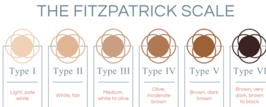
Slika 2: Fitzpatrickova ljestvica tipova kože preuzeta s Tribeca MedSpa. (n.d.).

Kategorije puti i teksture kose uvedene su po uzoru na ranije spomenuta istraživanja (Chung i Bissell, 2009 prema Yan & Bissell, 2014; Cunningham i sur., 1995) koja ravnu kosu i svijetlu put predlažu kao ideale. Kategorija puti sastoji se od pet stupnjeva: izrazito svijetla , svijetla , preplanula/srednje tamna , tamna i izrazito tamna . Izrazito svijetla put odgovara rasponu između prvog i drugog tipa kože na Fitzpatrickovoj skali (Tribeca MedSpa, n.d.), prikazanoj na slici 2.