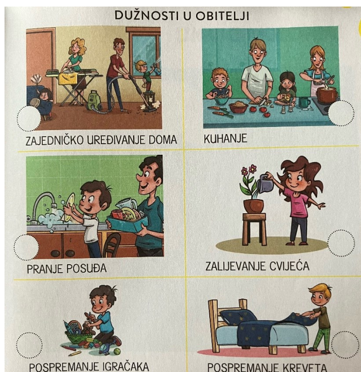
Slika 5. Rodna ravnopravnost u kućanskim poslovima (Istražujemo naš svijet 1, 2023: 53)

U kontrastu s prethodnim primjerima, postoje i prikazi rodne ravnopravnosti.