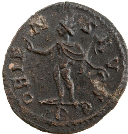
Sl. 22 – Galerijev antoninijan, revers (294./295.) Prikaz Sola uz legendu ORIENS AVGG (Br. 306758 – Online coins of the Roman Empire (OCRE) - https://en.numista.com/catalogue/pieces288600.html )