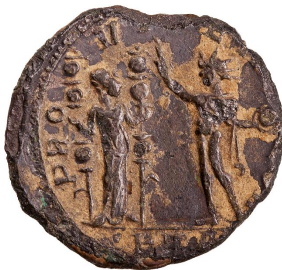
Sl. 26 – Aurelijanov antoninijan, revers (270./275.) Prikaz božice Fides i Sola uz legendu PROVIDENTIA DEORVM (Br. 291091 – Online coins of the Roman Empire (OCRE) - https://en.numista.com/catalogue/pieces291091.html )

Pojedinim je prikazima Sola u periodu između 270. i 282. godine pridodavana i legenda PROVIDENTIA DEORVM (sl. 26). Na nekim je kovanicama Aurelijana, Tacita, Florijana i Proba, uz Sola prikazivana i personifikacija Providentia . Ipak, na većini kovanica koje potječu iz vladavine cara Aurelijana, a kojima je uz prikaz Sola pridodana i spomenuta legenda, nalazi se božica Fides (Manders 2012: 131, Steyn 2014: 34). Opisano je vrstom kovanica isticano povjerenje u careve i njihove vojne uspjehe (Pérez Yarza 2018: 380).