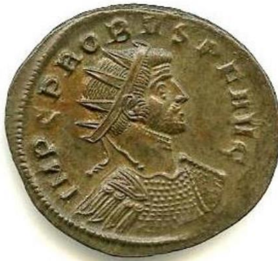
Sl. 6 – Probov antoninijan (276./282.) prikaz oklopljenog cara Proba okrunjenog zrakastom krunom privezanim lemniscima (Steyn 2014., str. 42., sl. 13).

Motivi zrakaste krune nisu u potpunosti izjednačavale careve sa Solom, već su u simboličkom smislu sugerirale da oni posjeduju neke njegove karakteristike (Steyn 2013: 56). Kao primjer prikaza cara okrunjenog zrakastom krunom pričvršćenom lemniscima prigodno je istaknuti dva Probova antoninijana (sl. 6; sl. 7) (Canterbury Collection Num1994 359 i 361). Car je na aversu jedne od kovanica prikazan u oklopu – takva ikonografska postavka sugerira carevu vojničku ulogu, odnosno podršku trupama (Steyn 2014: 42). Na aversu drugog antoninijana oklopljeni car Prob prikazan je s kacigom i zrakastom krunom te s kopljem i štitom. Ovdje se radi o prikazu zabrinutog cara koji rame uz rame sa svojim vojnicima sudjeluje u ratnim zbivanjima. Njegove su vrline istaknute i legendom VIRTVS PROBI AVG (izvršnost Proba Augusta) (Steyn 2014: 42).