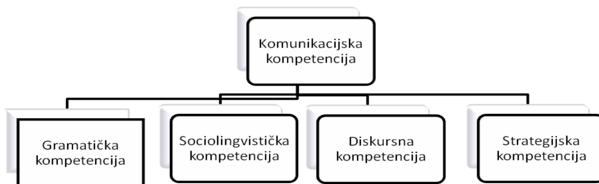
Ilustracija 1. Komunikacijska kompetencija, Canale i Swain (1980, 1981) i Canale (1983)

Postoje različiti modeli komunikacijske kompetencije, no s obzirom na temu ovog rada, spomenut ćemo samo dva. Jedan od tih modela je prema Canaleu i Swain (1980, 1981) koji možemo vidjeti na slici ispod.