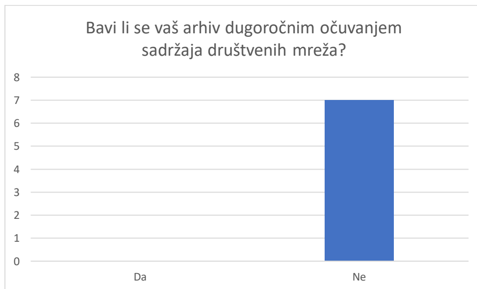
Grafikon 2. Analiza odgovora na pitanje "Bavi li se vaš arhiv dugoročnim očuvanjem sadržaja društvenih mreža?"

Na pitanje prvo pitanje, „Bavi li se vaš arhiv dugoročnim očuvanjem sadržaja društvenih mreža?“, svih 7 ispitanika odgovorilo je odgovorom „ne“.