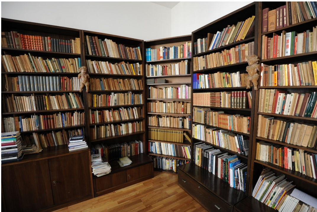
Slika 6. Spomen-dom Dragutina Tadijanovića (Južna soba)

Prostorije Spomen-doma dočaravaju zagrebački dom Dragutina i Jele Tadijanović. Prostorom u velikoj mjeri dominira Tadijanovićeve knjižnica. Izložene su gotovo sve knjige, a tek je par primjeraka zbog osjetljivosti, stanja ili starosti pohranjeno na drugom mjestu. Knjige su dijelom smještene na originalne police i u ormare prenesene iz Zagreba dok su za ostatak izrađene police koje se protežu od poda do stropa. Ova knjižnica svojim smještajem i naslovima privlači pažnju posjetitelja i neodoljivo zbog brojnosti i razmještaja knjiga podsjeća na javnu knjižnicu pa se natpisima na rubovima policama ljubazno moli posjetitelje da ne izvlače i ne pregledavaju knjige koje su sada dio izložbenog postava i nisu više u uporabi. Izložena knjižna građa dostupna je samo za istraživački i znanstveni rad. No i u svojoj izmijenjenoj ulozi knjižnica Dragutina Tadijanovića sačuvala je svoju cjelovitost, a njezina je zadaća posjetiteljima približiti osobu, rad i djela književnika Dragutina Tadijanovića.