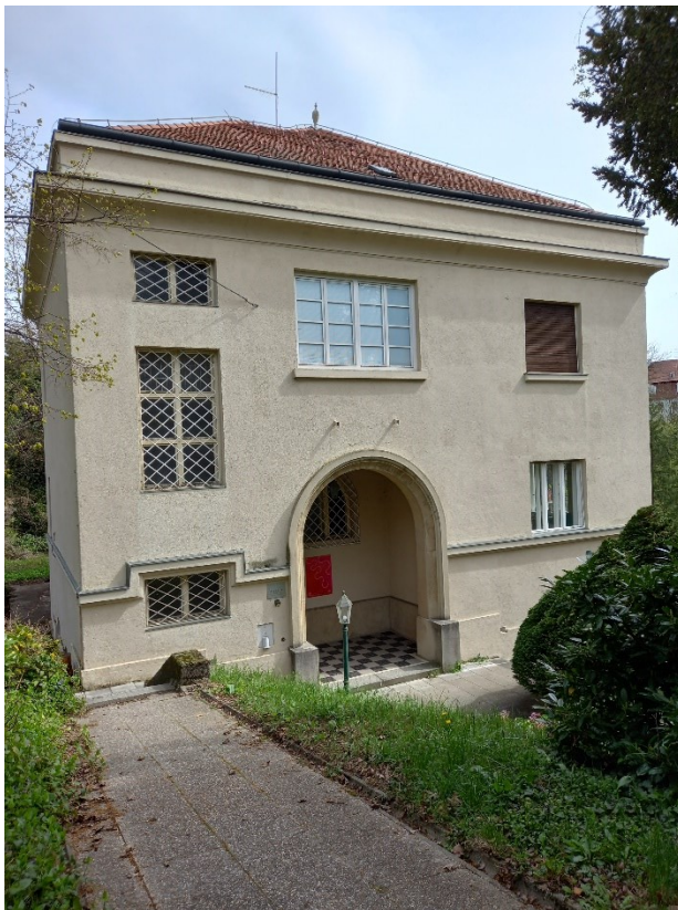
Slika 4. Gvozd 23, Memorijalni prostor Bele i Miroslava Krleže

Za dio ostavštine koja se nalazila u stanu na Gvozdu u Popisu predmeta dijela ostavštine Miroslava Krleže darovane Gradu Zagrebu 1985. g. u zadnjem članku stoji odredba koja kazuje da se ostavština daruje Gradu Zagrebu „pod uvjetom da ih se koristi isključivo za izlaganje javnosti, te da se u tu svrhu osnuje i uredi „Memorijalni prostor Miroslava i Bele Krleže“ u Zagrebu, na Krležinom Gvozdu 23/1“ (Vranešić, 1985).