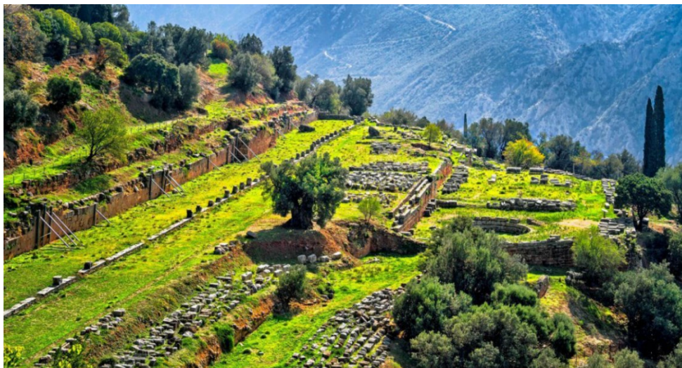
Slika 12. Gimnazij u Delfima, 4. st. pr. Kr.

Zimsko vježbalište koje je bilo u obliku trijema nalazilo se na gornjoj terasi i bilo je orijentirano u smjeru SZ-JI, unutarnjih dimenzija oko 185 x 7,5 m. Prvotni dorski stupovi su nosili krov i bili izrađeni od porosa. U rimskom razdoblju originalni su stupovi zamijenjeni jonskim mramornim stupovima koji su stajali na visokim kvadratnim bazama. Tamo se vježbalo za vrijeme velikih hladnoća, vrućina ili kiše. Inače je uobičajeno bilo vježbati na otvorenoj i nezaštićenoj stazi ispred trijema, koja je tekla paralelno s njim.