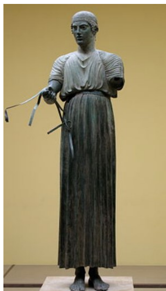
Slika 9. Brončani Auriga iz Delfa, 5. st. pr. Kr., Arheološki muzej u Delfima

Ovdje trebamo spomenuti i slavnog Aurigu iz Delfa koji je iskopan unutar Apolonova svetišta 1896. godine. Ova statua bila je dio velike brončane skulpture koja je prikazivala pobjedničku kvadrigu Polizala na Pitijским igrama 478. ili 474. g. pr. Kr., a podignuta je u čast pobjede. 36 Prikazan je kočijaš s uzdama u rukama, a oko glave nosi pobjedničku vrpču. Plemenitost njegova stava i čistoća okomitih linija njegove odjeće samo su neki od elemenata ogromne kompozicije od koje su ostali sačuvani tek neki dijelovi. Auriga datira iz sredine 5. st. pr. Kr.