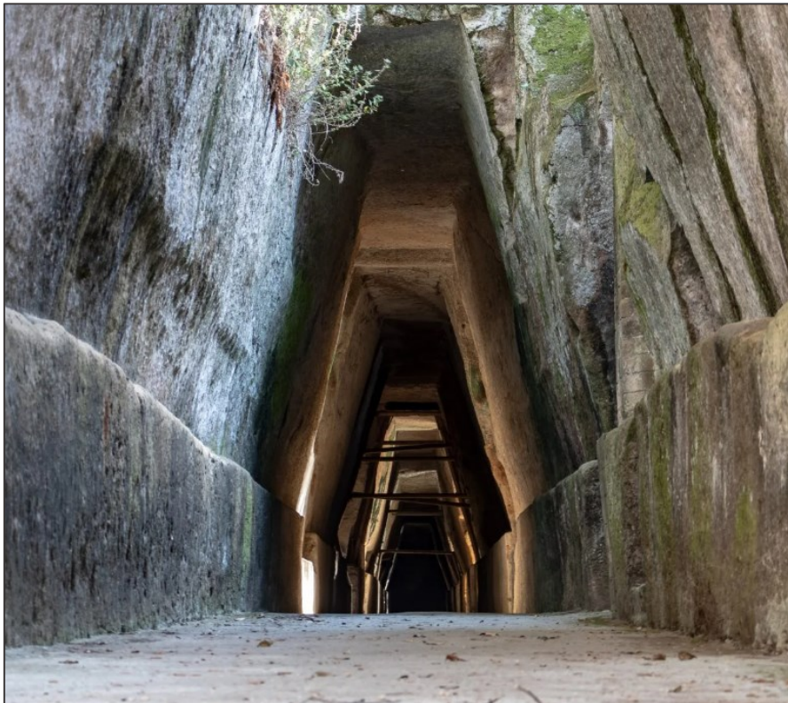
Slika 26. Ulaz u Sibilinu spilju

cisterne izdubljene u stijeni. U njima se Sibila navodno umivala prije nego bi obukla dugu haljinu i povukla se u najdublju odaju iz koje je proricala. Njena proročanstva navodno su bila zapisana na lišću ( Verg. A. 6.74-76 ). Uz tu najdublju odaju na kraju hodnika nalazile su se još dvije prostorije. Zapadna je bila visokog stopa i možda je služila kao čekaonica za posjetitelje. Istočna je imala vrata na osovinama što je vidljivo iz arheoloških ostataka i u njoj se pretpostavlja da je Sibila živjela. 153