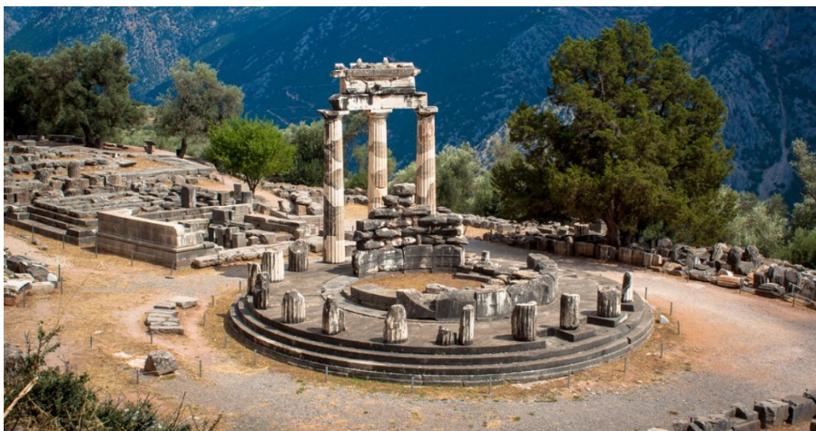
Slika 11. Tolos unutar svetišta Atene Pronaje u Delfima, 4. st. pr. Kr.

Najimpresivnija građevina unutar svetišta Atene Pronaje bio je tolos, remek-djelo Teodora, fokejskog arhitekta s početka 4. st. pr. Kr. 42 Tu se prije njega nalazio i raniji tip tolosa koji je srušen, a materijal od kojeg je bio izgrađen iznova su upotrijebili Sikionjani za izgradnju temelja svoje riznice oko 500. g. pr. Kr. 43 S obzirom na to da je čitav materijal originalnog tolosa ponovno iskorišten, njegov originalan položaj nije poznat, ali se zahvaljujući dijelovima iz temelja riznice Sikionjana uspjelo rekonstruirati da je imao vanjski red s 13 dorskih stupova i unutarnju kružnu celu. 44 Vanjski red kasnijeg tolosa, onog iz 4. st. pr. Kr. imao je 20 dorskih stupova i unutrašnju kružnu celu uz čije se zidove nalazilo 10 korintskih stupova izrađenih od eleuzinskog vapnenca. 45 Ukrašavala su ga dva reljefna friza. Na metopama većeg friza nalazili su se prizori kentaumahije i amazonmahije, a na manjem koji se protezao vanjskim zidom cele, herojska djela Tezeja i Herakla. Crjepovi koji su pokrivali tolos bili su izrađeni od mramora. Zanimljivo je kako nije utvrđena kulna namjena ove građevine.