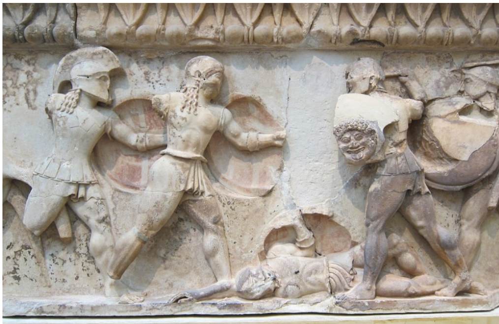
Slika 5. Dio friza na istočnoj strani riznice Sifnjana, prikaz scene iz Trojanskog rata, 6. st. pr. Kr., Arheološki muzej u Delfima