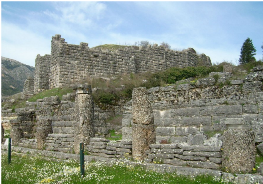
Slika 16. Buleuterij (Vijećnica) u Dodoni, 3. st. pr. Kr.

Prema ruševinama svetišta moglo se zaključiti da je građevina najbliže kazalištu bila hipostilna dvorana koja je imala funkciju Buleuterija. Afroditin hram, hram Dione i hram Zeusa Naja nalazili su se istočno od Vijećnice. Hramovi Afrodite i Dione bili su manjih dimenzija, a Zeusov nešto veći od njih, što je vidljivo po sačuvanim ostacima temelja tih triju hramova. Nešto dalje od njih bilo je sagrađeno Heraklovo svetište nad kojim je u kasnijim stoljećima podignuta starokršćanska bazilika. 75