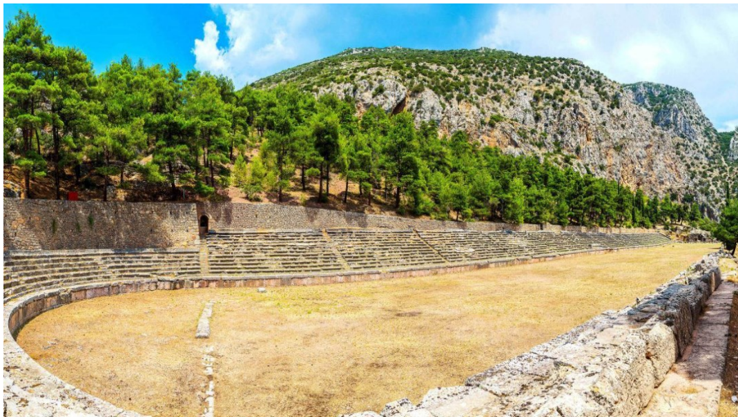
Slika 13. Stadion u Delfima, 5. st. pr. Kr. / 2. st. po. Kr.

Na najvišem vrhu delfskog svetišta sagrađen je stadion. Stadion se nalazio zapadno od Apolonova svetišta, udaljen samo nekoliko minuta hoda od kazališta. Iako je stadion u početku služio samo za sportska natjecanja, kasnije se upotrebljavao i za glazbena. Prva verzija stadiona sagrađena je u 5. st. pr. Kr. i nije imala kamena sjedala za gledatelje, nego je tribina bila napravljena od nasute zemlje sa strana stadiona. Kamena sjedala izrađena su tek za vladavine cara Hadrijana (117-138. g. pr. Kr.). Na stadion je moglo stati oko 7 000 gledatelja. Dimenzije stadiona bile su 178 x 25,5 m. Na sjevernoj strani stadiona sjedala su ostala odlično očuvana, uključujući i ona počasna za svećenike. Na ulasku u stadion na istočnoj strani sačuvane su visoke baze četiriju stubova koji su nosili slavluk. Na prvi dan Pitijjskih igara od slavluka je započinjao mimohod natjecatelja i sudaca. 48