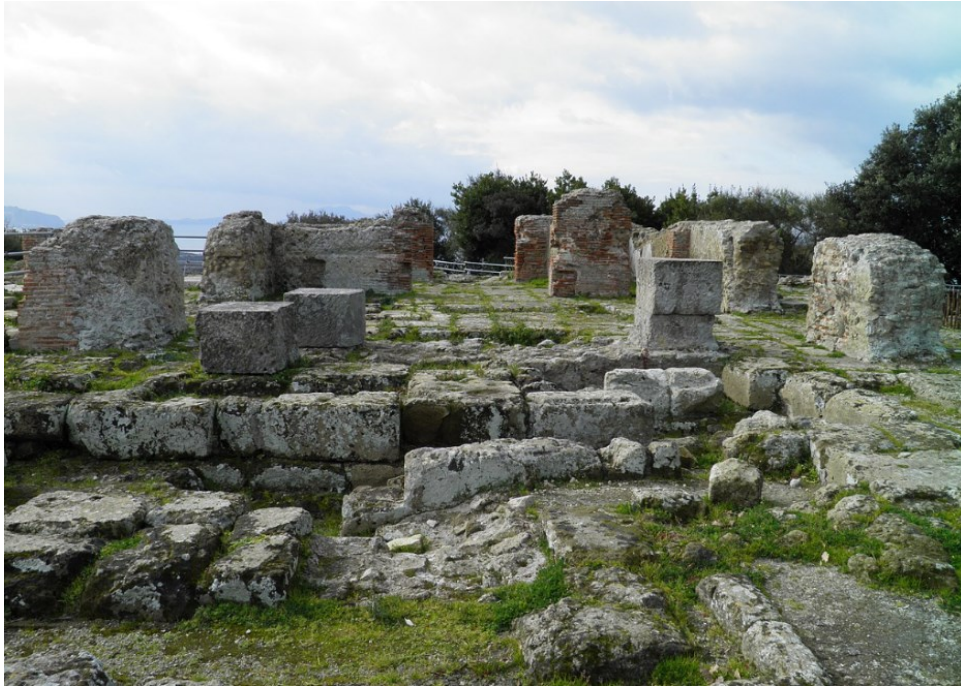
Slika 27. Ruševine Apolonova hrama u Kumi, 5. st.