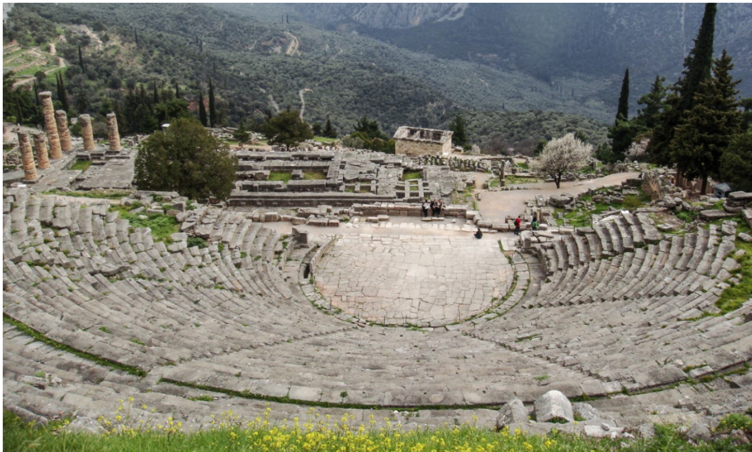
Slika 10. Kazalište u Delfima, 4. st. pr. Kr.

Najljepši pogled na Apolonovo svetište proteže se iz delfskog kazališta. Ovo je kazalište bilo poznato po svojoj odličnoj akustici i u njemu su bila održavana natjecanja iz poezije, govorništva, dramske umjetnosti i glazbe. Ovo je kazalište usječeno u prirodnu padinu planine Parnas na sjeverozapadu Apolonova svetišta. Na tom se mjestu prije njega nalazilo još jedno kazalište, a delfsko je na njegovu mjestu sagrađeno početkom 4. st. pr. Kr. u parskom kamenu i do danas je ostalo relativno dobro očuvano. Gledalište se sastojalo od stepeničastih sjedala u 35 redova koji su prolazom bili podijeljeni u višu i nižu zonu. 37 Kazalište je doživjelo proširenje oko 160. g. pr. Kr. zahvaljujući pergamskom kralju Eumenu II. koji je darovao novčana sredstva i robove u tu svrhu. 38 Ovo kazalište moglo je ugostiti oko 5 000 posjetitelja.