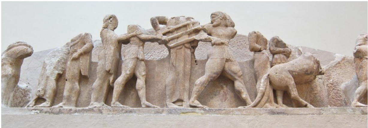
Slika 3. Dio istočnog zabata riznice Sifnjana, prikaz borbe Herakla i Apolona, 6. st. pr. Kr., Arheološki muzej u Delfima

Otok Sifno bio je bogat rudnicima zlata te je Apolon naredio da jednu desetinu prihoda šalju u Delfe ( Paus. 10.11.2). Od riznice Sifnjana in situ su ostali sačuvani samo temelji. Ona je bila malen jonski hram in antis , s dvije vitke karijatide umjesto stupova među bočnim zidovima pronaosa. Ovaj hram izgrađen je u razdoblju od 530. do 525. g. pr. Kr. Istočni zabat bio je ukrašen prizorom svađe između Herakla i Apolona oko delfskog tronošca u visokom reljefu. Skulpture koje su ukrašavale zapadni zabat nažalost nisu sačuvane. Friz se protezao uokolo čitave fasade riznice i bio je dugačak 29,63 m te obrubljen ornamentalnim vrpcama. Na sjevernoj strani je živopisno prikazana gigantomahija, a na istočnoj borbe iz Trojanskog rata. Zapadna strana bila je ukrašena prizorima iz legende o Parisu, a južna scenama otmice Leukipovih kćeri od strane Dioskura. 26