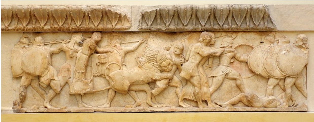
Slika 4. Dio friza na sjevernoj strani riznice Sifnjana, prikaz gigantomahije, 6. st. pr. Kr., Arheološki muzej u Delfima