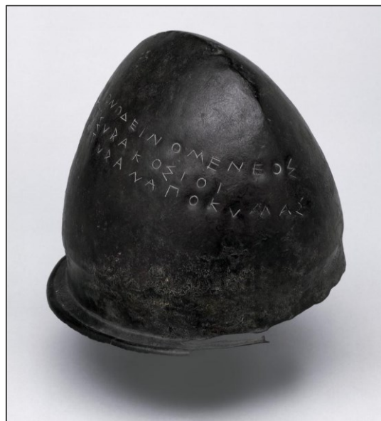
Slika 24. Etruščanska vojna kaciga s natpisom pronađena u Kumi, 5. st. pr. Kr., Britanski muzej u Londonu

Godine 474. pr. Kr. dogodila se bitka kod Kume u kojoj su se opet sukobili s Etruščanima. Kuma je zatražila pomoć od Sirakuze koja im šalje snažnu flotu te odnose pobjedu. Iz tog sukoba sačuvana je etruščanska kaciga s natpisom „Hijeron posvetio Zeusu u Olimpiji u znak zahvalnosti“, koja se danas čuva u Britanskom muzeju.