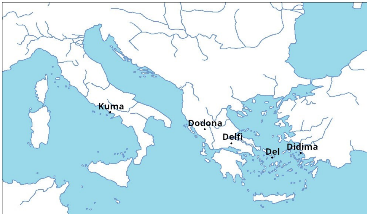
Slika 1. Geografski položaj proročišta obrađenih u diplomskom radu na slijepoj karti Mediterana

je izučavao retoriku i filozofiju. Nekoliko je puta posjetio Rim gdje je stekao naklonost careva Trajana i Hadrijana. Njegova djela općenito se mogu podijeliti u dvije velike kategorije: biografije i moralno-filozofske rasprave. Najpoznatiji je ipak po svom djelu Usporedni životopisi u kojem donosi paralelne biografije jedne grčke i jedne rimske značajne povijesne ličnosti. Za Plutarha je značajno istaknuti da je bio primljen u kolegij delfijskih svećenika boga Apolona.