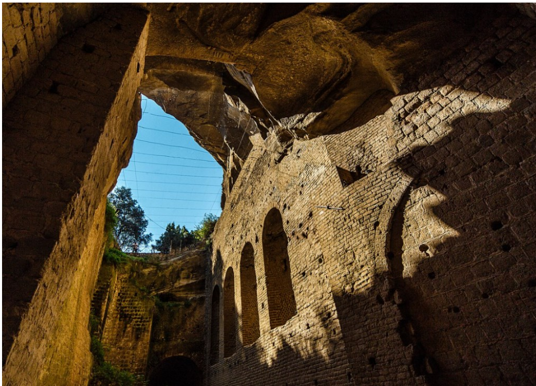
Slika 30. Galleria Romana, 1. st. pr. Kr.

Galleria Romana naziva se još i Crypta Romana. To je tunel iskopan ispod akropole u Kumi u smjeru istok-zapad. Probijen je 37. g. pr. Kr. kako bi se olakšao put od velikog brodogradilišta na Avernskom jezeru do luke Portus Julius koja se nalazila u sjeverozapadnom dijelu Napuljskog zaljeva. Izgradnja brodogradilišta na Avernskom jezeru i Gallerie Romane samo su dva u nizu projekata koje je poduzeo konzul Marko Vipsanije Agripa kada je Kumu pretvorio u izvanredni vojni kompleks za Oktavijana. Na tom su brodogradilištu izgrađeni mnogi brodovi koji su kasnije sudjelovali u bitci kod Akcija. 158 Strabon (5.4.5) pripisuje projektiranje Gallerie Romane Luciju Kokceju Auktu. Bio je dug oko 800 m i širok oko 4,5 m. Okončanjem sukoba između Oktavijana i Marka Antonija 31. g. pr. Kr. te premještanjem flote u luku Mizen 12. g. pr. Kr. tunel je izgubio svoju stratešku važnost, a od brodogradilišta su danas ostale samo ruševine od kojih se znatan dio nalazi pod vodom zbog podizanja razine vode u jezeru.