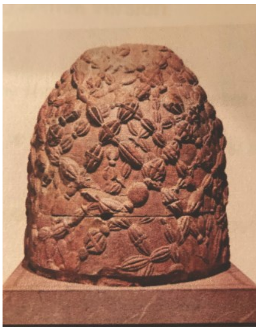
Slika 2. Sveti kamen omfalos, kopija grčkog originala iz helenističkog ili rimskog razdoblja, Arheološki muzej u Delfima