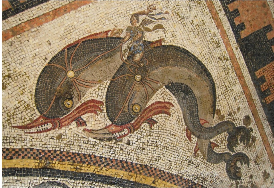
Slika 20. Podni mozaik iz Kuće dupina na otoku Delu, 2. st. pr. Kr.

Osim ovih raskošnih kuća ovdje su građeni i razni hramovi posvećeni stranim božanstvima, od kojih se mogu istaknuti Serapej, Izidin hram i Svetište sirijskih bogova. Na Delu su postojala čak tri Serapisova hrama koji se u literaturi nazivaju Serapej A, Serapej B i Serapej C. Svetište sirijskih bogova nadovezivalo se na sjevernu stranu najvećeg Serapeiona. Štovanje sirijskih bogova započelo je tijekom druge polovice 2. st. pr. Kr. Štovali su se Odada i Atargatis, koji su kasnije poistovjećeni s grčkom božicom Afroditom te orgijskim obredima vezanima uz kult plodnosti. Unutar ovog svetišta bilo je izgrađeno i manje kazalište koje je moglo primiti oko 500 posjetitelja, a kasnije su u njemu vođeni navedeni obredi kulta plodnosti. 100