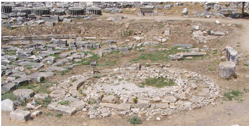
Slika 21. Ostaci arhajskog oltara ispred Apolonova hrama u Didimi, 6. st. pr. Kr.

Prije nego što su se Delfi uzdignuli do svog panhelenskog statusa tijekom Prvog svetog rata u 6. st. pr. Kr., Didima je bila najvažnije i najutjecajnije proročište jonskih Grka. Najstariji artefakt pronađen u Didimi ulomak je mikenske keramike iz 14. st. pr. Kr., no nema dokaza da je u Didimi postojalo svetište u to vrijeme. 106 Tek u kasnom 8. i ranom 7. st. pr. Kr. podignute su prve kultne građevine, ograđeni prostor oko oltara i sveti izvor vode. 107 Prema Pausaniji (5.13.11) taj je oltar izgradio tebanski Heraklo. U starogrčkom kultu oltar je bio najsvetiji dio svakog hramskog kompleksa. Zahvaljujući tome što je stajao ispred arhajskog hrama i stoga kasnije nije bio prekriven helenističkim gradnjama, oltar je do danas ostao dobro očuvan. Bio je okruglog oblika i izrađen od fino obrađenih vapnenačkih blokova. 108