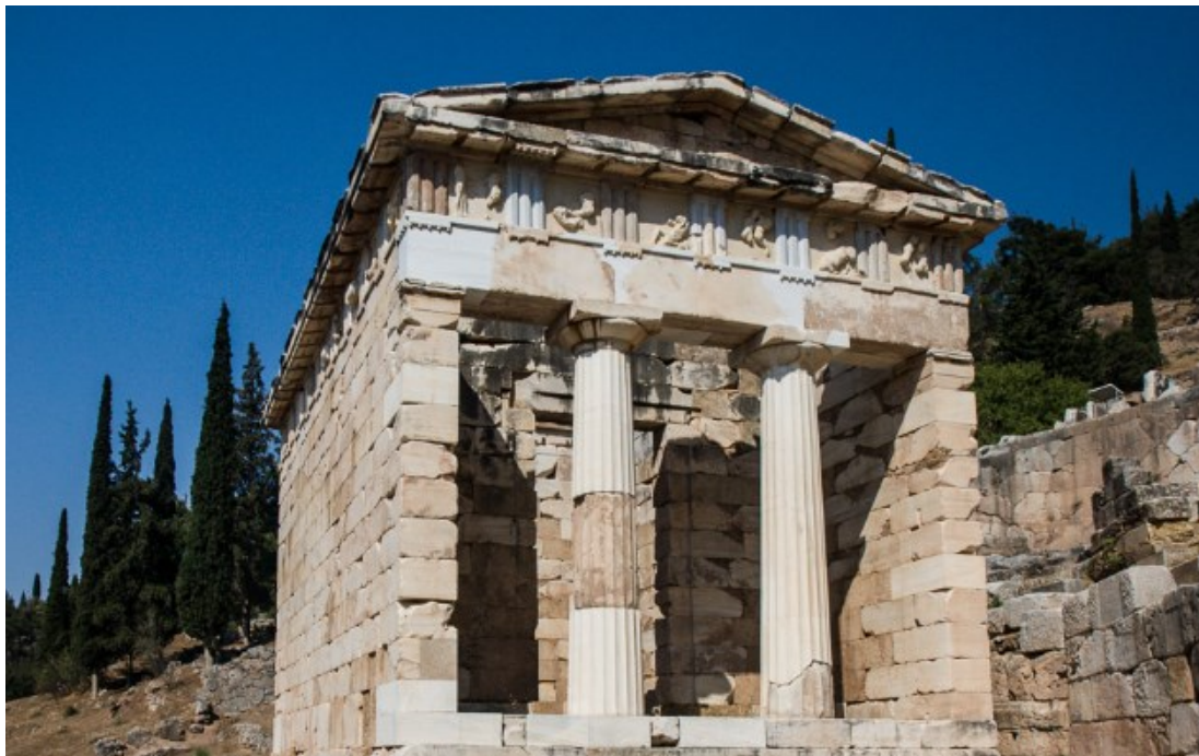
Slika 6. Riznica Atenjana u Delfima, 5. st. pr. Kr.

Riznica Atenjana podignuta je nedugo nakon bitke kod Maratona kako bi se u njoj mogao izložiti dio ratnog plijena. 27 Pauzanija piše da su se tu čuvali ukrašeni kljunovi lađa i brončani štitovi, a natpis na njima donosi gradove iz kojih su Atenjani poslali prvine od plijena (10.11.6). U nekoliko je navrata ova riznica bila restaurirana, a danas je ostala gotovo netaknuta na mjestu gdje se nalazila. I ova je riznica izgrađena u stilu hrama in antis , i bila je malo veća od hrama riznice Sifnijaca koja se nalazila niže od nje. Hram je izveden u dorskom slogu od parskog mramora, dimenzija oko 9,7 x 6,2 m. Nad arhitravom se izmjenjuju metope i triglifi, a friz je bio razvijen na 30 metopa. Amazonomahija ukrašava 6 metopa na pročelju. 9 metopa na južnoj strani prikazuju pothvate Egejeva sina Tezeja. 9 metopa na sjevernoj strani i 6 na zapadnoj prikazuju Heraklova djela. Danas su u Arheološkom muzeju u Delfima izložene 24 originalne metope, dok su na restauriranom hramu zamijenjene gipsanim kopijama. 28