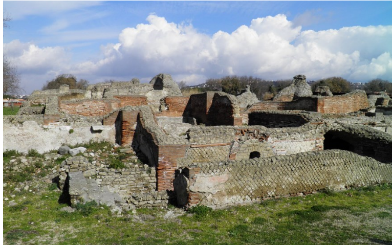
Slika 29. Ruševine rimskih termi na forumu u Kumi, 1. st. pr. Kr.

Tijekom arheoloških istraživanja foruma u Kumi otkrivene su velike rimske terme u čijoj je blizini bio izgrađen samnitski hram posvećen Jupiteru. Njega su u 2. ili 1. st. pr. Kr. Rimljani preinačili u trobrodni hram posvećen Kapitolijskoj trijadi. U stražnjem dijelu svake od lađa na povišenim su se bazama nalazili monumentalni kipovi Jupitera, Junone i Minerve. 156