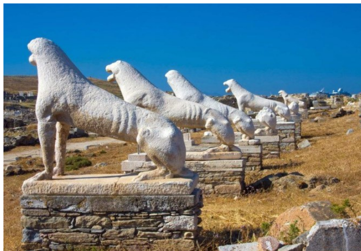
Slika 18. Terasa lavova na otoku Delu, 7. st. pr. Kr.

Ovdje su pronađeni i ostaci Letina hrama iz 6. st. pr. Kr. te Posejdonov trijem koji je sagrađen u 3. st. pr. Kr.