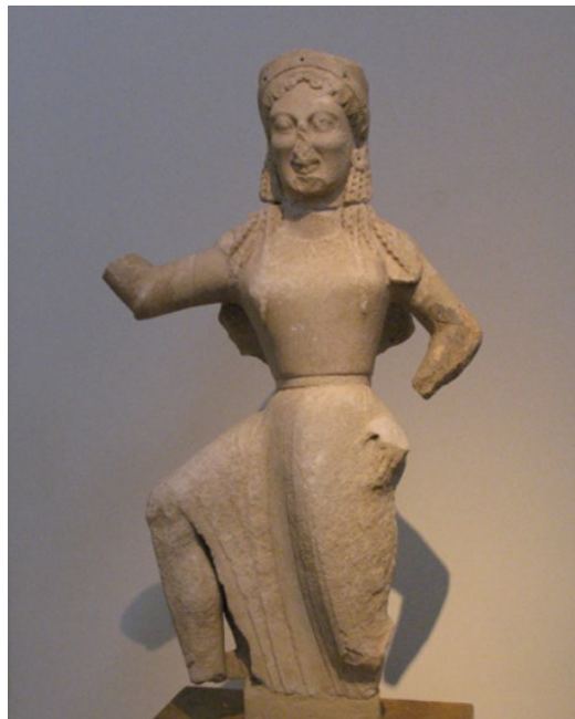
Slika 17. Arhermova Nika s otoka Dela, parski mramor, 6. st. pr. Kr., Arheološki muzej u Ateni

nastavljena u periodu između 1902. i 1914. godine. Tada su otkriveni neki spomenici iz ranijih povijesnih razdoblja otoka, a osobito se ističe kamena terasa s kipovima mramornih lavova iz 7. st. pr. Kr. Tada se iskopavao i Apolonov hram kod kojeg je otkriveno nekoliko važnih skulptura među kojima su bile ona božice Artemide iz 7. st. pr. Kr. i Arhermova Nika iz 6. st. pr. Kr., skulptura koja je krasila zabat Apolonovog hrama i značajan broj natpisa delskog hrama, većinom popisi imovine i računi, a datiraju se od 4. do 2. st. pr. Kr. 85 Francuska arheološka škola iz Atene ukupno je na Delu istražila 69 građevina.