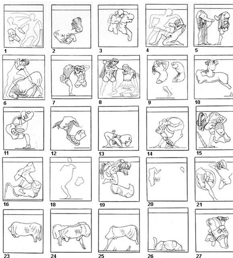
Slika 7. Prikazi na metopama riznice Atenjana u Delfima

Odmah do riznice Atenjana nalazio se Buleuterij. To je bila izdužena građevina pravokutnih temelja. Sjeveroistočno od Buleuterija bila je vidljiva tzv. Sibilina stijena – komad stijene na kojem je navodno stajala prva žena proročica čije je ime bilo Herofila, a nadimak Sibila, dok je pjevala svoja proročanstva ( Paus. 10.12.1-3). Više o Sibili u diplomskom radu opisano je kod proročišta u Kumi. Pored Sibiline stijene Atenjani su 478. godine izgradili svoj trijem u kojemu su kasnije izlagali ratni plijen s početka Peloponeskog rata. 29