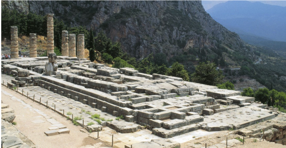
Slika 8. Apolonov hram u Delfima, 4. st. pr. Kr.

Ovdje trebamo spomenuti i slavnog Aurigu iz Delfa koji je iskopan unutar Apolonova svetišta 1896. godine. Ova statua bila je dio velike brončane skulpture koja je prikazivala pobjedničku kvadrigu Polizala na Pitijским igrama 478. ili 474. g. pr. Kr., a podignuta je u čast pobjede. 36 Prikazan je kočijaš s uzdama u rukama, a oko glave nosi pobjedničku vrpču. Plemenitost njegova stava i čistoća okomitih linija njegove odjeće samo su neki od elemenata ogromne kompozicije od koje su ostali sačuvani tek neki dijelovi. Auriga datira iz sredine 5. st. pr. Kr.