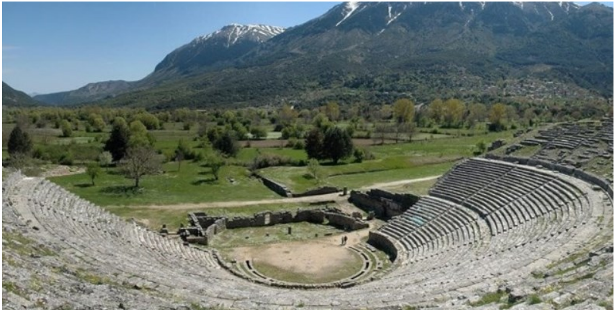
Slika 15. Kazalište u Dodoni, 3. st. pr. Kr.

Jugozapadno od kazališta otkriveni su ostaci stadiona. Iz arheoloških ostataka može se iščitati da su se na stadionu sjedala nalazila sa sjeverne, duže strane koja je bila usječena u kosinu. 74