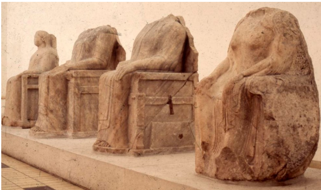
Slika 22. Kipovi svećeničke porodice Branhida otkriveni sa strana Svete ceste između Mileta i Didime, Britanski muzej u Londonu

Ceste koje povezuju svetišta s njihovim gradovima zaštitnicima, kao što je bio slučaj s Didimom i Miletom te Kumom, često su same po sebi bile monumentalne. S obje strane Svete ceste stajali su spomenici, a tu su otkriveni i kipovi svećeničke porodice Branhida koja je upravljala proročištem u Didimi do perzijske provale 494. g. pr. Kr. 128 Znanstveno zanimanje za Svetu cestu poraslo je tijekom otprilike 200 godina arheoloških istraživanja u regiji. Ova Sveta cesta smatra se jednim od najbolje dokumentiranih primjera procesijskog puta iz antičkog svijeta, a pretpostavlja se da je njezina ruta ostala relativno nepromijenjena od arhajskog do rimskog razdoblja. 129 Njeni temelji otkriveni su 1907. godine.