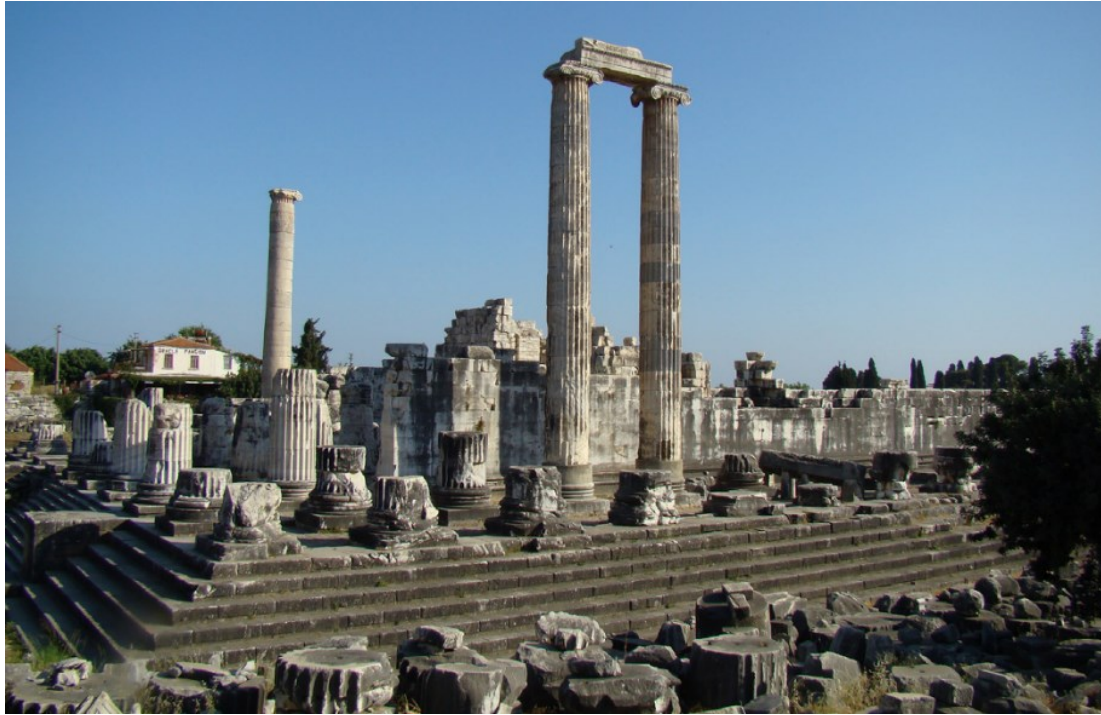
Slika 23. Ostatci Apolonova hrama u Didimi iz vremena helenizma