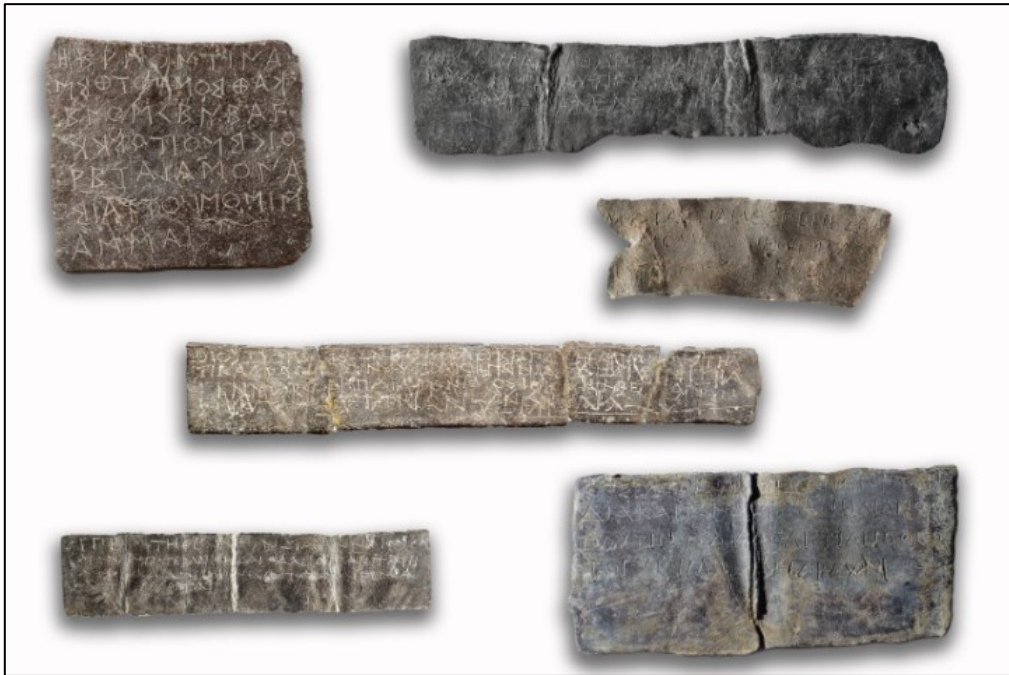
Slika 14. Olovne pločice s upitima za proročište u Dodoni, 4. i 5. st. pr. Kr., Arheološki muzej grada Janjine

Čini se da je od najranijih vremena postojala veza Majke Zemlje i Zeusova proročišta u Dodoni. Drevni napjev koji su pjevale svećenice proročišta bio je u čast ne samo Zeusa, nego i Geje. Međutim, tek nakon Homerova vremena ova je božica zemlje bila personificirana kao Zeusova supruga i identificirana kao Diona. 64 Ni Homer ni Heziod ne povezuju božicu Dionu s Dodonom. Zeus se nigdje osim u Dodoni nije smatrao mužem Majke Zemlje, no Diona je ostala Zeusova žena u Dodoni čitavo vrijeme djelovanja proročišta. Zeus i Diona imali su kćer, božicu Afroditu. Prema drugoj verziji mita, Afrodita je rođena iz morske pjene nakon Uranove kastracije ( Hes. Th. 173). Ploveći na školjci najprije je došla na Kiteru, potom na Peloponez, a u konačnici na Cipar. U Pafu na Cipru se nalazilo glavno sjedište njezina kulta. 65 Afrodita se u Dodoni pojavljuje relativno kasno i čini se da je bila samo štovana, a ne smatrana i proročkom božicom. Tako je u Dodoni postojala trijada božanstava koju su činili Zeus, Diona i Afrodita, iako se na početku tu štovao samo Zeus. 66