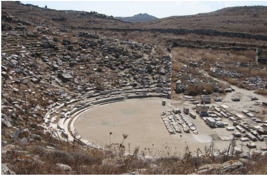
Slika 19. Kazalište na otoku Delu, 4. st. pr. Kr.

Južno od Apolonova hrama prostire se stambena kazališna četvrt. Tako se nazivala zbog velikog kazališta koje je imalo kapacitet za primiti oko 5 500 posjetitelja, a danas su uglavnom ostala sačuvana sjedišta s orkestrom, koja je obnovljena. Između 2. i 1. st. pr. Kr. tu su izgrađene desetine kuća sa središnjem dvorištem. 98