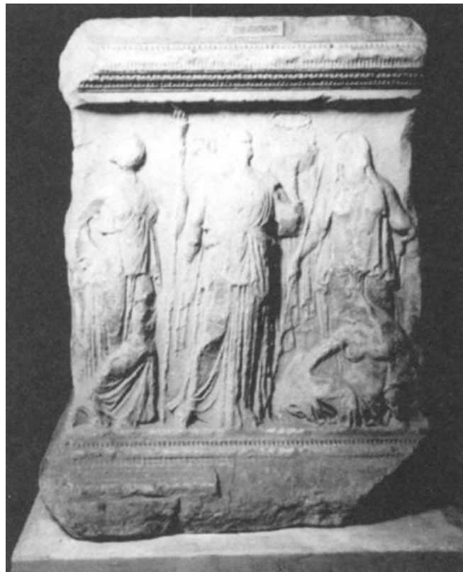
Slika 28. Baza za kip pronađena u gradu Sorrentu s prikazom Apolona, Dijane, Lete i Sibile, 1. st. pr. Kr., Arheološki muzej u Napulju