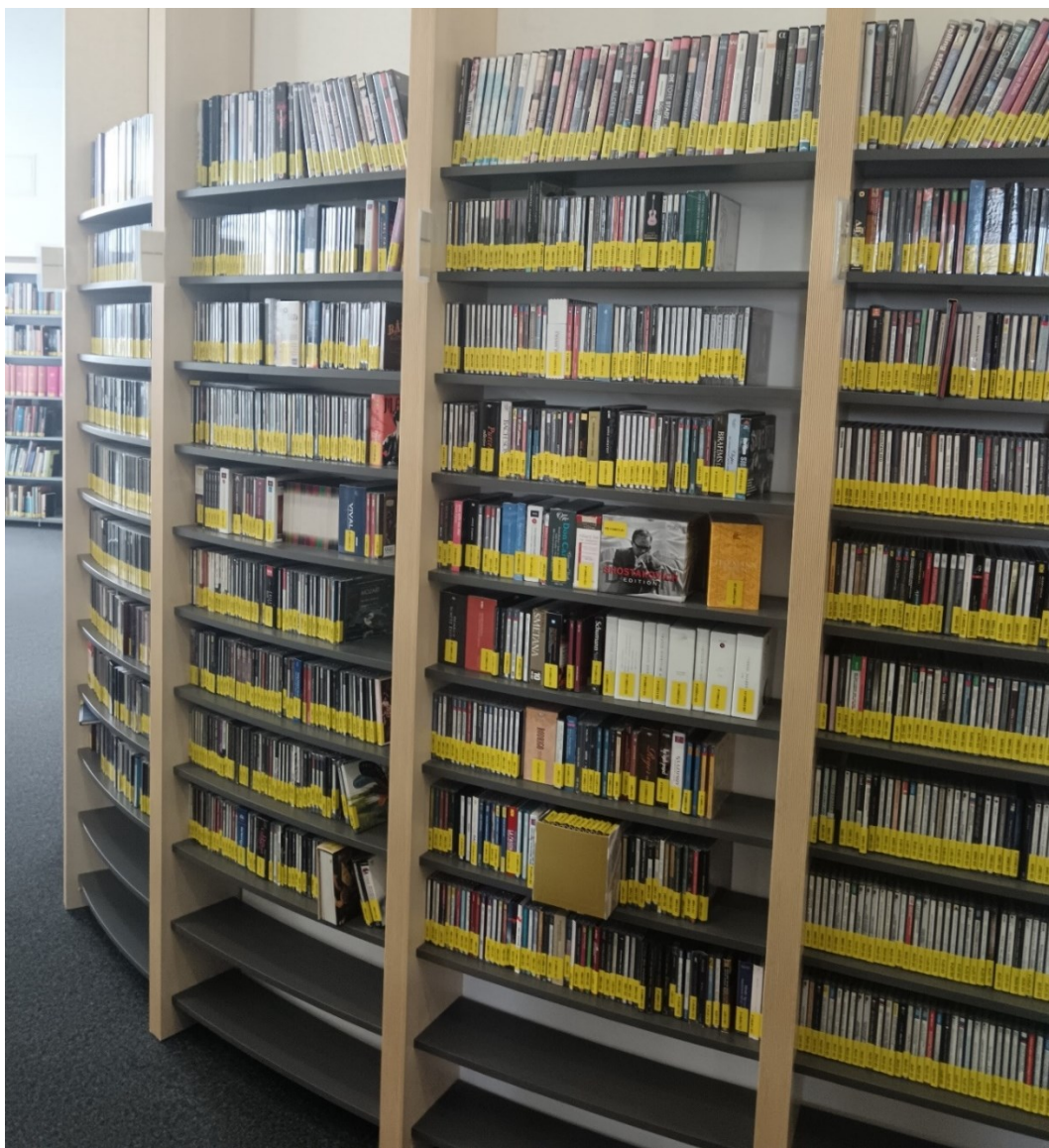
Fotografija 5. Dio glazbene zbirke Knjižnice Csorba Győző (Privatna zbirka, 2024.)

Godine 2012. započela je digitalizacija glazbenih dokumenata. Prioritetno se presnimavaju gramofonske ploče s mikrobrazdama i audiozapisi rijetkih programskih kaseti, a usporedo s tim digitalizira se i već spomenuta zbirka zvučnih zapisa Andora Tiszaya koju je knjižnica odlučila u potpunosti obraditi, profesionalno pohraniti i staviti na raspolaganje istraživačima. (Gyánti et al. , 2013).