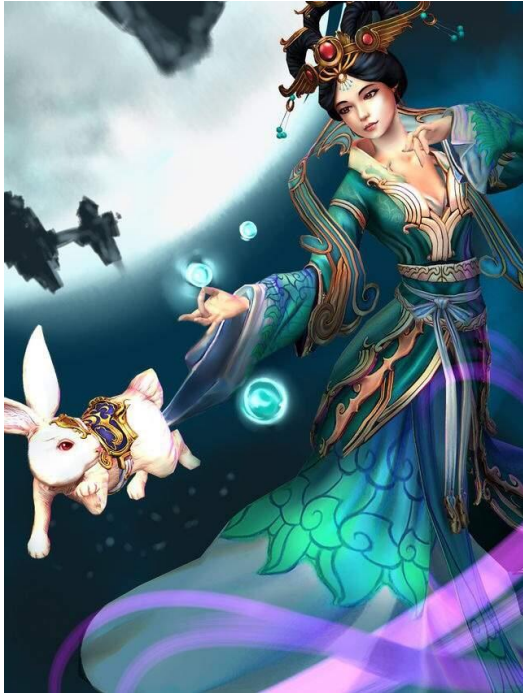
Chang 'e iz videoigre Smite