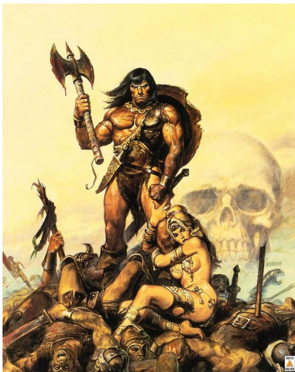
Slika 7. Conan the barbarian

Muškarci su, ne samo po izgledu nego i ponašanju, predstavljeni kao snažni heroji čija je sudbina spasiti svijet i ubiti čudovišta. Eugene F. Provenzo, Jr. (1991) analizirao je takve ilustracije i zaključio da su žene prikazane na provokativan način, ali i kao pokorene žrtve koje se treba spasiti. On smatra videoigre opasnima za mladež jer nameću rodne stereotipe koji mogu rezultirati seksualnom diskriminacijom prema ženama (Provenzo, 1991 prema Sherman, 1997). Radi takvih razloga nije ni iznenađujuće da muški igrači ne gledaju na ženske karaktere, pa time i ženske igračice sebi ravnima.