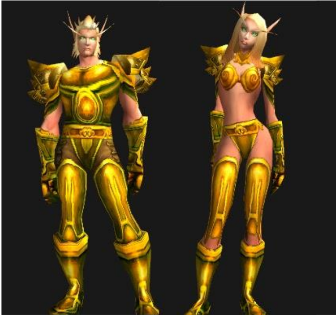
Isti oklop na muškom i na ženskom avataru iz videoigre World of Warcraft

Muški karakter je u potpunosti prekriven i spreman za bitku, dok ženski karakter nije ni približno spreman za bilo kakav oblik borbe. Žene se u takvim videoigrama također mogu naći pokraj muškarca, često kao ukras koji grli njegovu ruku ili nogu. Žene samo služe kao objekt koji je lijep za gledati i/ili kao jadne slabe dame koje snažan heroj treba spasiti jer su one preslabe da se same spase ili da one budu heroj koji će spasiti muškarca. Takav primjer možemo vidjeti na sljedećoj slici.