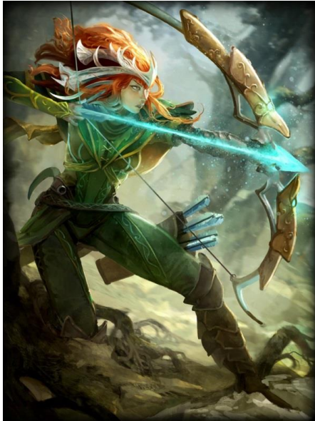
Prikaz Artemide u videoigri Smite