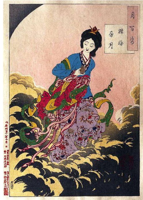
Chang'e, umjetnik Tsukioka Yoskitoshi, 1885.

Slika 1. je Chang'e u videoigri Smite dok je Slika 2. od umjetnika Tsukioka Yoshitoshia. Glavna razlika između jedne i druge slike je zec koji se nalazi u prvoj slici. Iako se ne pojavljuje na drugoj slici, taj bijeli zec je, u izvornoj mitologiji, njezin ljubimac (Hamilton, 2022). Razlike između ove dvije slike su očite, ali postoje i brojne sličnosti. Chang'e je u videoigri prikazana kao žena kineskog podrijetla s blijedim licem, podignuta kosa sa zlatnim dodatkom koji sadrži rubin, plava haljina, detalji na haljini i sl. Videoigra naravno nije kopija, ali nastoji koristiti inspiraciju iz pravog svijeta i pravih mitova te čini jednostavan i zabavan uvod u temu.