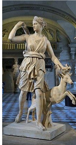
Skulptura Artemide, umjetnik „Leochares”, 4. st. pr. Kr.

U igri ona izgleda kao lovac, ima luk i strijelu, postavlja zamke, ima divlju svinju (u mitologiji Artemida je poslala divlju svinju kao znak njezine osvete (Editors of Encyclopaedia Britannica, bez dat.)) i oklop napravljen od lišća. Igrači su dakle samo igranjem naučili njezino ime i da je lovac, bez da su morali aktivno tražiti informacije o njoj. Ona je samo jedan primjer od više od sto bogova. Ako se igrač zainteresira za Smite i odluči je igrati na duže vrijeme, onda će najvjerojatnije naučiti o svim bogovima koje igra pruža igračima. Smite također često ima „izazove” gdje igrači moraju igrati boga koji pripada određenom panteonu kao što je grčka, nordijska ili rimska mitologija. Ovo spominjem jer time igrač uz zabavne izazove uči koji bogovi pripadaju kojem panteonu i time kojoj naciji. Ne mogu dokazati jesu li dizajneri točni ili nisu jer nema literature koja potvrđuje ili negira točnost činjenica. Zbog tog razloga videoigre mogu biti kvalitetan temelj o nekoj temi, ali ne u potpunosti točan izvor. Za još jedan primjer uzimam boginju „Chang’e”. Ona je predstavljena kao kineska žena koja nosi tradicionalnu kinesku haljinu te joj je frizura uređena na tradicionalan kineski način s brojnim ukrasima i dodacima. Dizajneri su uzeli mit, protumačili ga i napravili karaktera koji je sličan izvoru, ali nije u potpunosti točna kopija.