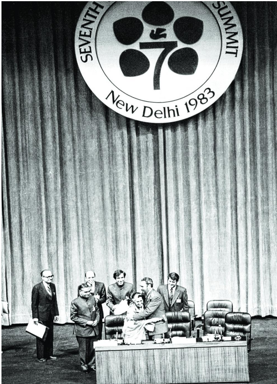
Prilog 7 66

Za Sedmu konferenciju Pokreta nesvrstanih zemalja se ukratko može reći kako je po svemu viđenom bila – ništa novo, odnosno, ponavljali su se svi ciljevi koje se već čulo na prethodnih šest samita, ali se po pitanju većine njih nije ništa konkretno poduzelo. Čak ni to da se promijenila država domaćin nije bilo novost. Uvodni govor je, kao što je i običaj, održala premijerka zemlje domaćina, Indira Gandhi, koja se uglavnom referirala na svjetske ekonomske probleme i rastući tehnološki jaz između razvijenih i nerazvijenih zemalja. Očekivana i