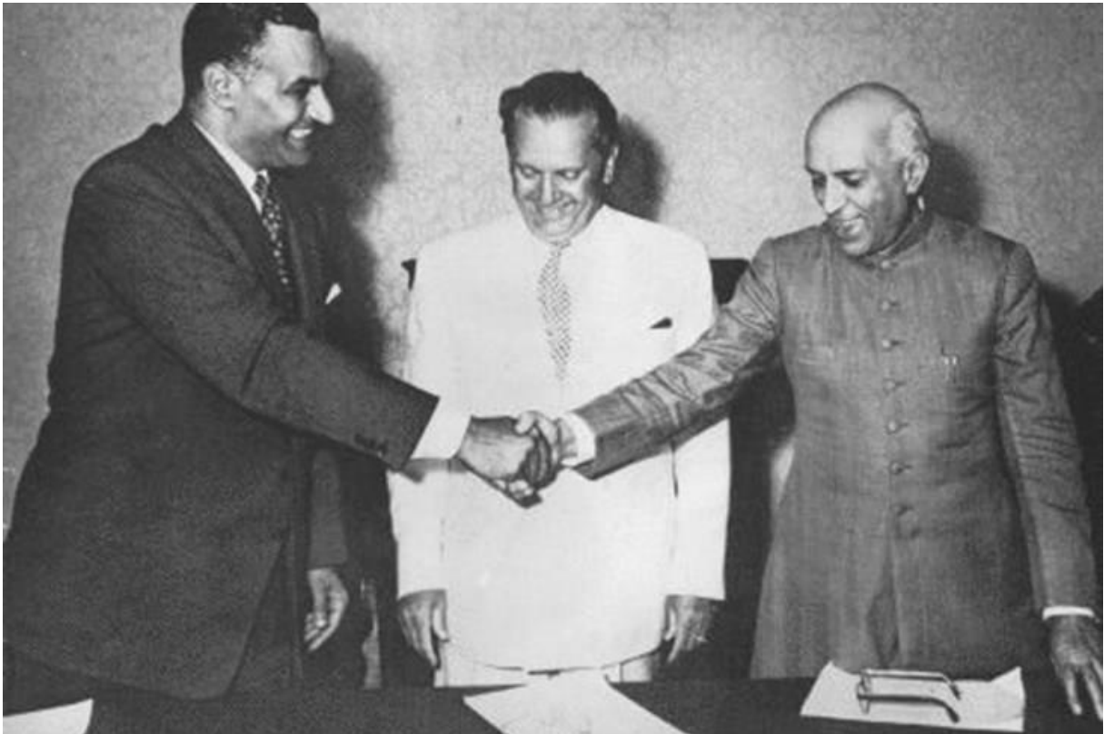
Prilog 1 5

ušao u svakodnevnu upotrebu, a ubrzo i u službeni naslov Pokreta nesvrstanih zemalja. 3 Sam Pokret nesvrstanih službeno je utemeljen na Brijunima 1956., na sastanku Tita, Nehrua i Nasera, što je izazvalo paniku prvenstveno u redovima Sovjeta, koji su, očito, pretendirali da većinu država osnivačica i članica pripoje istočnom bloku kamo im se činilo da siromašne i velikim dijelom socijalističke zemlje i pripadaju. 4