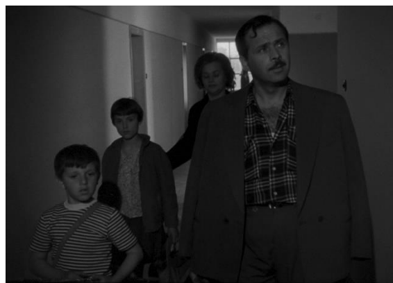
28. 1. Moj stan

Ironijski žalci Berkovićeva filma usmjereni su i prema ostalim manifestacijama socijalističkog društva. Tako se kroz naratoričine komentare ironijski razotkriva nemoć malog čovjeka pred sistemom („Moj tata je strašan kad lupi šakom o stol. Drug Holjevac bi se uplašio i odmah nam dao veći stan“) i korumpiranost sistema („Moja mama kaže da su samo budale poštene, ali ona to samo tako kaže“). Posebno je provokativno ironijsko sugeriranje izrazitih socijalnih razlika u jugoslavenskom društvu. Naime, djevojčica kroz naratorov govor kaže: „Ako netko nije sretan i zadovoljan, dovoljno je da pogleda kroz prozor i odmah mu postane lijepo u njegovom stanu...“ Nakon toga u prizoru vidimo bijedne siromaške kuće, odmah pokraj zgrade u kojoj živi djevojčica. Moj stan izrazito je duhovit i veseo kozerijski film, što mu je zasigurno pomoglo da, poput ostalih društveno kritičnih kozerijskih filmova (s iznimkom Cherchez la femme ), izbjegne cenzuru, bunkeriranje ili prigovore političkih struktura.