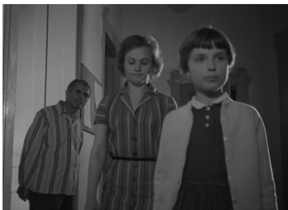
28. Moj stan