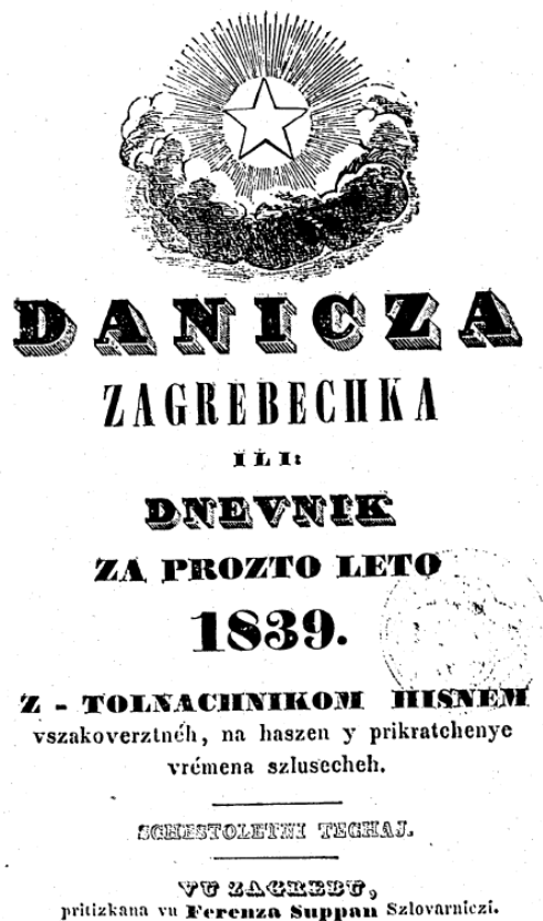
Slika 5. Naslova stranica Danice iz 1839.