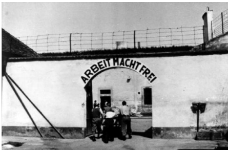
Slika 2 Logor Terezin sjeverno od Praga.

Rothschild, jedinoj preostalog bolnici u Beču koja je zapošljavala Židove i liječila židovsko stanovništvo. U bolnici upoznaje svoju suprugu Tilly Grosser, medicinsku sestru koju nacisti prisiljavaju na pobačaj njihovog djeteta. U to vrijeme je, riskirajući vlastiti život, postavljajući lažne dijagnoze pomogao brojnim pacijentima u izbjegavanju nacističkog programa eutanazije usmjerenog na mentalno poremećene osobe. U svom radu Psihološko samoodređenje zauzeo je stav protiv zlouporabe autoriteta terapeuta za nametanje vlastitog svjetonazora pacijentima s naglaskom na neobuzdane njemačko-nacionalističke ideologije. 43 Buktanjem antisemitizma 1942. Frankl je, unatoč činjenici kako je od 1940. imao useljeničku vizu za Ameriku, s obitelji poslan u koncentracijski logor Terezin 44 gdje su mu ubili oca. Ostali preživjeli iz obitelji Frankl odvedeni su u Auschwitz gdje su mu u plinskim komorama istrijebljeni brat i majka, a supruga Tilly umrla je od posljedica tifusa u logoru Bergen-Belsenu. Viktor Frankl proveo je tri godine u četiri koncentracijska logora. Dolaskom u koncentracijski logor Auschwitz – Birkenau bio je prisiljen baciti svoj neobjavljeni rukopis prve verzije knjige Liječnik i duša .