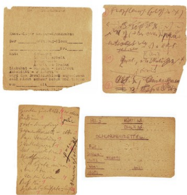
Slika 3 Rekonstrukcija rukopisa knjige Liječnik i duša .

Frankl je bio svjedok strahota nacističkog režima tijekom Drugog svjetskog rata, a patnja koju je tamo iskusio učvrstila ga je u uvjerenju kako je smisao života jači od svega. Bio je zatočen u koncentracijskim logorima, uključujući Auschwitz, gdje je suočen s neizmjernom patnjom, gubitkom voljenih osoba i svakodnevnim ekstremnim uvjetima pa ga upravo ta iskustva potiču na promišljanje o prirodi ljudskog postojanja i potrebi za smislom. Prilikom ulaska u Auschwitz, Viktoru Franklu su oduzeti svi osobni posjedi, uključujući i rukopis knjige "Liječnik i duša", u kojoj je već tada razvio osnovne ideje logoterapije. Tijekom boravka u Aushwitzu, Frankl prema sjećanju zapisuje knjigu u dijelovima na komadima papira koje je kriomice skupljao po logoru.