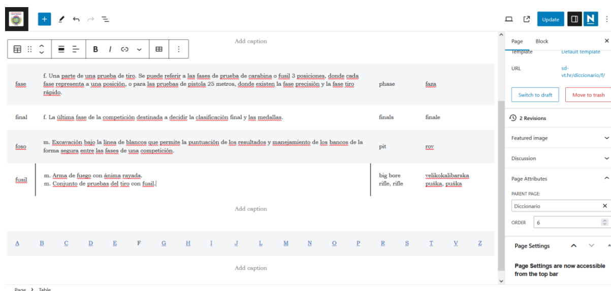
Figura 5. Redacción del diccionario en línea

Una vez redactados los artículos lexicográficos y sistematizados por el orden alfabético, se pudo empezar la fase final. La fase final de la producción del diccionario ha consistido en la presentación del diccionario, que se ha hecho en la forma de papel para el propósito de este trabajo, y en la versión en línea dado a la disponibilidad e hipertextualidad necesaria para la futura expansión a otras lenguas. La formación de la versión en papel consistía en transferir las celdas con los datos seleccionados del programa Excel al programa Word, y hacer modificaciones relacionadas al estilo del texto. La redacción de la versión en línea empezó con la creación de página en el sitio web «sd-vt.hr», con la subcarpeta «/diccionario», lo que se puede ver en la Figura 5: