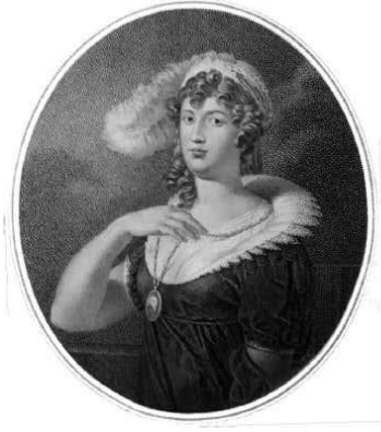
Slika 2: Ivana Baptista Kovačić, autor: Friedrich John