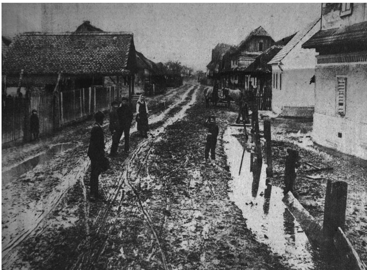
Slika 6. Selo Mraclin prije asanacije