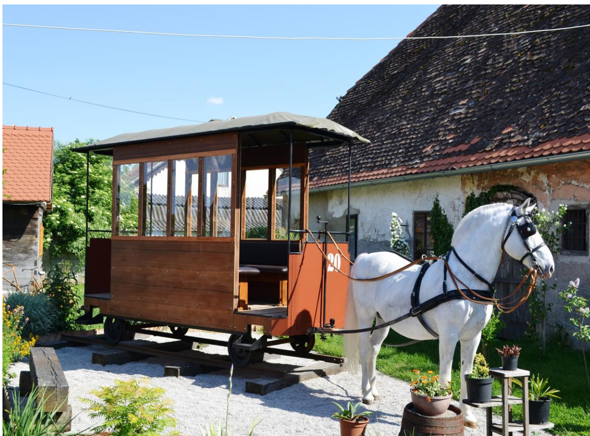
Slika 5. Rekonstrukcija kojnače u Novom Čiču