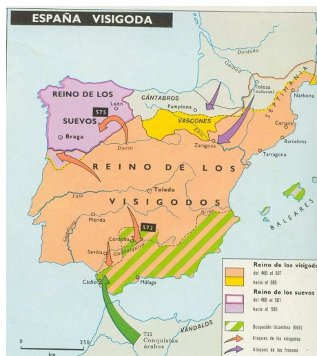
Mapa 2. Península bajo los germanos

En el año 409, los primeros pueblos germánicos, los vándalos, suevos y alanos atraviesan los Pirineos, seguidos por los visigodos en el 416. Los alanos se asientan en Lusitania, pero son aniquilados en poco tiempo (en la nomenclatura, dejan huellas como Puerto del Alano > Huesca) por los visigodos, y los vándalos se asientan en la Bética, pero en poco, expulsados también por los visigodos, pasan a África. Embarcan cerca de Tarifa, por eso se supone que el nombre de Andalucía se refiere a los vándalos: *[Portu] Wandalu , pronunciado por los griegos como *[Portu W] andalusiu , el término en el que origina el árabe al-Ándalus (Lapesa, 1980: 116). Por otro lado, los suevos, situados en Gallaecia, resisten a los visigodos por mucho tiempo. En los comienzos, su reino, con la capital en Braga, es extenso, pero ya alrededor del 570 se va reduciendo bajo la presión visigoda (ver mapa 2).