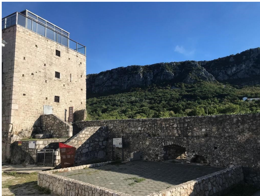
Slika 11. Pogled na bibrsku kulu Turan i ostatke gradine, te pozornicu na kojoj se predstavljaju Ružice