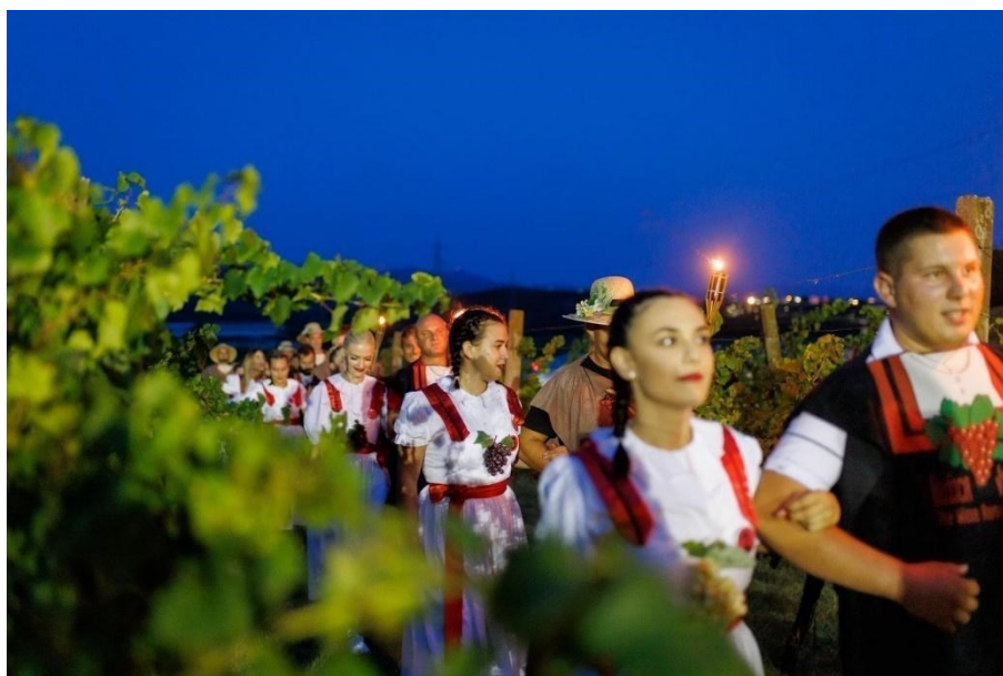
Slika 31. Povorka u Pavlo Miru, prvi dan natjecanja. Objavljeno: 21.8.2022.

Kako odjevni predmeti predstavljaju specifičan vizualni element kojim se dodatno naglašava značaj i posebnost “Ružice Vinodola”, svim sudionicima manifestacije propisano je nošenje simboličnih kostima, ali i odore oblikovane po tradiciji novljanske narodne nošnje. 9 Osim KUD-a odjevenog u narodnu nošnju, djevojke koje se natječu za Ružicu odjevene su u bijelu tzv. “radnu odoru”, stiliziranu prema tradiciji ženske novljanske narodne nošnje 10 , točnije berhana . Berhan je nošnja bijele boje, izrađena od pamučnog pikea, koju su nosile mlade djevojke i snahe, a nekada su se u njoj i vjenčale mladenke (Internetski izvor 62). Radna odora Ružice sastoji se od bijele košulje kratkih rukava obrubljenih čipkom, ovratnik i rukavi izvezeni su “na blage