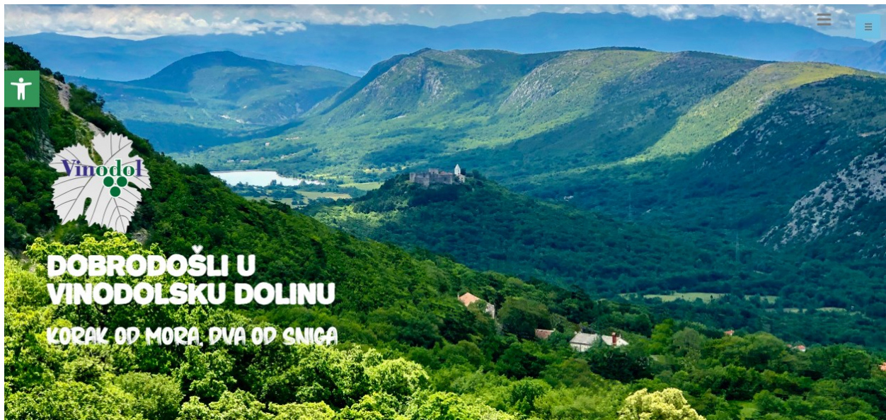
Slika 2.: Prikaz naslovne strane internetske stranice Turističke zajednice Vinodolske općine. Izvor: web stranica tz-vinodol.hr (Pristup: 11.9..2023.)

Tek u nekoliko natuknica HTZ predstavlja kulturno nasljeđe Vinodola spominjući glavne ljetne manifestacije Vinodolske ljetne večeri i Ružica Vinodola te zimski Mesopust, zatim muzejsku zbirku važne povijesne umjetničke ličnosti Jurja Julija Klovića i graditeljsku baštinu starih Vinodolaca - vrela i perila. Jednako tako, kulturno nasljeđe je predstavljeno i za grad Novi Vinodolski, naglašavajući najvažniji narodni običaj Novljanski mesopust i kolo kao stoljetnu tradiciju koja se mora doživjeti te posjet Starom gradu, župnoj crkvi, Kaštelu i kuli Kvadrac kao svjedokom frankopanskog razdoblja. Također su navedene i najistaknutije ljetne manifestacije vezane uz povijesno nasljeđe grada i/ili gastronomsku ponudu: Ljetni karneval, Okolotorno, Fešta od kilometra, Ružica Vinodola te Novljanski gušti.