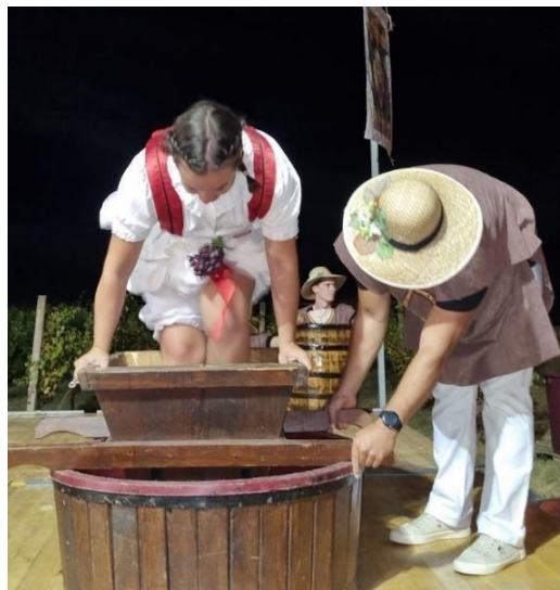
Slika 16. Druga igra: Ručno mašćenje grožđa uz provjeru sudaca. Objavljeno: 19.8.2022.