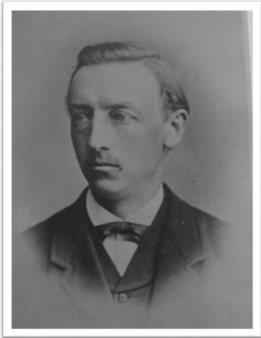
Slika 2. Alexander Conze (AES 1901, 1).