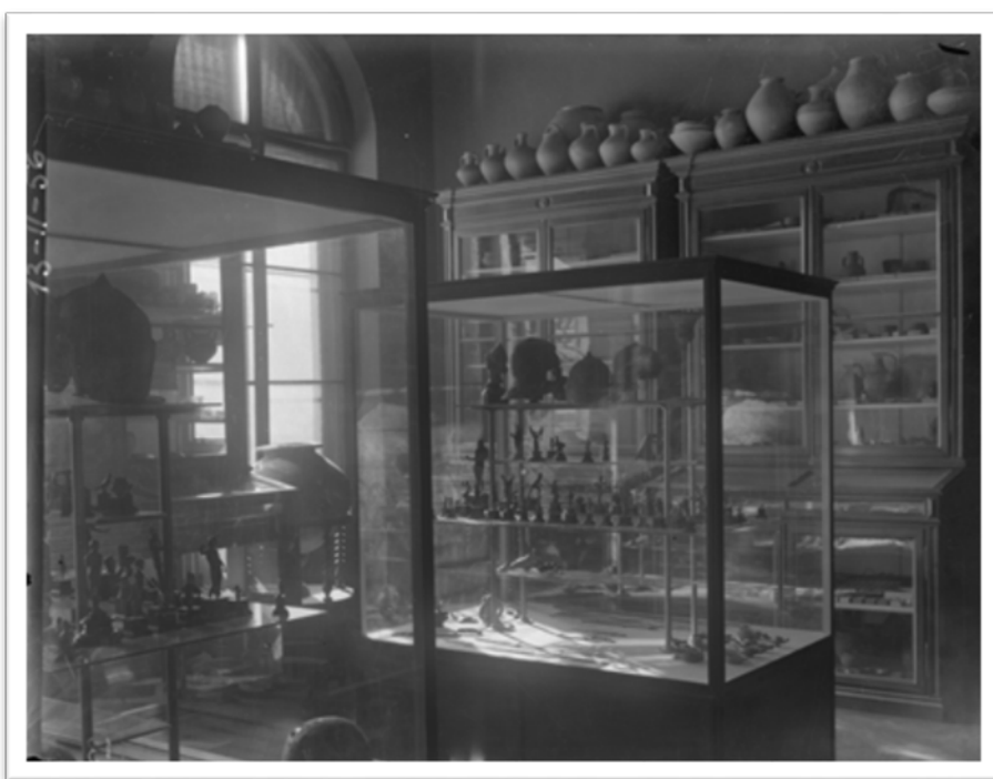
Slika 8. Stalni postav Arheološkog odjela u palači Akademije, Zrinjevac 11, AAMZ SP 13-II-56 (Solter 2016, 116).