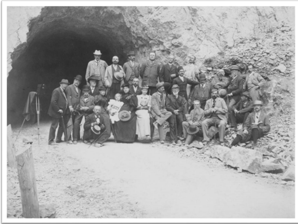
Slika 11. Bečko antropološko društvo, Vrbas kod Jajca, 1895. (Solter 2016, 83).