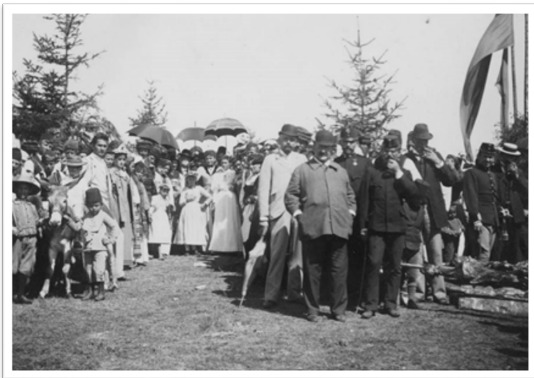
Slika 12. Bečko antropološko društvo, Vrbas kod Jajca, 1895. (AAMZ 73).