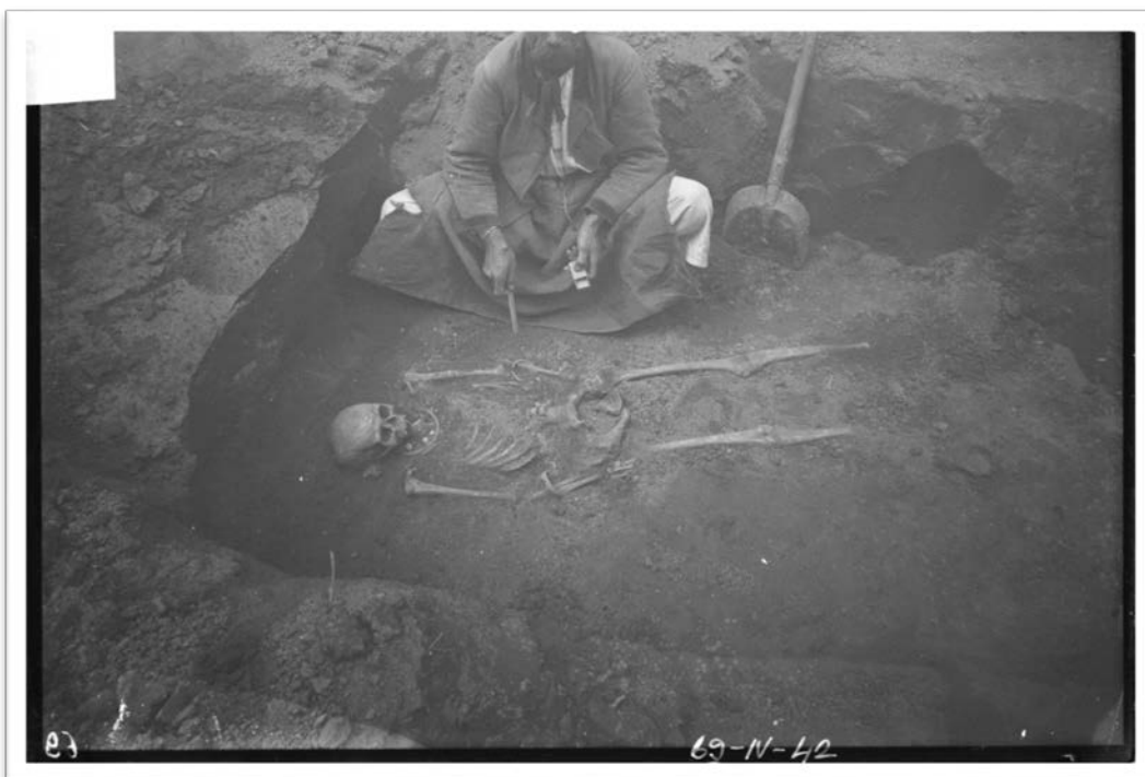
Slika 13. Arheološka iskopavanja na lokalitetu Bijelo Brdo, 1896. ili 1897. (Solter 2016, 94).