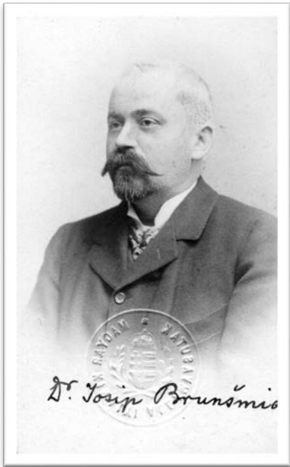
Slika 17. Josip Brunšmid, 1907. (Solter 2016, 81).