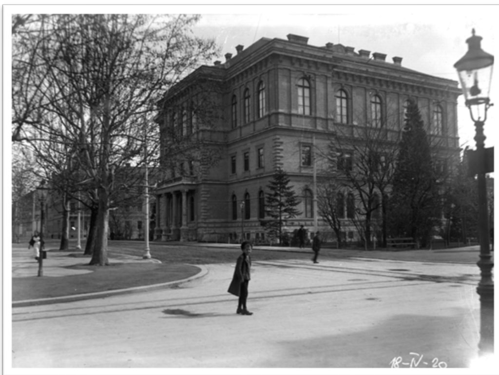
Slika 7. Palača Akademije, Zrinjevac 11, 1910. – 1926., AAMZ SP 18-IV-020 (Solter 2016, 52).