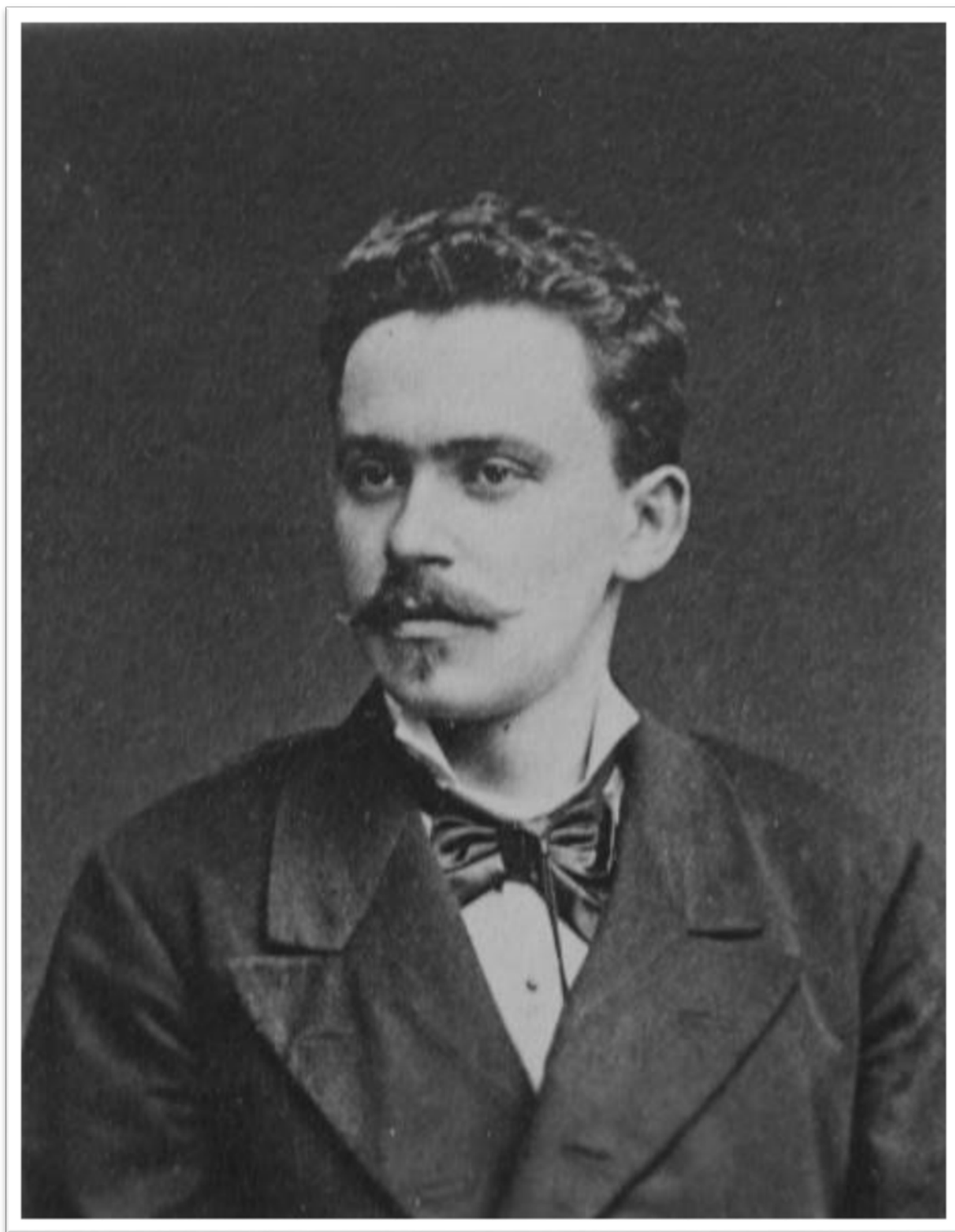
Slika 1. Josip Brunšmid, oko 1880. (AES 1901, 8).