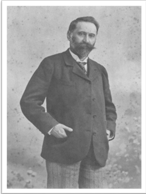
Slika 6. Isidor Kršnjavi, oko 1900. (Solter 2016, 84).