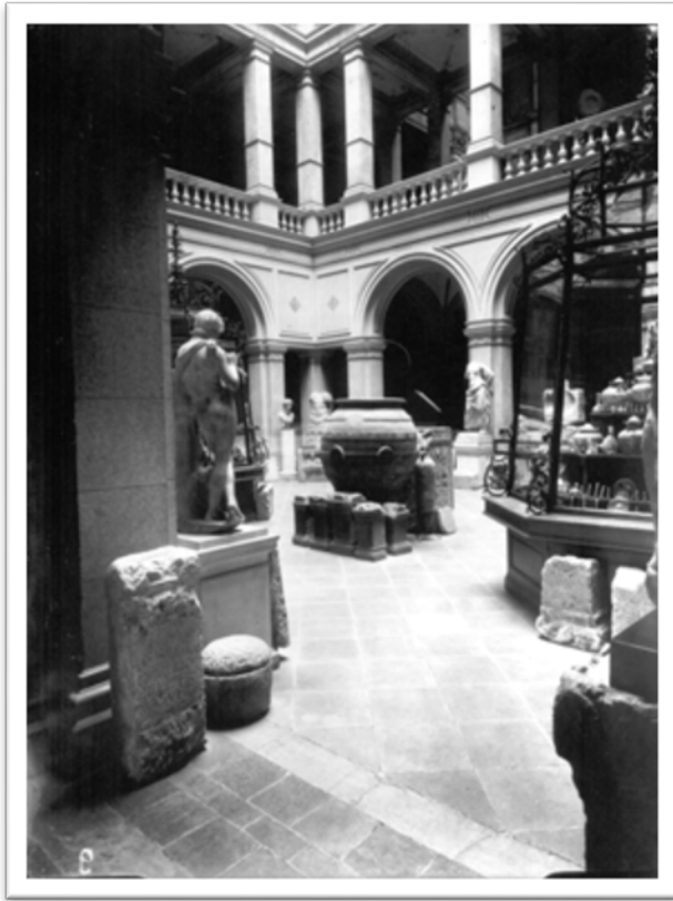
Slika 9. Stalni postav Arheološkog odjela u palači Akademije, Zrinjevac 11, AAMZ SP 9-II-54 (Solter 2016, 110).