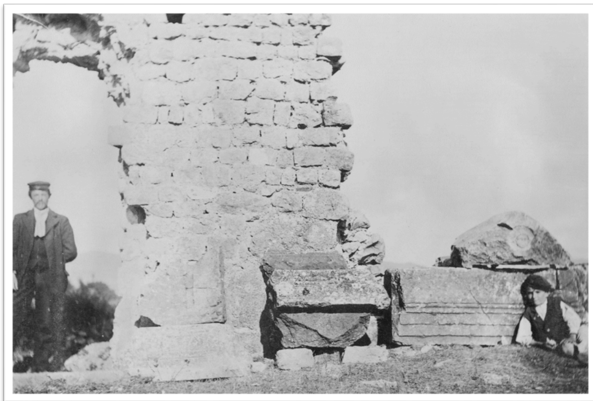
Slika 16. Podum, snimio J. Brunšmid, 1900. (FKB-7375).