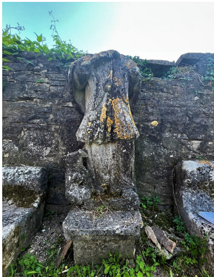
Slika 7. Neznani kipar, Kip sv. Ivana Nepomuka, Pazin

Uz desnu nogu sveca nalazi se mali anđeo u lošem stanju. Anđeo je izlizan i oštećen do neprepoznatljivosti, pa se može identificirati zahvaljujući tome što je riječ o jednom od češćih ikonografskih motiva prikazanih uz skulpturu sv. Ivana Nepomuka. Također, mali anđeo koji se pojavljuje uz nogu sv. Ivana Nepomuka čest je motiv na području unutrašnjosti Istre i kao takav može se vidjeti na primjerima u Gračišću i Pićnu.