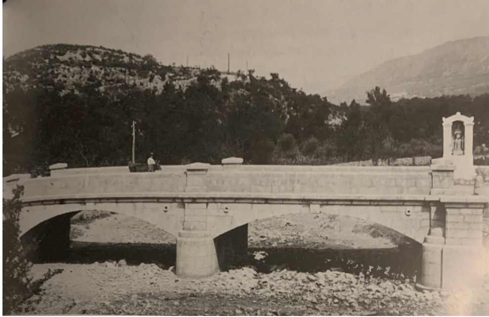
Slika 27. Kip. sv. Ivana Nepomuka na mostu preko Ričine, prije 1943. godine