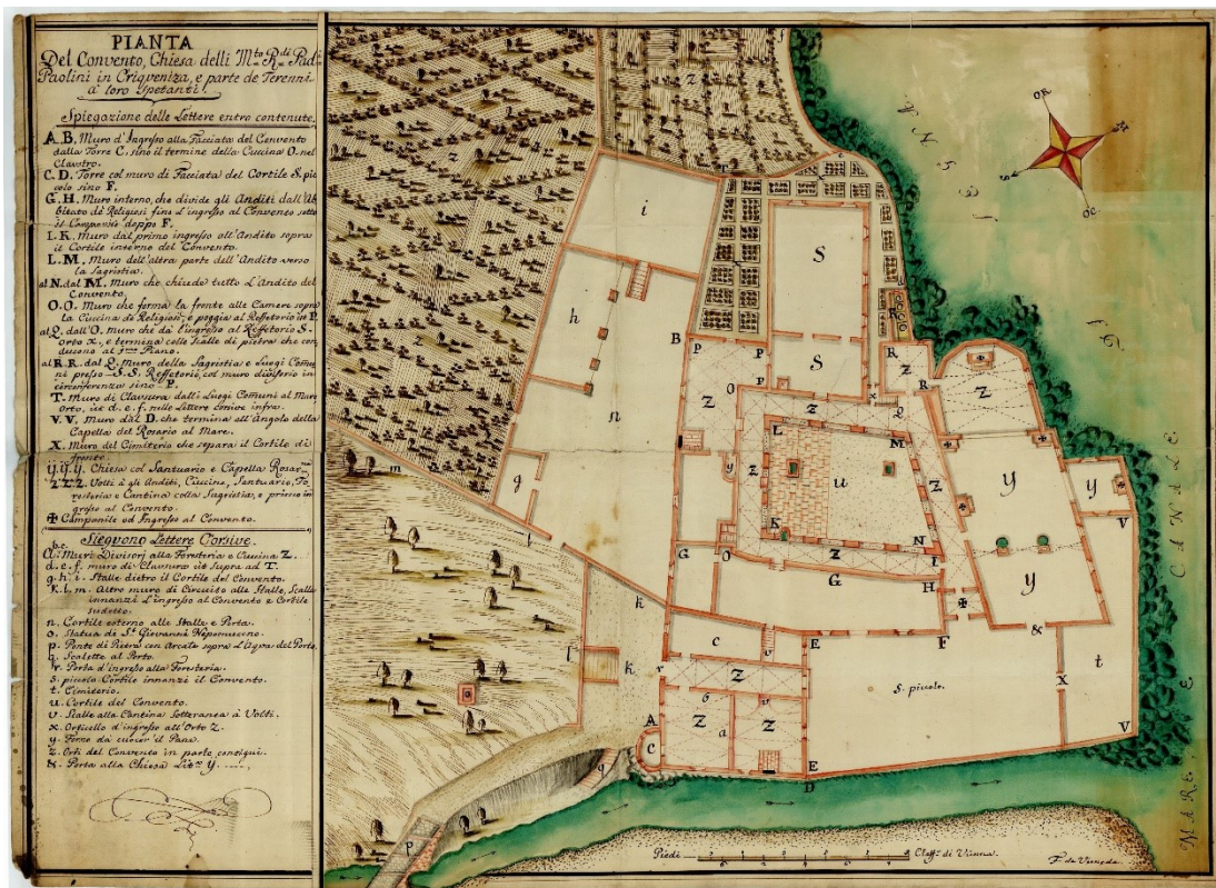
Slika 20. Felice Stefano de Verneda, Tlocrt crikveničkog samostana, 1756. godina

Izvorni kameni kip sv. Ivana Nepomuka isprva je bio postavljen nedaleko od mosta preko Dubračine, 166 a u prvoj polovici XIX. stoljeća skulptura se premjestila na sredinu novo izgrađenog mosta. 167