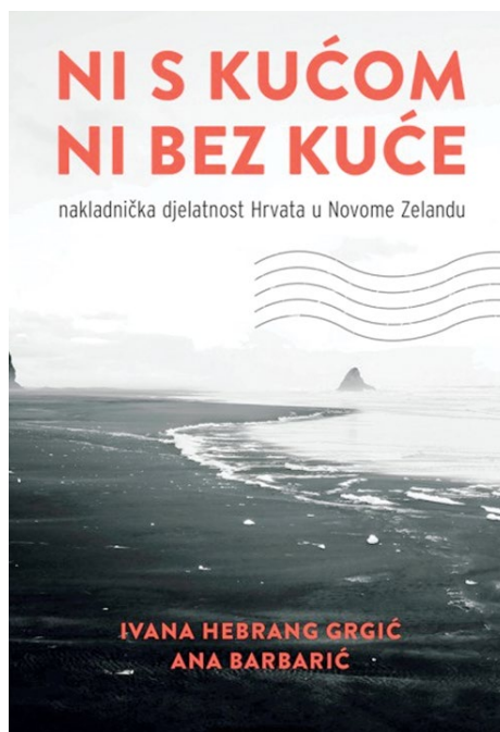
SLIKA 4. Naslovnica knjige Ni s kućom ni bez kuće

oglasa iz novina, fotografija i sl. Navedene izvore autorice su proučavale u okviru projekta te su u knjizi donijele isječke iz starih, zaboravljenih novinskih izdanja koji zrcale sliku društvenih prilika pojedinca i zajednice u Novome Zelandu, a te su izvore prenijele u knjigu u obliku tekstnih parafraza i citata, vizualnih isječaka iz starih novina i preslika starih fotografija, što sve na svoj način predstavlja nostalgični čimbenik u knjizi. Također, dizajn naslovnice, koji je izradila Ana Pojatina, uz suvremenu fotografiju novozelandskoga pejzaža uključuje i element poštanskoga žiga s pisma ili razglednice, što danas, gotovo kao izgubljeni komunikacijski medij, evocira na neka prošla vremena... (Slika 4). Ova knjiga na temelju izvora u kojima se donose svjedočanstva o svakodnevici određenoga vremena, malo povijesti i obiteljskoj povijesti, odgovara opisu kulturnoga izričaja koji je povezan sa zavičajnim studijama ili zavičajnom kulturom.