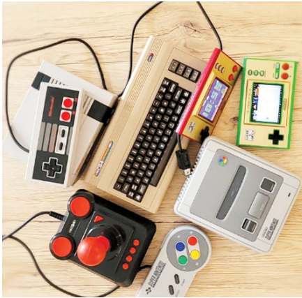
SLIKA 2. Retroizdanja igračih konzola