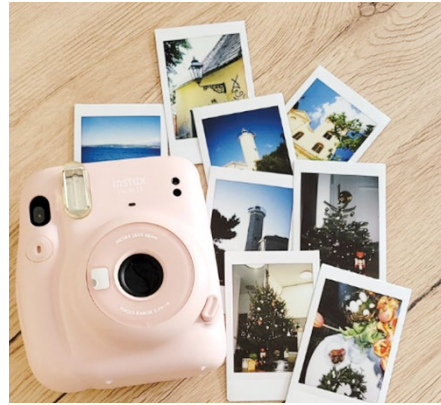
SLIKA 3. Retroizdanje uređaja za instant-fotografiju

U konačnici, analiza primjera u ovome radu završit će sektorom nakladništva, pisanja i stvaranja knjiga pri čemu će se analizirati nostalgичni elementi u knjigama izabranima iz bogatoga uredničkog opusa Nives Tomašević. Uzete su dvije knjige objavljene u 2021. godini, obje su nastajale prije i za vrijeme pandemije, jedna pripada znanstvenomu, a druga književnomu diskursu, ali u objema se može prepoznati nostalgичna obilježenost. Iako pripadaju različitim stilovima i diskursima, knjige se dotiču u ideji putovanja te obje, svaka na svoj način, nalaze mjesto u suvremenoj popularnoj i zavičajnoj kulturi.