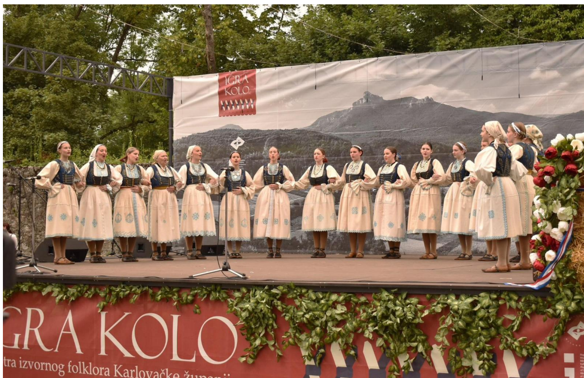
Slika 21: Pozadina planine Klek tijekom 26. Smotre izvornog folklora Karlovačke županije “Igra kolo”. 2022. godina.