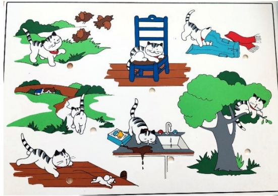
Prilog 3. Materijal za prikupljanje podataka predškolskih skupina ispitanika – slikovna priča na ploči Maca u prirodi .