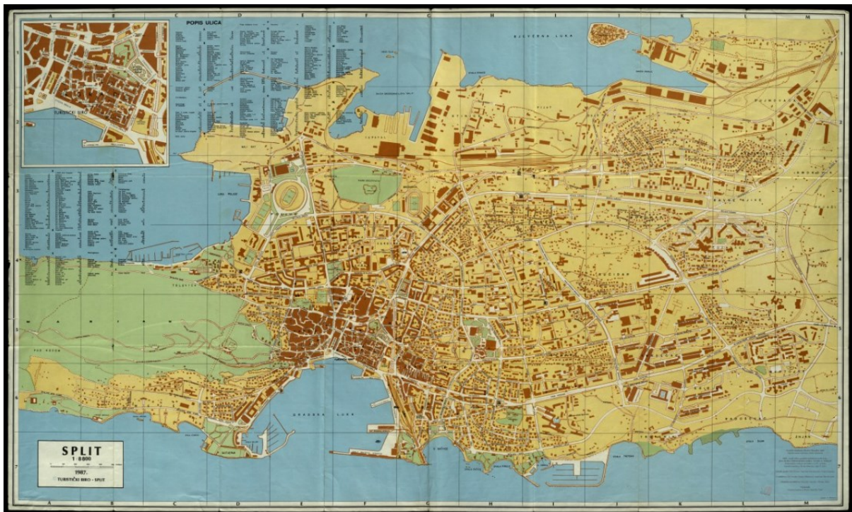
Slika 5. Karta Splita 1987.

Izgradnja je, po već ustaljenoj praksi, kasnila zbog nedostatka sredstava za pripremu građevinskog zemljišta i neredovitih uplata u fond SIZ stanovanja. 366 Prvi se počeo graditi blok 4A sa 194 stana 1989. u izvedbi „Konstruktora“, a zatim su uslijedili blokovi 1A sa 122 stana i 1B sa 119 stanova. 367 Projekt je bio obilježen brojnim kontroverzama; izvođači su često prekidali radove zbog nenaplaćenih dugova, a iz istog razloga završene zgrade dugo vremena nisu bile spojene na vodu, struju i kanalizaciju. 368 Stanovi su u ljeto 1991. useljeni bez atesta i uporabne dozvole zbog čega je naknadno bilo pravnih zavrzlama. 369 Blok 1B završen 1992. bio je zadnja izvedena faza ovog projekta. S promjenom sistema, gube se široke ovlasti izvlaštenja vlasnika zemljišta, zbog čega se odustaje od daljnje provedbe projekta. Tako je još jedan ambiciozan plan već na samom početku doživio neslavan kraj.