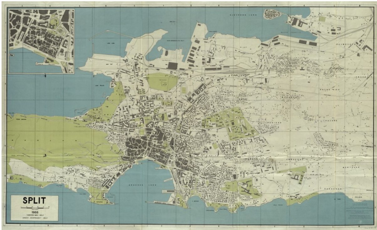
Slika 3. Karta Splita 1968.