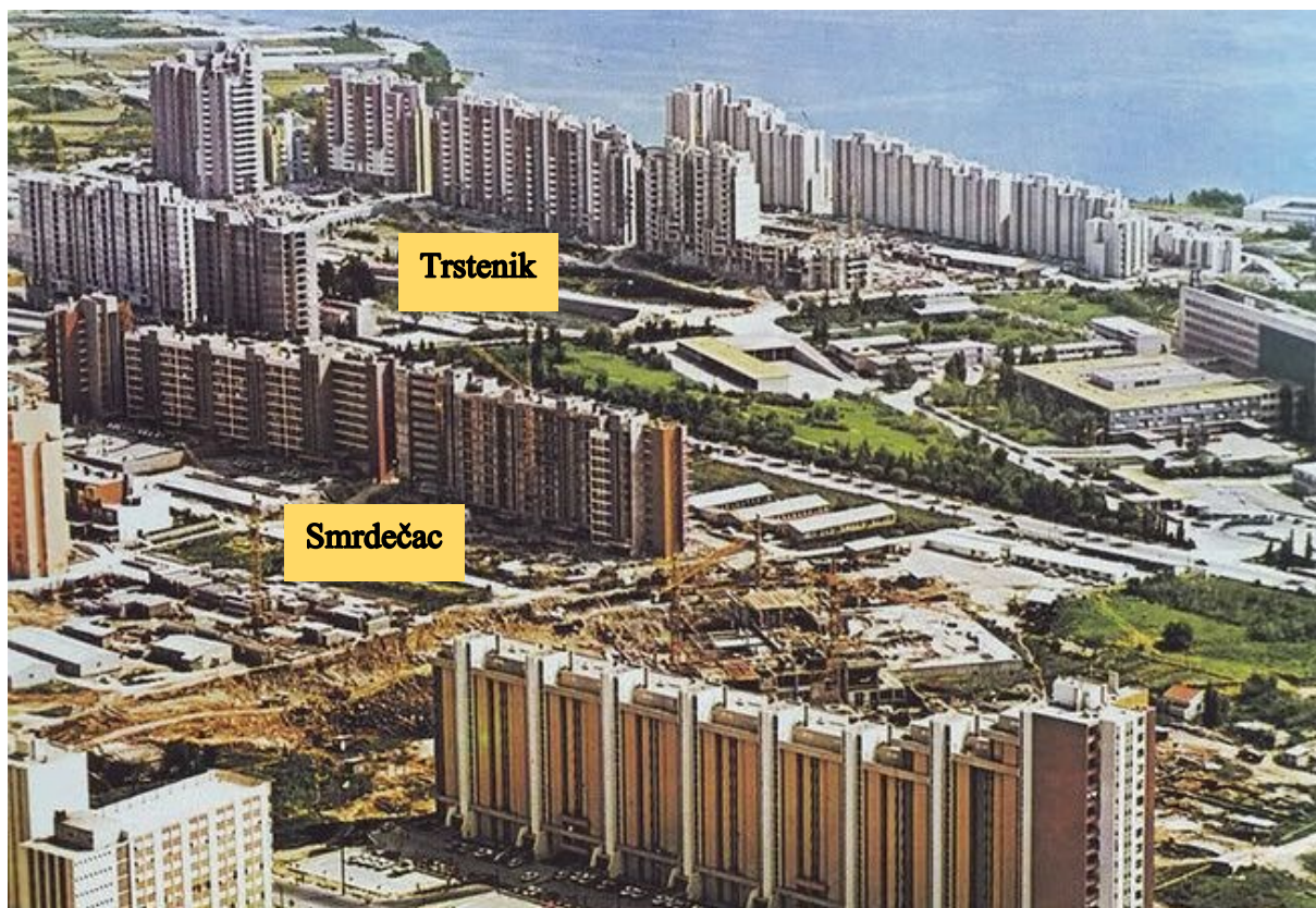
Slika 4. Split 3 u vrijeme izgradnje Ulice Ruđera Boškovića krajem sedamdesetih godina prošloga stoljeća.

građevinska operativa nije imala dovoljno resursa da istovremeno odrađuje dva projekta tolikih razmjera. Krajem sedamdesetih još je postojala nada da će se izgradnja u skorije vrijeme nastaviti. Općina naručuje izradu plana obalnog pojasa Žnjan – Duilovo – Orišac koji je završen 1978., ali nije usvojen zbog izostanka maritimnog rješenja. 281 Iste godine upućen je zahtjev za izradu plana područja Žnjan – Dragovode na kojem je trebao biti izgrađen sekundarni gradski centar, ali iako je plan usvojen 1980., do izgradnje nikada nije došlo. 282 Slovenski urbanisti povlače se iz „Projektne grupe Split 3“ 1982., a sama grupa prestaje s radom 1984. 283 Čavao u lijes „Splita 3“ bilo je raspisivanje novog urbanističkog natječaja za zonu Žnjan – Dragovode 1984. u kojem se odustaje od urbanističkog koncepta slovenske grupe autora, a ujedno i od izgradnje planiranog sekundarnog gradskog centra.