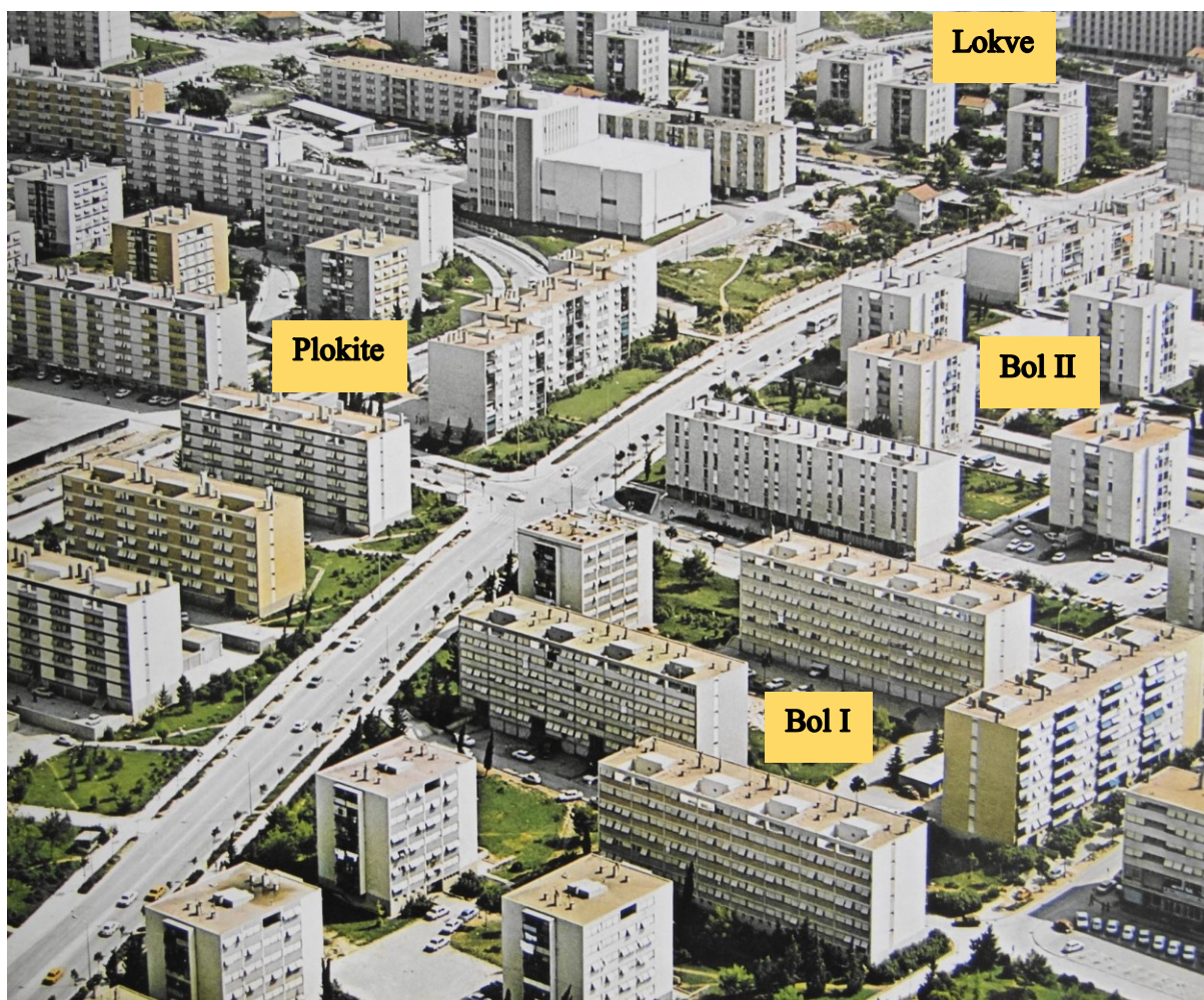
Slika 2. Primjer tipizirane stanogradnje iz šezdesetih godina prošloga stoljeća.

Naselje Gripe – Lokve počinje se graditi 1965. prema urbanističkom projektu Milorada Druževića iz „Urbanističkog biroa“. 225 Umnogome je riječ o nastavku prakse iz naselja Bol – Plokite: prostor omeđen četvertračnim cestama (Dubrovačka ulica, Vukovarska ulica, Ulica Bruna Bušića i Ulica matice hrvatske) povjerava se u najvećoj mjeri „Tehnogradnji“ koja gradi prema vlastitim projektima arhitekata Frane Buškariola i Dinka Kovačića. 226 Izgrađeno je 1660 stanova za preko šest tisuća stanovnika s novom osnovnom školom. 227 Ovo naselje je specifično zbog izgradnje nekolicine zgrada korištenjem prefabriciranih montažnih građevinskih elemenata koji su trebali biti budućnost masovne stambene izgradnje. Iako je „Tehnogradnja“ na ovaj način donekle ubrzala izgradnju, proizvodnja montažnih elemenata