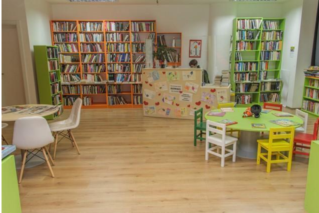
Slika 7. : Dio prostora ogranka Lapad. 75

2009. godine fond ogranka bio pohranjen u pomoćnoj prostoriji Ogranka Mokošica. 73 Današnji Ogranak se nalazi na 200 četvornih metara i broji 8594 svezaka. 74 Na slici br. 7. je prikazan prostor ogranka Lapad u Atlant centru.