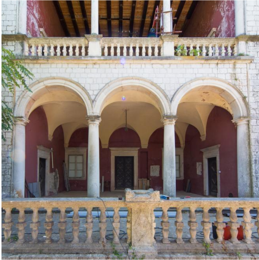
Slika 9.: Vanjski izgled ljetnikovca Skočibuha na Boninovu gdje se nalazi dio zbirke Znanstvene knjižnice. Dio prostora dijeli se s Hrvatskim restauratorskim zavodom u Dubrovniku. 83