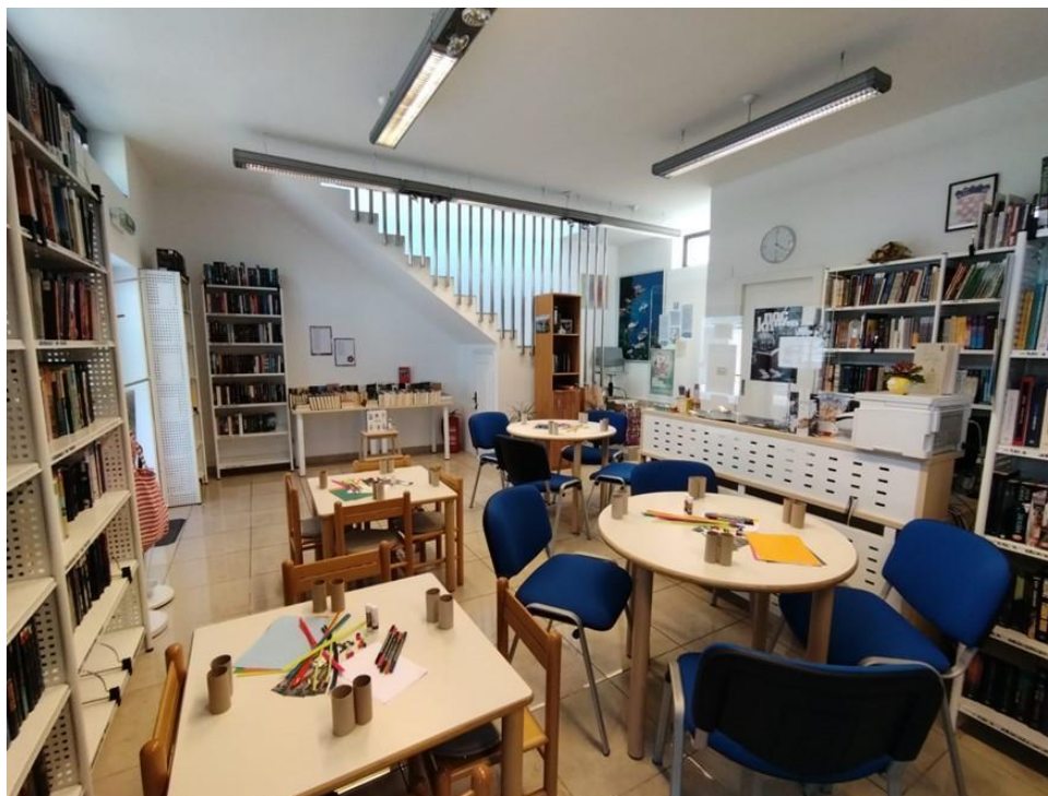
Slika 5.: Prikaz novouređenog prostora Ogranka Cavtat. 67

godine seli u novouređeni prostor. 66 Prikaz novouređenog prostora vidljiv je na slici br. 5.