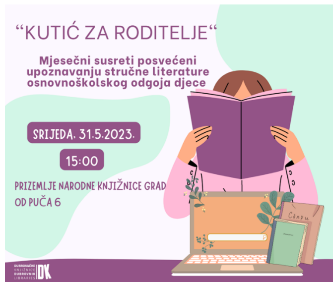
Slika 11.: Prikaz plakata za poziv na mjesečni susreta naziva “Kutić za roditelje”.

iskustava, upoznavanje i rješavanje izazova s kojima se kao roditelji susreću. Slika br. 11 prikazuje izgled plakata za mjesečni susret “Kutić za roditelje.”