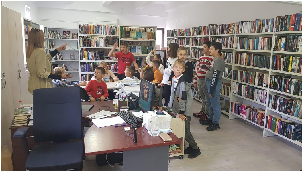
Slika 6: Novootvoreni prostor iz 2018. godine ogranka Trpanj. 69

Ogranak Mokošica otvoren je 28. travnja 2009. godine i ukupan prostor obuhvaća 137 četvorni metar. Upravo je ogranak u Mokošici bio prvo središte koje je nudilo kulturni sadržaj za taj dio grada. Iako je u nekoliko navrata došlo do prodiranja vode u knjižnici, prostor ogranka uz redovnu knjižnu građu ima kutak za djecu i roditelje, prostor za neknjižnu građu, igračke, građu na drugim medijima i sl. Fond Ogranka broji preko 15400 svezaka građe. 7071