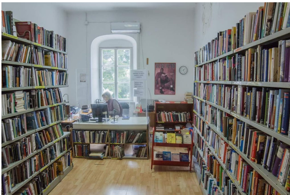
Slika 4.: Ogranak Gruž i nedostatan smještajni kapacitet. 65

Prvi i najstariji ogranak je Ogranak Gruž. Ogranak Gruž otvoren je 1. siječnja 1953. godine. Poznat je po tome što ima najveći i najkvalitetniji fond, ali zbog derutnosti i nedostatnosti prostora svake godine gubi broj korisnika, a zbog neadekvatnosti prostora nekoliko se puta i privremeno zatvarao. Prostor obuhvaća ukupno 51 četvorni metar. Na slici broj 4 prikazan je prostor ogranka Gruž koji ima bogat fond, ali mali smještajni kapacitet. Od bilježenja stanja fonda od 1956. do posljednjeg Izvješća broji ukupno 26340 jedinica građe i preko 6000 svezaka. 64