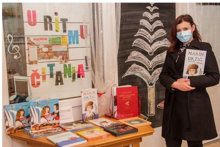
Slika 12.: Predstavljanje slikovnica za djecu, mlade i odrasle u izdanju Matice hrvatske ogranak Dubrovnik u sklopu obilježavanja “Noći knjige” 2021.