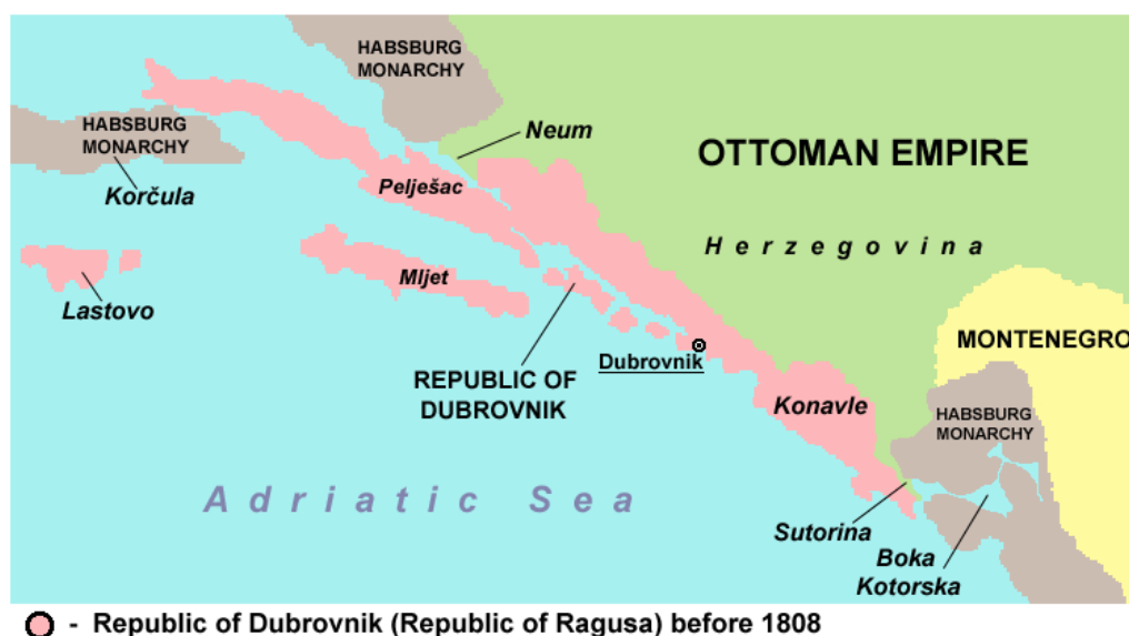
Slika 10.: Prikaz geografskog prostora Dubrovačke Republike do njenog pada 1808. godine. 105

Zbirka broji preko 14000 naslova tiskanih od 16. st. do danas. Sadrži više od 380 naslova periodike, a tu su vrijedne zbirke plakata i sitnog tiska. 103 Građa Zavičajne zbirke koristi se u prostorijama čitaonice Znanstvene knjižnice. Kriteriji prema kojima je Zbirka nastala su trojaki. Prvi kriterij je prostorni, a to znači da Zbirka obuhvaća sva djela koja su pisana i nastala u Dubrovniku. Prostor grada Dubrovnika obuhvaća prostore tadašnje Dubrovačke Republike i Korčule kao što je prikazano na slici br. 10. 104