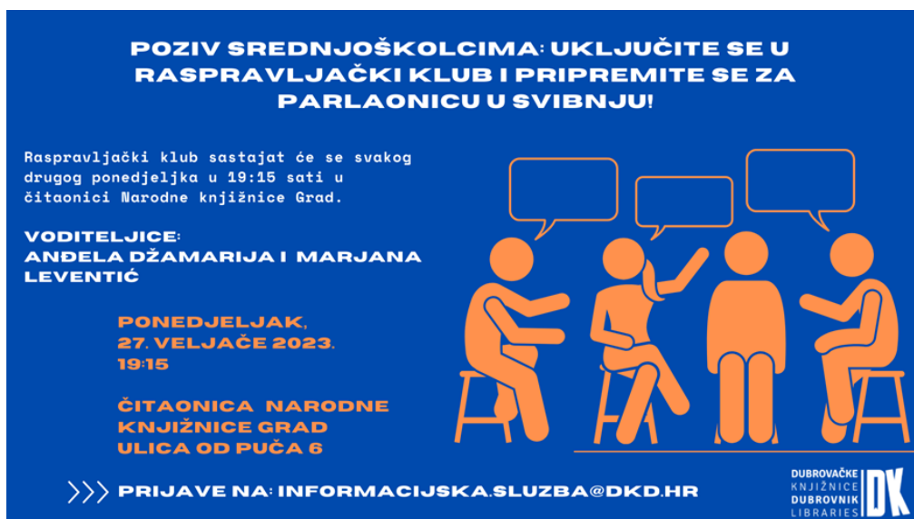
Slika 17.: Prikaz plakata za Parlaonicu i raspravljajući klub.