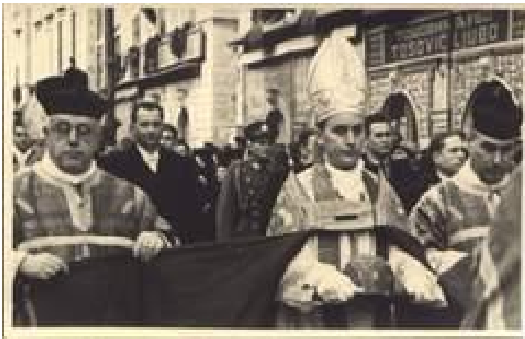
Slika 1.: Kardinal Alojzije Stepinac na otvorenju Dubrovačke biblioteke. 23

U periodu od 15. do 20. st. brojni su intelektualci, vlastelini i bibliofili poklanjali svoje privatne knjižnice gradu Dubrovniku i na taj način otvarali prostor osnivanju Dubrovačke biblioteke. Dubrovačka biblioteka svečano je otvorena na Kandeloru 2. veljače 1941. godine. Otvorio ju je ban dr. Ivan Šubašić, u nazočnosti kardinala bl. Alojzija Stepinca. 22 Na slici br. 1 nalazi se prikaz Kardinala Alojzija Stepinca na dan otvorenja Dubrovačke biblioteke 1941. godine.