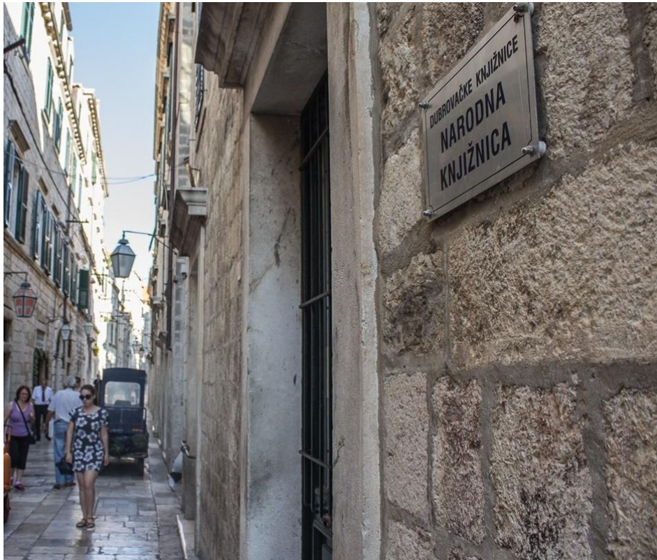
Slika 3.: Ulica Od Puča 6. Adresa Narodne knjižnice Grad od 1995. godine.

Ukupan fond Narodne knjižnice prema izvještaju za 2022. godinu broji sveukupno 183.683 jedinica građe. Matična razvojna služba za narodne i školske knjižnice Dubrovačko-neretvanske županije djeluje u mreži 56 knjižnica (od ukupno 62) na području Županije. Od toga je 15 narodnih i 47 školskih knjižnica.