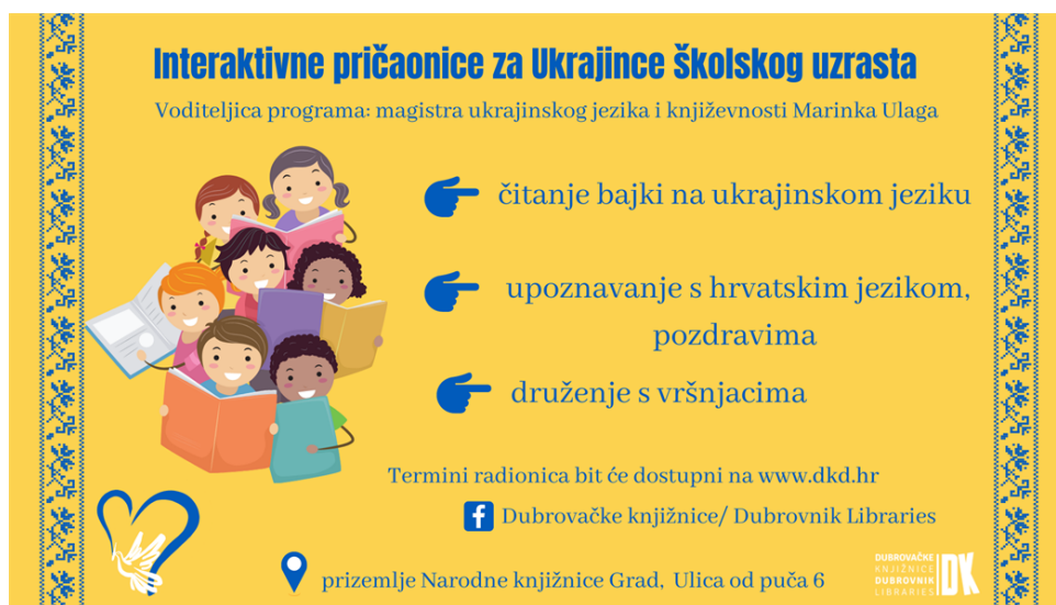
Slika 15: Prikaz plakata za ciklus radionica “Interaktivne pričaonice za Ukrajinke školskog uzrasta.”

Programi za mlade koji se redovito provode u Dubrovačkim knjižnicama su mnogi, a ovdje će se izdvojiti neki od njih koji se provode redovito i na kojima sam i sama sudjelovala tijekom srednjoškolskih dana. Također, na stranici Dubrovačkih knjižnica mogu se pronaći programi razvrstani s obzirom na glavnu vještinu koju potiču, a to su kreativnost i aktivizam (kategorija KreAktiv) i cjeloživotno učenje i obrazovanje (Učim, dakle jesam):