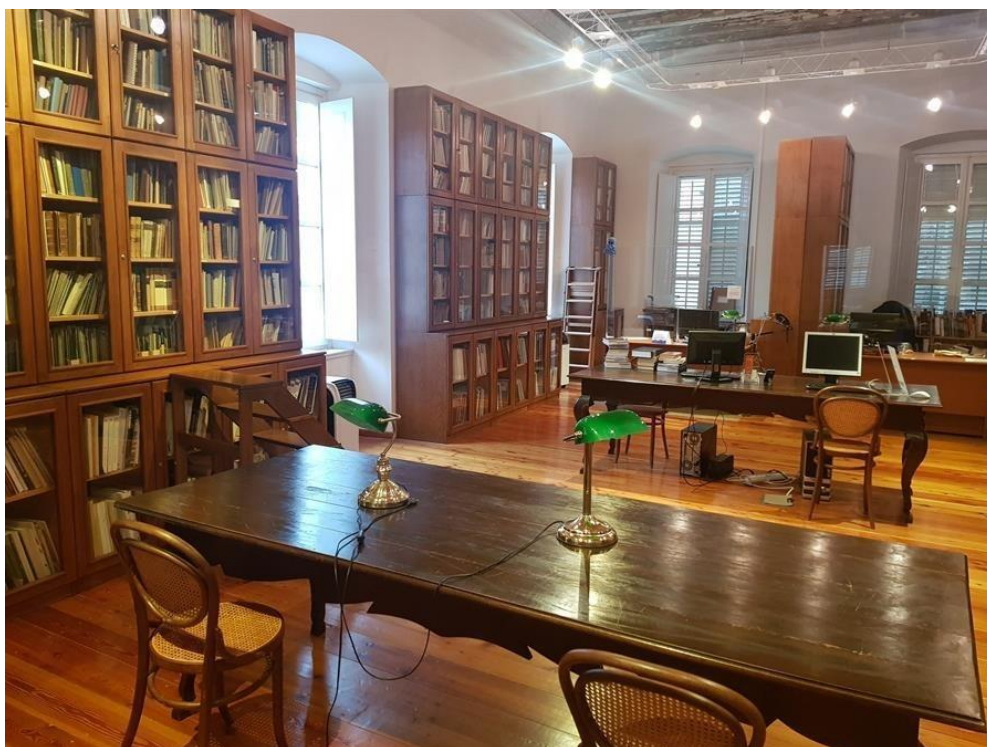
Slika 8.: Studijska čitaonica Znanstvene knjižnice smještena na 2. katu palače Caboga. Nalazi se u staroj gradskoj jezgri. 81

Ljetnikovac Skočibuha datira iz 16. stoljeća i sagrađen je u renesansnom stilu. 1992. godine stradao je granatiranjem, a kao što je navedeno i u ranijim izvještajima, još uvijek nije siguran za korištenje ni restauriran, a brojni djelatnici i restauratori u njemu rade. Na slici br. 6 prikazano je izvanjsko stanje ljetnikovca na kojem je vidljiva derutnost i potreba za obnovom. Ljetnikovcu također nedostaje adekvatan prostor za pohranu i rad, stoga neki djelatnici moraju raditi u improviziranom montažnom objektu. 82 Knjižna građa koja se naruči korisnicima se dostavlja u palaču Caboga za korištenje u studijskoj čitaonici.