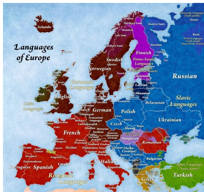
Slika 1: Jezici u Europi