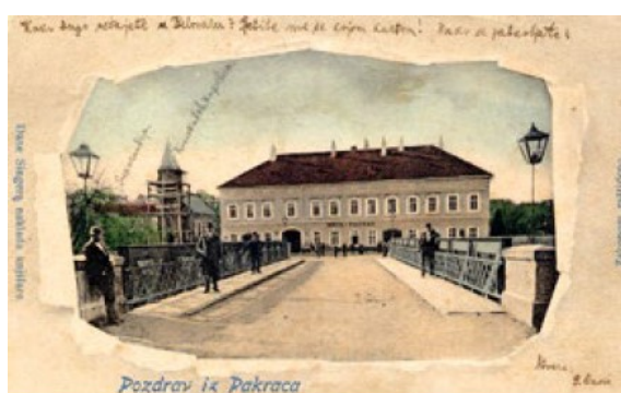
Slika 35. (lijevo) Razglednica iz 1899.