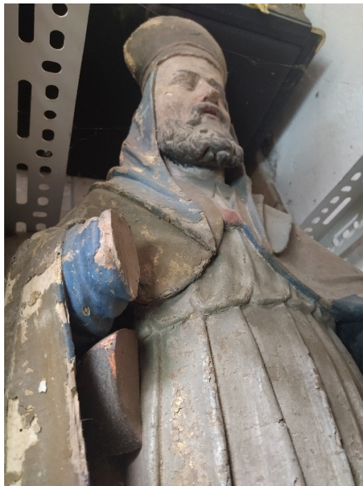
Slika 29. Nepoznati kipar, Neznani svetac , župni dvor, Pakrac

Od ostalih radova originalno namjenjenih i smještenih u župnoj crkvi odnosno sakristiji pronalazimo palu Sv. Antuna Padovanskog s Djetetom (oko 1770. godine) nepoznatog domaćeg