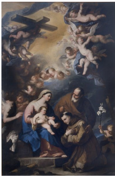
Slike 12 – 16. Djela s prikazima sv. Antuna Padovanskog (od gore, s lijeva na desno):

12. Luca Giordano, Sv. Antun Padovanski , 1634. – 1705., kreda i akvarel na papiru, 31.9 x 21.8 cm, National Gallery of Art, Washington