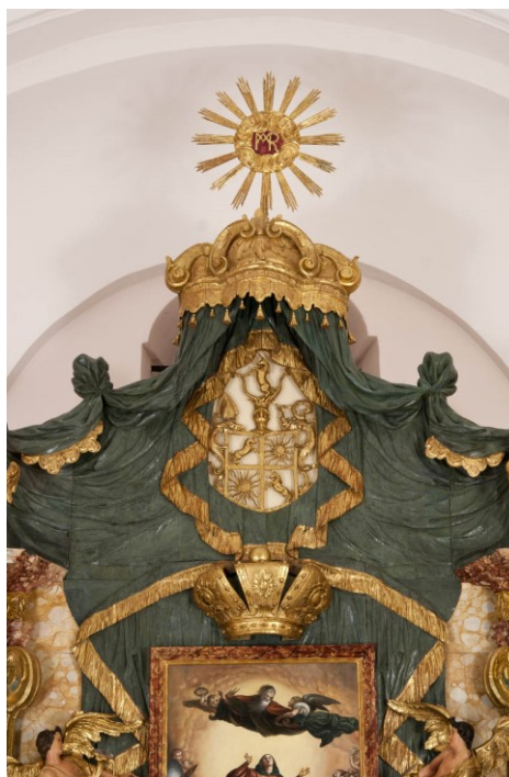
Slika 5. Glavni oltar, detalj – baldahin, polikromirano i pozlačeno drvo, župna crkva Uznesenja Blažene Djevice Marije, Pakrac

S obje se strane pale nalaze figure dvaju anđela. Likovi anđela prikazani su u lebdećoj pozi na samim rubovima draperije. Njihova krila zlatne boje prodiru izvan središnjeg dijela retabla