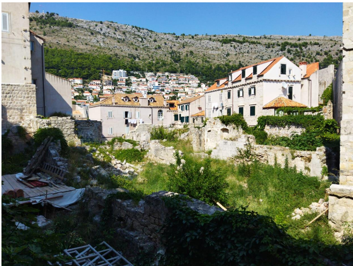
Slika 5: „Ruševine“ na Pustijerni 22. 8. 2023.