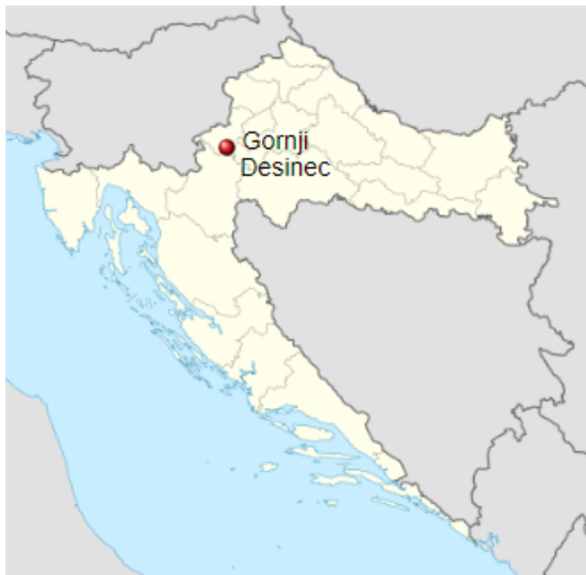
Lokacija Gornjeg Desinca