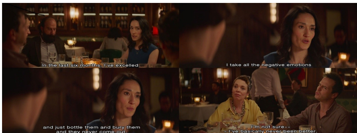
6 Claire na obiteljskoj večeri („Episode 2.1“. Fleabag , 2016-2019)

Opsjednuta zadržavanjem iluzije savršenog života, kompulzivno nastoji prikriti svaku pogrešku, svaki događaj koji bi mogao narušiti stvorenu idilu. Fokusirana na druge, nastoji