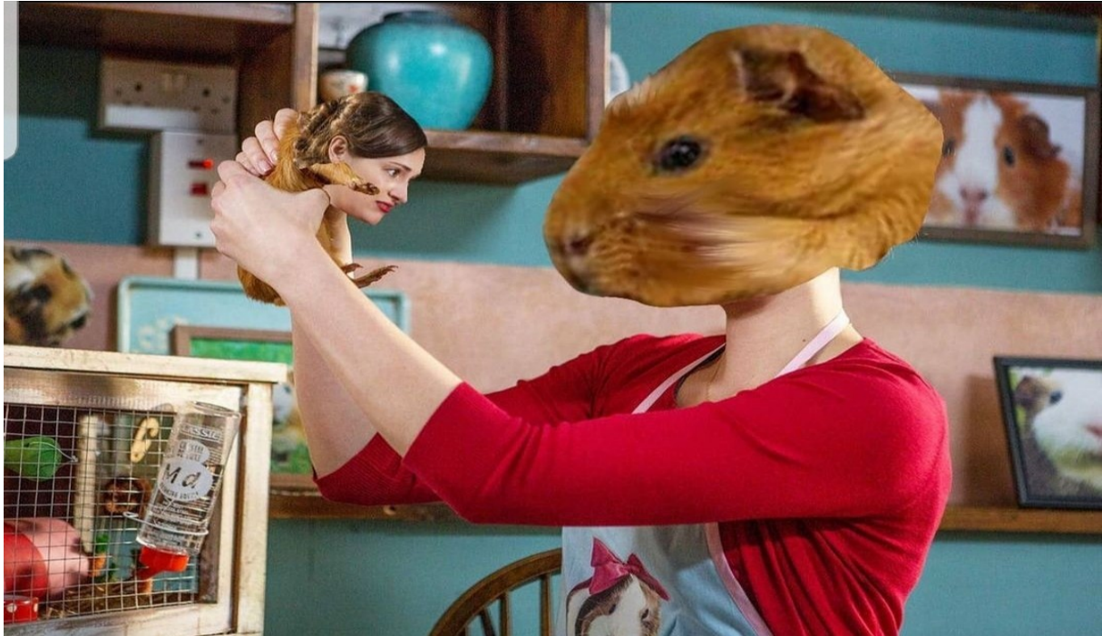
10 Fleabag i Booin zamorac propituju identitete (instagram profil fleabagmemes)