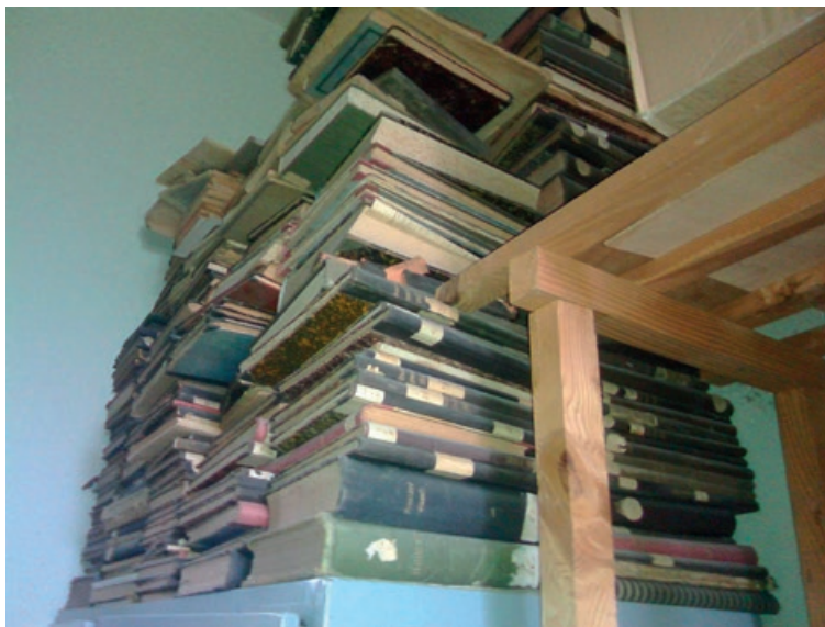
Slika 2. Smještaj pronađene građe

Građa je sačuvana zahvaljujući činjenici da je pohranjena u suhom prostoru te zaštićena od slučajnih mehaničkih oštećenja jer je bila na visini i podalje od sunčevih zraka (Slika 2). Nema laičkom oku vidljivih fizikalno-kemijskih oštećenja, ali postoji sumnja na prisutnost bioloških oštećenja od kukaca.