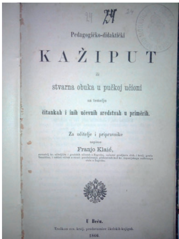
Slika 3. Naslovna stranica najstarije do sada pronađene knjige ( Pedagogičko-didaktički kaži put ili stvarna obuka u pučkoj učionici na temelju čitankah i inih učečnih sredstvih u priměrlih: za učitelje i pripravničke Franje Klaića iz 1866.)