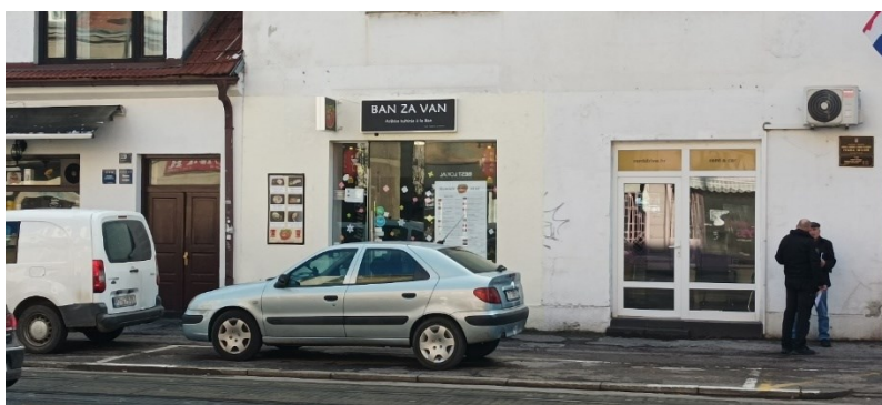
Prilog 22: Ban za van.