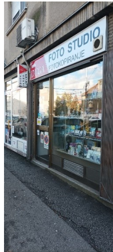
Prilog 20: