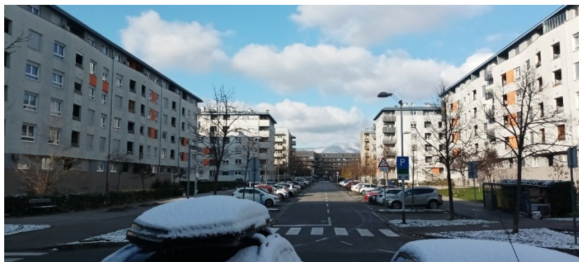
Prilog 13: Ulica Sunčane Škrinjarić.