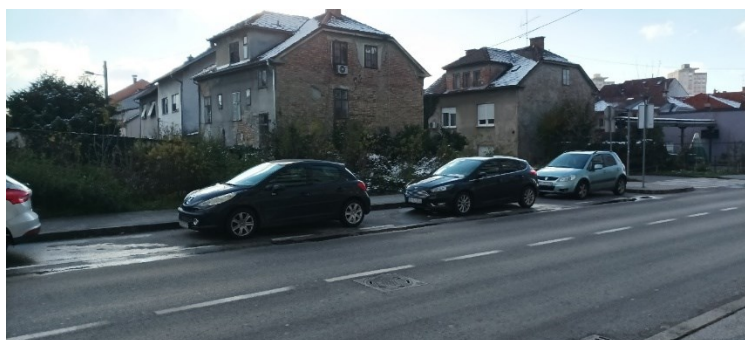
Prilog 25: Zapušteni objekti u Baštijanovoj ulici.