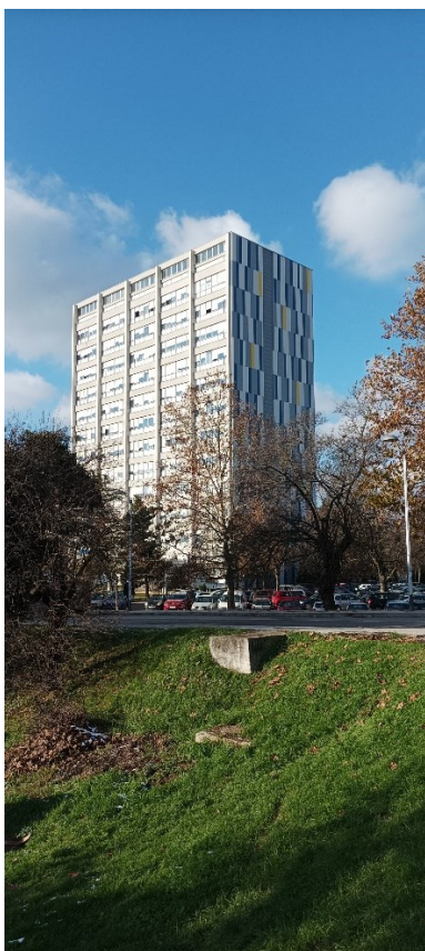
Prilog 17: Suvremeni izgled Končara i Ericssona Nikola Tesla (autorska fotografija).