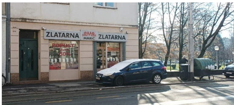
Prilog 9: Ex FOTO Ivica (autorska fotografija).

Osim navedenih primjera, na Tratinskoj i Ozaljskoj ulici ističe se i oblik obiteljskih trgovina i ugostiteljskih objekata kojih je, u odnosu na drugu polovicu prošloga stoljeća, sve manje. Tako primjerice slastičarnice Vjekoslava Babića na Trešnjevci više ne postoje, no ono što nam sačuvana fotografija (prilog 19: Fotografije slastičarnice Vjekoslava Babića) svojim izrazom otkrivaju jest uspješnost obiteljske franšize; članovi obitelji, možda čak i u ulozi radnika, poziraju ispred jedne od