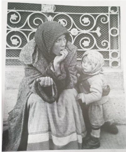
Prilog 23: Prosjakinja s djetetom, 1932-1935.