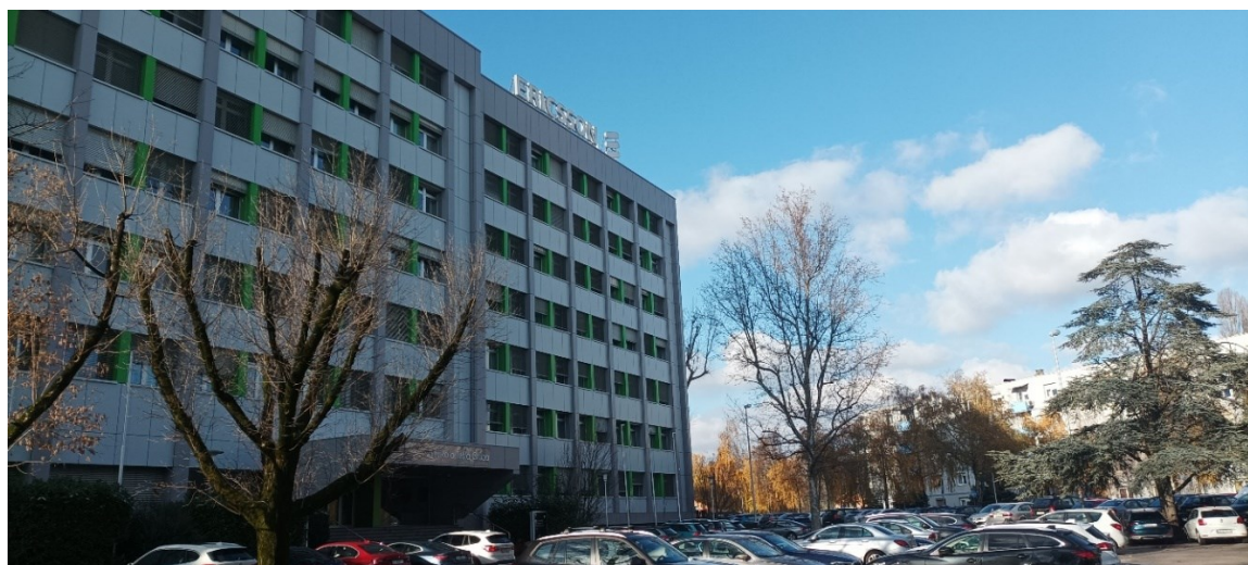
Prilog 18: Suvremeni izgled Končara i Ericssona Nikola Tesla (autorska fotografija).