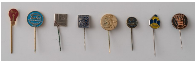
Prilog 28: Značke trešnjevačkih tvornica (1970-e).