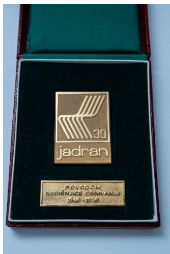
Prilog 29: Medalja povodom 30. obljetnice tvornice Jadran (1970-e).