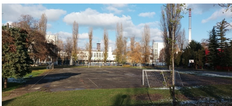
Prilog 27: Osnovna škola Augusta Šenoae.