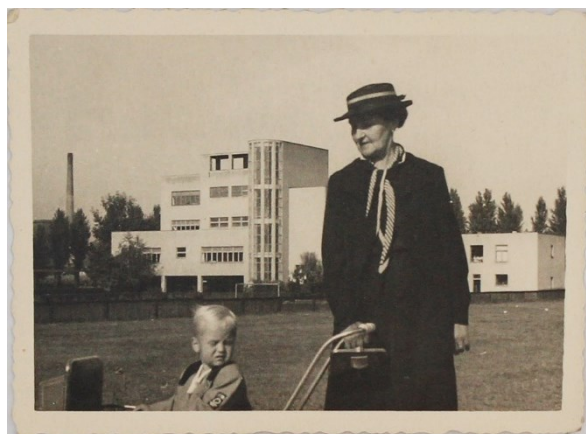
Prilog 26: Fotografije djetinjstva u Baštijanovoj (1940-e).