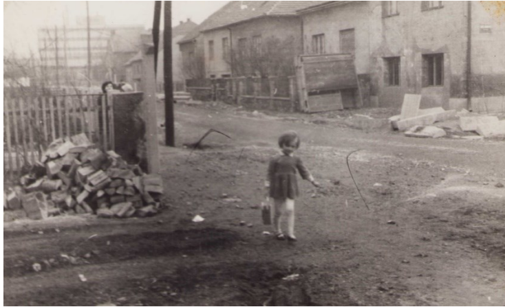
Prilog 10: Fotografija djevojčice s tranzistorom (1964).