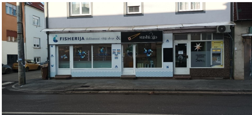
Prilog 24: Nove trgovine u Baštijanovoj ulici (autorska fotografija)