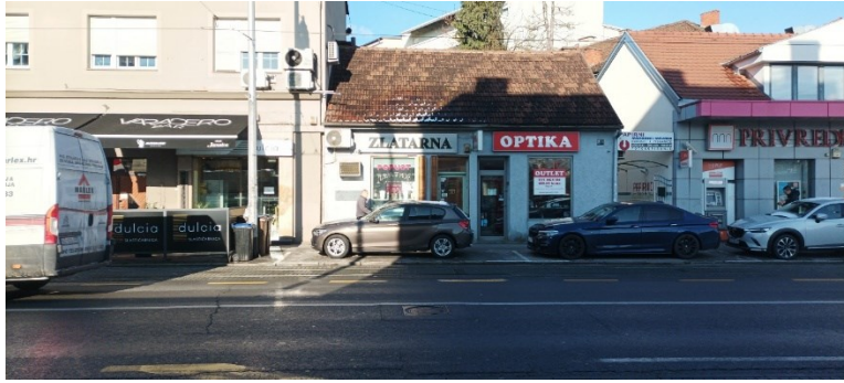
Prilog 19: Zlatarnica i optika.