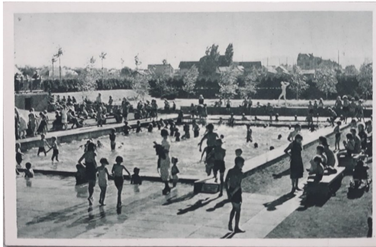
Prilog 6: Razglednica kupališta u Zorkovačkoj (n. d.).

4). S obzirom na to da je u istraživanju ipak naglasak na radu, o prostoru dokolice u ovom kontekstu treba ponovno istaknuti kako je on fizički organiziran zbog uspostavljanja opreke rada i odmora u prošlosti, što je pridonijelo urbanoj „određenosti“ mjesta (prilog 15: Rad/dokolica). Naselje Prve hrvatske štedionice tako je primjer kvalitetnijeg stambenog naselja koje je u svoje vrijeme predstavljalo „planski izgrađen otok“ u moru spontano nastale okolne izgradnje (Jukić, 1998: 25). Na navedenoj lokaciji se kao simboličan moment može istaknuti dimnjak toplane koji je vidljiv na širem području centra Trešnjevke, a podsjeća na karakteristike moderniteta iako je i danas relevantan. Simboličnost nije vezana samo za minula vremena, već i za aktivno stvaranje današnjeg ambijenta kvarta s obzirom na to da se on upravo ponajviše formira putem svojeg izgleda i ključnih arhitektonskih momenata (Thibaud, 2014: 2). Tako je estetika utilitarizma i rada danas naglašena nenamjerno.