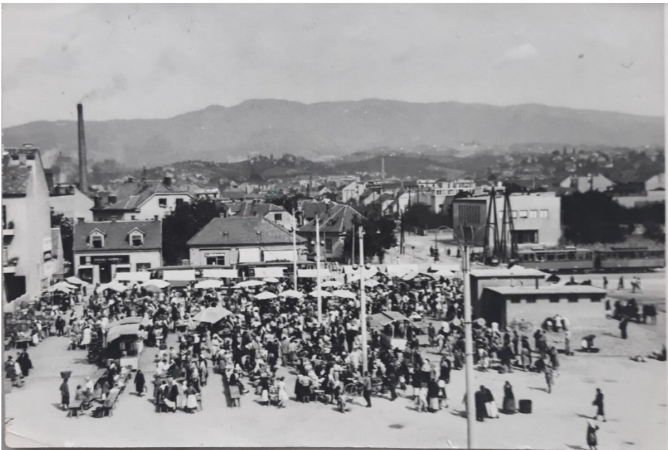
Prilog 2: Fotografija starog Trešnjevačkog placa (1950-e).

ali je izrazito važno istaknuti nedostatak urbane opreme čime je zaista riječ o primarno otvorenom te javnom trgu koji je u isto vrijeme i društveni prostor i fizičko mjesto sa svojom pripadajućom uokvirujućom arhitekturom (Nikolić, Milošević, Mitković i Brzaković, 2016: 339), što se može shvatiti kao pandan obaveznom okviru fotografije koji dodatno fokusira značenja. Značaj gornjeg rakursa postaje jasan kada se naglasi činjenica da autori urbane memorije putem svojih radova prezentiraju ili mjesta odmora, ili specifična središta gradova (pri čemu je Trešnjevački trg u potonjoj kategoriji) prenoseći time urbanu atmosferu (Streljnikova, 2012: 79 i 91). Trgovi su mjesta brojnih križanja, primoravaju prolaznike da se zadrže, a organizacija mjesta upućuje sama na sebe, odnosno na svoju vidljivost (Flanagan, 2010: 11). Jednostavnije rečeno, očekivana je „masivna“ scena velike skupine ljudi koja se nalazi na ovome prilogu i njena organiziranost u obliku polu-totala jer se time pridonosi naglašavanju veličine i značajnosti mjesta.