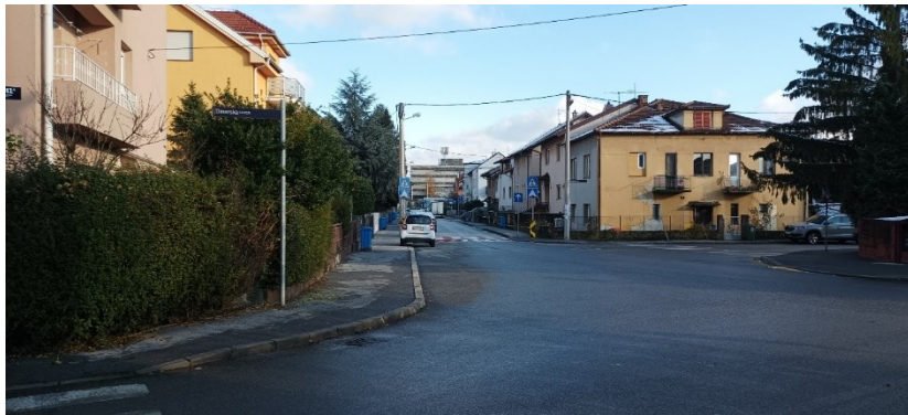
Prilog 11: Dinarska ulica 41a.

Druge fotografije dočaravaju opreku klasa na Baštijanovoj ulici. Tako se na jednom vizualnom izvoru mogu vidjeti članovi jedne obitelji kako sudjeluju bez obuće u sakupljanju metalnog otpada. Iza njih vidi se potez Baštijanove prema zapadu grada kojeg karakteriziraju tipične kuće u nizu usmjerene prednjom stranom prema cesti. S druge strane, danas su se na području ove ulice izgrađene vrlo modernizirane stambene zgrade kao i nova osnovna škola, čime se rekonstruira implicirani habitus tog dijela kvarta kroz suvremenu estetiku, arhitekturu i urbani raspored koji je sada poprečan tradicionalnim kućama. Ovaj proces predstavlja dramatičnu promjenu u odnosu na fotografiju prošlog stanja; dominira pravilan raspored prostora u službi prometa i parkiranja osobnih vozila. Vidljiva opreka između radničke i ostalih klasa je nivelirana, ako se krene od značenja prostora kroz njegov izgled, a samom Baštijanovom trgovine impliciraju, kao i u slučaju Ozaljske i Tratinske, promjenu habitusa stanovnika, kao i u slučaju pojave uređenih ugostiteljskih objekata i globalne kuhinje; tako se ističu „Fisherija – Delikatesni riblji