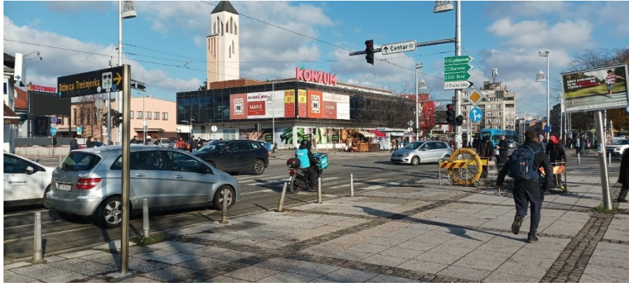
Prilog 3: Trešnjevački trg danas.

Međutim, današnja situacija Trešnjevačkog trga u mnogočemu se razlikuje od svoje prošle vizure. Urbana oprema placu vrlo je zgusnuta, u jutarnjim gužvama čak i neprohodna, a sve je uokvireno dugotrajnim radom tržnice kao čvrstim predstavnikom zeitgeista prošlosti. To ne znači da je odlazak na tržnicu staromodan , već da su je opkolili postmoderni oblici rada, tj. oblik današnje gig ekonomije koja je u potpunosti odvojena od fizičkih karakteristika prostora (na konkretnom primjeru ističu se Bolt, Glovo, Wolt i dr.). Osim toga, navedeno dakako ne proizlazi iz denotacijskog izgleda prostora ( izraza ), već sadržaja kojeg se izvlači iz prezentiranog; suvremena gig , tj. on-demand ekonomija (Kalleberg i Dunn, 2016: 10) gotovo je nevidljiva suprotstavi li se sveprisutnom kompleksu tvornice ili nizu prošlih obrta na Ozaljskoj ili Tratinskoj ulici (riječ je o bivšoj ulici Rade Končara). Drugim riječima, dok se tipičan oblik rada na tržnici i oko nje prije mogao konkretizirati fizičkim parametrima, suvremeni oblici rada kompliciraju geografiju prostora, gdje njegova objektivna lokacija postaje irelevantna za obavljanje određene djelatnosti (Stevens, 2020: 2); ona je slučajna te je određuje svaka konkretna instanca zatražene usluge od strane korisnika. Ipak, svoju fizičku manifestaciju pronašli su kiosci, specijalizirane trgovine (npr. „Delicije“) te ugostiteljski objekti, stoga nije moguće govoriti o napuštanju tradicije.