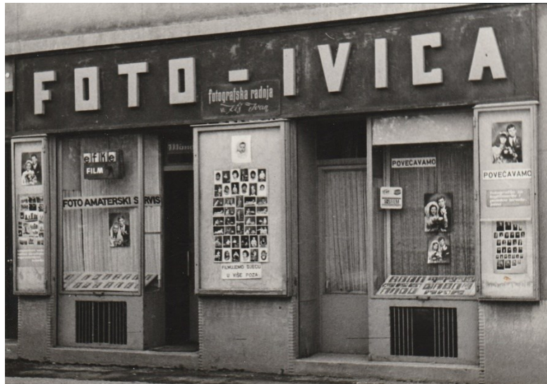
Prilog 8: Fotografije radnje FOTO Ivica (1966).

simboličke ekonomije 5 koja se ispoljava kao agregat produkcije urbanog prostora i proizvodnje simbola od strane građana (odnosno kulturnih reprezentacija) (Zukin, 2013: 349).