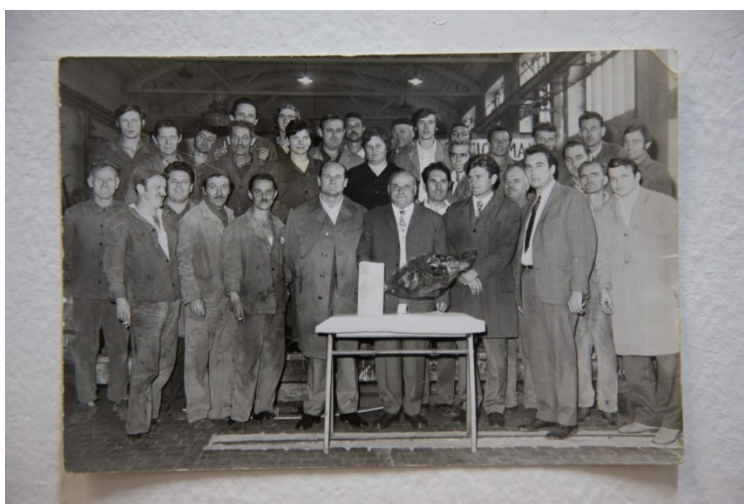
Prilog 16: Fotografija radnika Končara (1960-e).