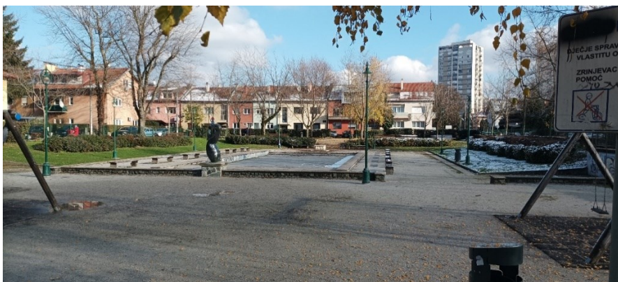
Prilog 7: Kupalište u Zorkovačkoj ulici danas.