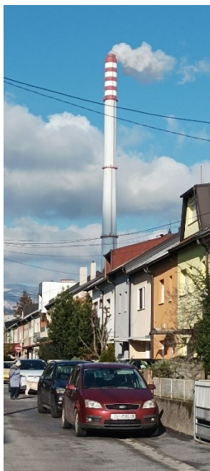
Prilog 15: Rad/Dokolica (autorska fotografija).