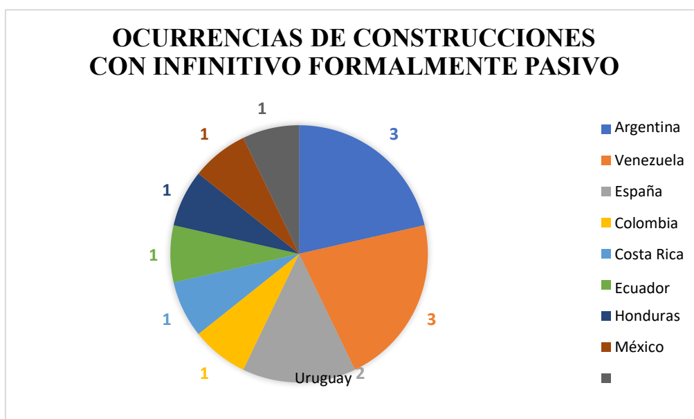
Gráfico 1. Distribución por país de casos de complementos con infinitivo formalmente pasivo.

En cuanto a la distribución geográfica de dichas ocurrencias, los resultados se presentan en el Gráfico 1. Como se puede notar, la mayoría de casos provienen de países latinoamericanos, mientras que de España se han encontrado solo unos pocos ejemplos.