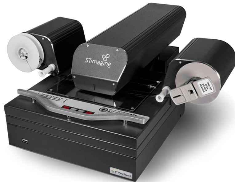
Slika 4. Skener za mikrooblike