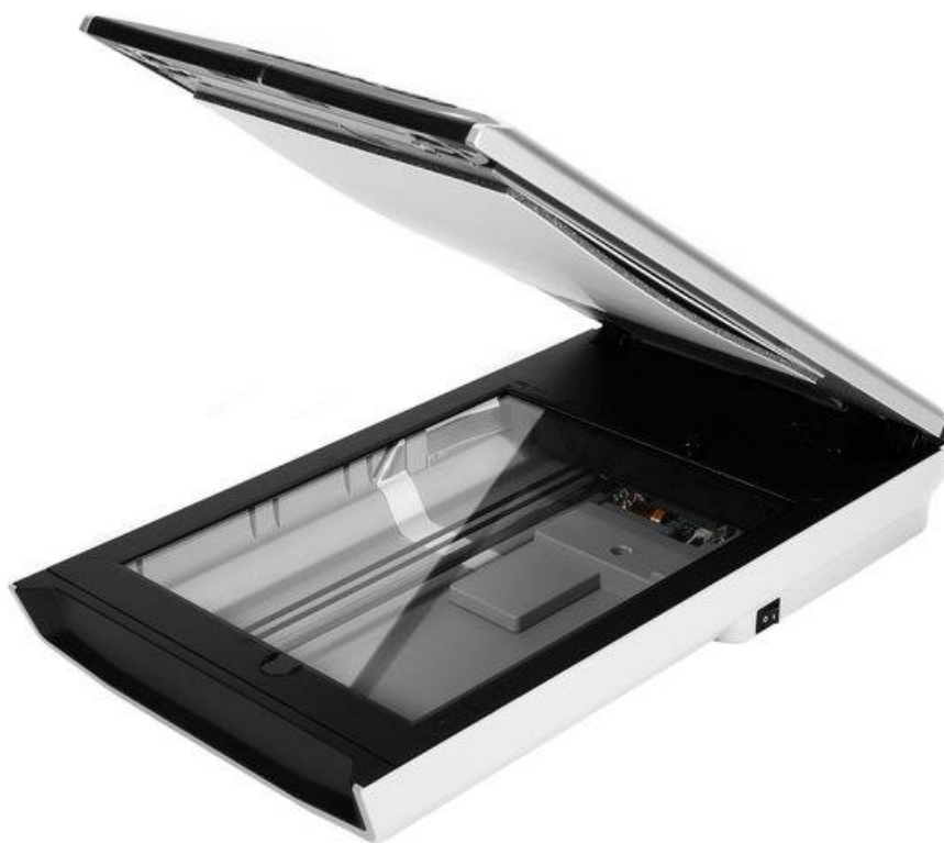
Slika 3. Plošni skener