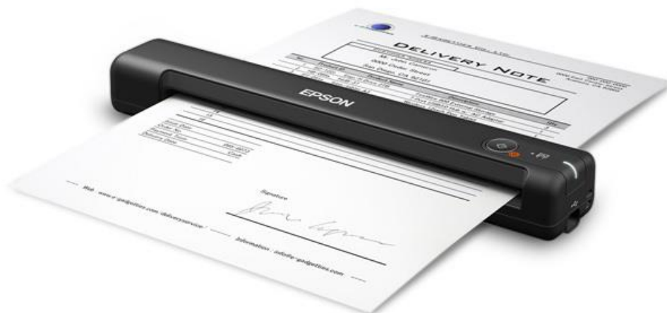
Slika 2. Ručni skener