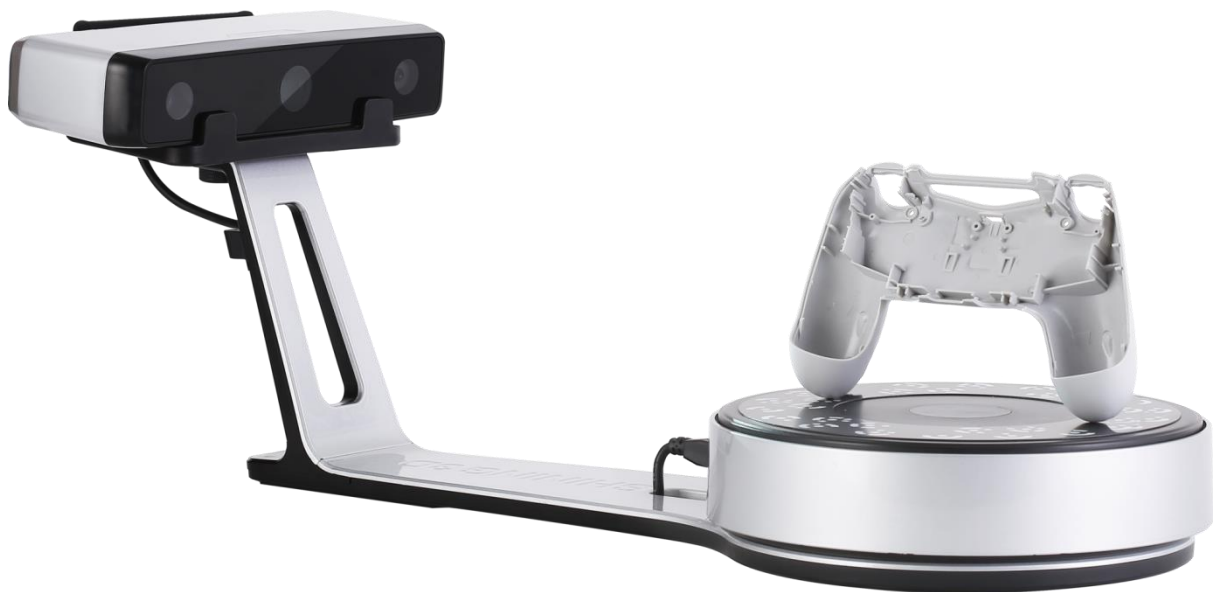
Slika 6. 3D skener

3D skeneri (engl. 3D scanners ) su skeneri koji omogućuju skeniranje trodimenzionalnih predmeta. Oni analiziraju predmete i prikupljaju podatke o njihovoj boji, obliku, izgledu i slično (Stančić, 2009, 39). 3D skeneri se koriste u različitim industrijama i ustanovama, kao što su naprimjer arhitektura, građevinska industrija, medicina, industrija dizajna i prototipiranja, filmska i video industrija i slično. Stančić (2009, 39) navodi podjelu 3D skenera na kontaktne i nekontaktne. Kontaktni 3D skeneri zahtijevaju fizički kontakt s predmetom koji se skenira, dok se nekontaktni dijele na aktivne koji emitiraju zračenje ili svjetlost, i pasivne koji izrađuju niz fotografija predmeta ispred sebe (Stančić, 2009, 39-40). Postoji i podjela na stacionarne i prijenosne 3D skenere (Stančić, 2009, 40).