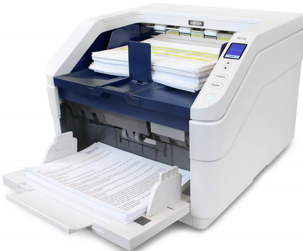
Slika 7. Protočni skener