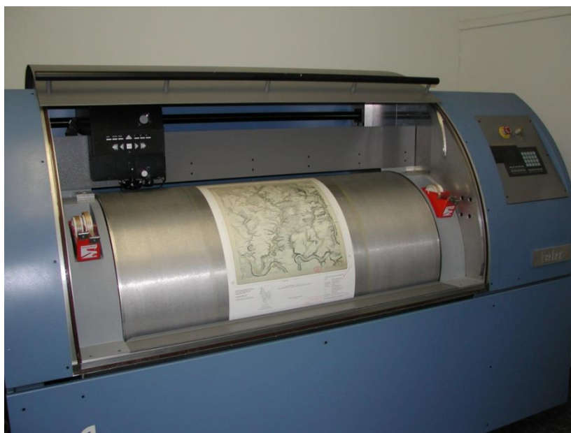
Slika 5. Rotacioni skener