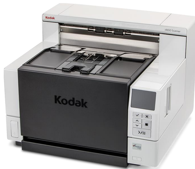
Slika 8. Kodak i4250