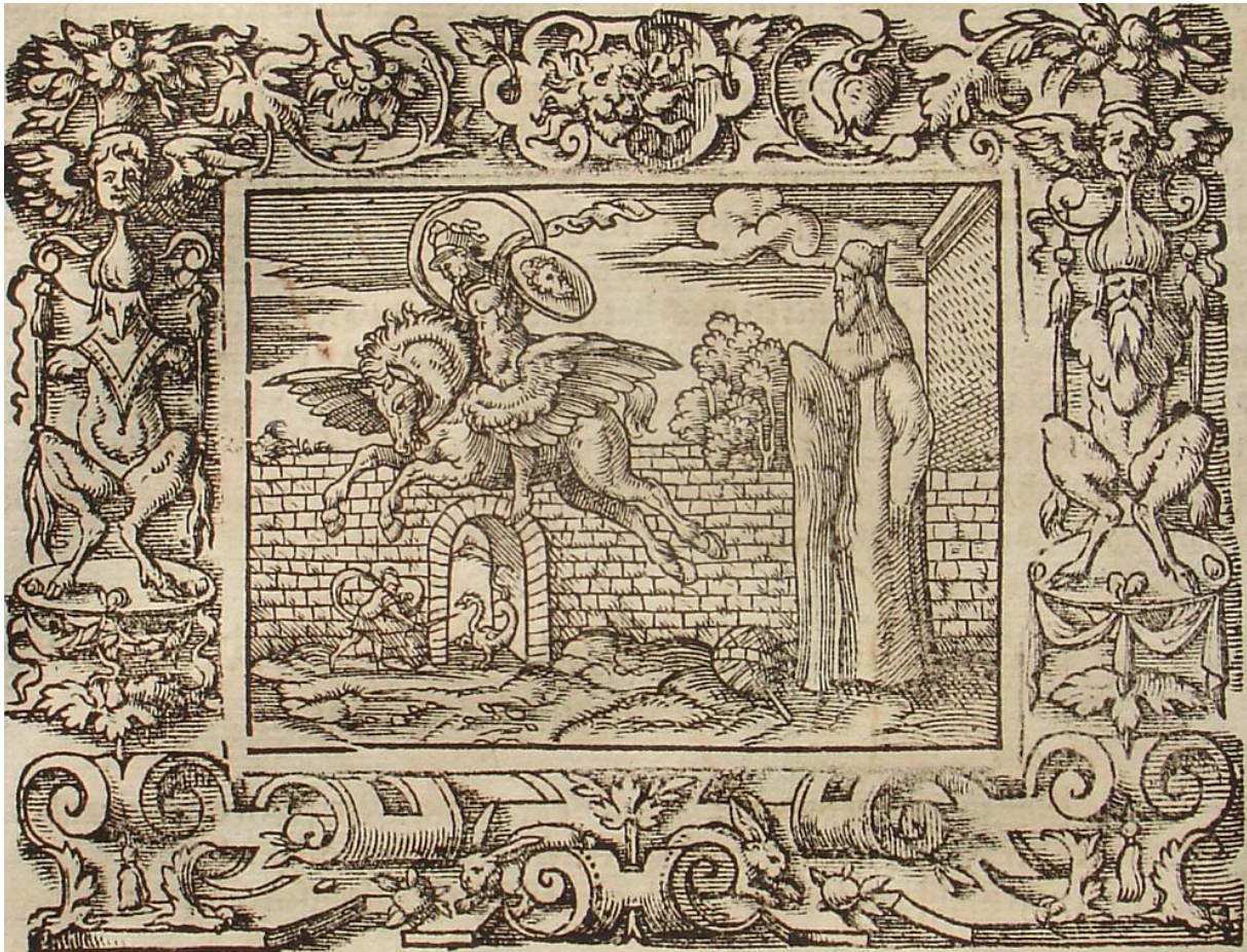
SLIKA 18. Virgil Solis, Atlasova preobrazba u planinu , drvorez, iz: P. OVIDII METAMORPHOSIS, izdavač Sigmund Feyerabendt, Frankfurt, 1581.

Antonio Tempesta, Atlasova preobrazba u planinu , 1606., bakropis, dimenzije 107 x 121 mm (SL. 19). Bez signature. Grafika horizontalnog usmjerenja obrubljena je jednostavnim linijskim okvirom te ispod slikovnog prikaza teče numerirani tekst u kurzivu: 43. Atlas ob inhospitalitatem in montem sui nominis koji opisuje da Atlas postaje planina svog imena zbog vlastite negostoljubivosti. Akteri se nalaze u zraku te su velike visine mjesta radnje definirane nagovještajem planina u pozadini te nisko spuštenim horizontom iznad kojeg se raspršuju oblaci. Perzej se ponovno nalazi na krilatom konju te drži štit s likom Meduzine glave usmjeren prema Atlasu na desno. Atlasovo tijelo je već duboko u preobrazbi, donji dio tijela je već okamenjen dok je gornji još uvijek dinamičan u izrazu mukotrpnog bježanja od vlastite sudbine. Atlasovo lice je ispunjeno nevjericom, dok je Perzejevo prazno, stoično. Tempestin prostor je širok i atmosferski; pozadinske planine i oblaci izvedeni su pojedinačnim crtanjem bakropisnom iglom, što odaje dojam dalekih udaljenosti. Perzej i krilati konj, su kao i kod Solisa najfinije izvedeni. Šrafiranje okomitim linijama i raznim zakrivljenim smjerovima stvara ne samo obrise