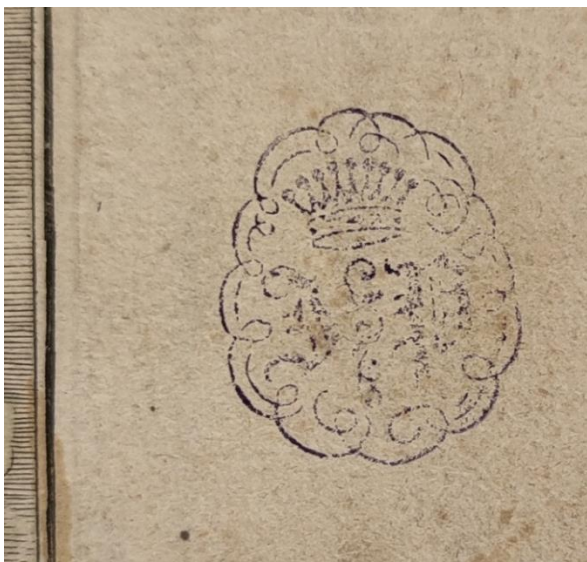
SLIKA 13. Abraham Aubry, Aetas Argentea , verzija iz Grafičke zbirke Nacionalne i sveučilišne knjižnice u Zagrebu, detalj.

S obzirom da zagrebački album počinje scenom koja je numerirana brojem 4, a završava scenom broj 148, jasno je da predmet nije 'cjelovit'. Aubryjevo izdanje Metamorfoza iz Sveučilišne knjižnice Erlangen-Nürnberg nakon dvije naslovnice počinje prikazom naziva RERVUM DISTINCTIO u kojem Ovidije opisuje nastanak svijeta. Slijedi ploča pod brojem dva naziva ANIMANTIBUS HABITENDI LOCUS ASSIGNATUR , iza koje slijedi treća AETAS AUREA , nakon koje dolazi četvrta ploča AETAS ARGENTEA koja se podudara sa zagrebačkim prvim listom u albumu.