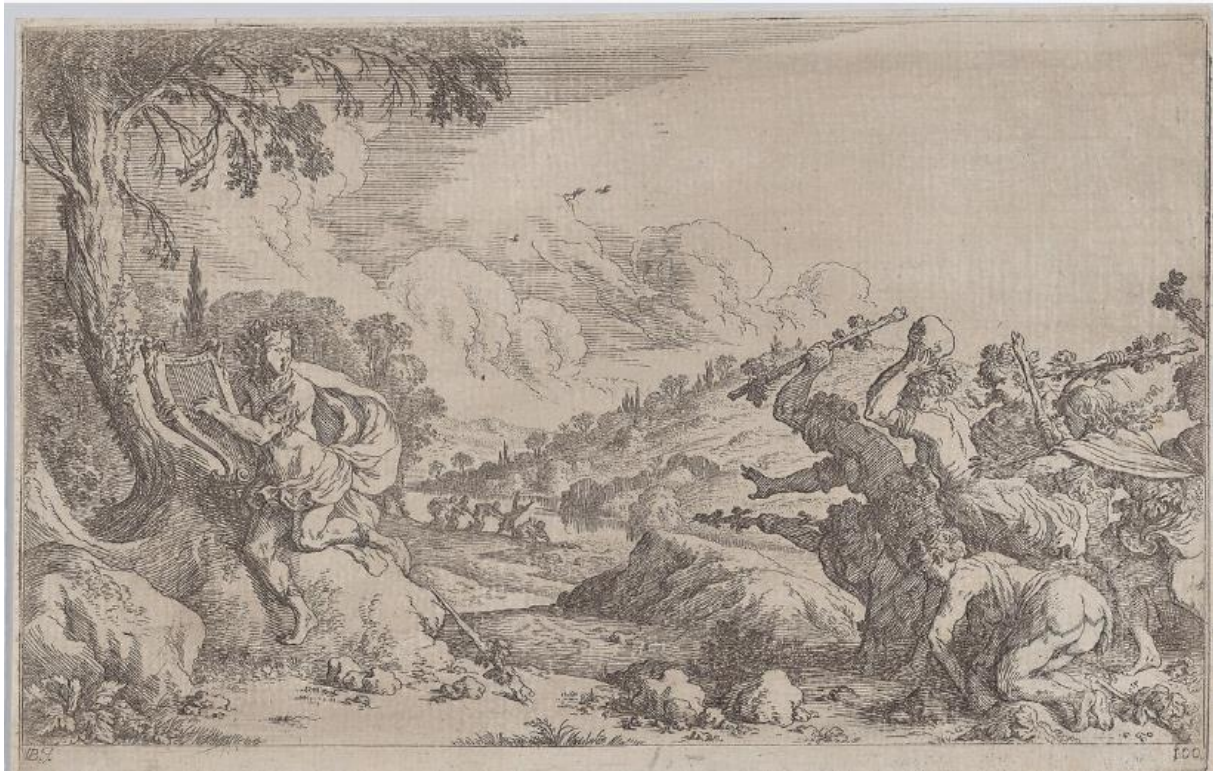
SLIKA 7. Johann Wilhelm Baur, Orfejeva smrt , 1641., bakropis, The Metropolitan Museum of Art.