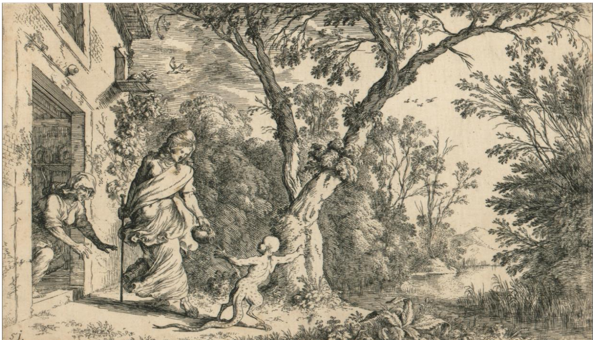
SLIKA 26. Johann Wilhelm Baur, Cerera i uvredljivi dječak , bakropis, 1641.?, Grafička zbirka Nacionalne i sveučilišne knjižnice u Zagrebu

je izgrađena od cigle. Prostor u koji je scena smještena nema seoski dojam, već onaj šumski, gdje je staričina kuća smještena uz more. Akteri su grupirani na lijevu stranu kompozicije, dok je Baur na desnoj strani razvio čitav krajolik pun različitih stabala, grmlja i raslinja, kao i veliko stablo koje se račva u formi obrnute piramide koje odvaja te dvije strane kompozicije. Baur, za razliku od Solisa i Tempeste, prikazuje Cereru s vrčem koji joj je starica dala da se napije tijekom dugog puta. Prikazan je trenutak u kojem je dječak već uvrijedio božicu te ona proljeva napitak na donji dio njegova tijela koji se transformira u guštera. Cererino tijelo je zakrenuto kao da je sekundu prije dječak izjavio uvredljiv komentar, na koji se ona odmah okrenula s vrčem. Starica je prikazana u šokiranoj reakciji hitanja za unesrećenim dječakom, no čin je već gotov. Na takav je način Baur ostvario napetu dinamiku u kojoj je prikazan sekundarni trenutak ove pretvorbe. Razina minuciozne izvedbe krajolika je iznimno visoka; bezbroj zareza iglom kreiraju najmanje žilice lišća i raslinja. Na ovom prikazu dobro je vidljiv utjecaj Nicolasa Poussina i Claude Lorraina na Baurovu izvedbu; tom pomno izrađenom krajoliku pridana je gotovo veća pažnja nego samim likovima. Za komparaciju se može uzeti oblikovanje Cererino g lica, koje je izvedeno pomoću nekoliko linija koje samo definiraju oči, usta i nos, dok je biljka u donjem rubu prvog plana ispunjena crticama i točkicama.