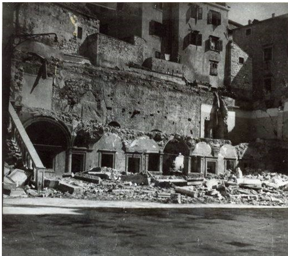
slika 1. Gradska vijećnica i Trg Republike, buduća festivalska Ljetna pozornica nakon bombardiranja 1943. godine

Šibenik, poput većine drugih gradova iz vihora Drugog svjetskog rata izlazi devastiran i razrušen, dijelom od savezničkih bombardiranja kojima je stradala stara gradska jezgra, ali i neka tada prigradska naselja. Neke od uništenih zgrada nikad više nisu bile obnavljane, te su nestale iz vizure grada, a na njihovom mjestu nastajali su novi gradski trgovi, od kojih su neki postali i festivalske pozornice, dok su na drugim lokacijama građeni suvremeni kompleksi interpolirani u staru gradsku jezgru. Tako su od savezničkih bombardiranja nastradali nizovi kuća u Docu, Dominikanski samostan, samostan svetog Lovre sa tiskarom, velika Gradska vijećnica, Hotel de la Ville i pripadajuća kavana Astorija, crkva sv. Julijana, kuće u okolici kazalište, gradski perivoj te zgrade u predjelima Baldekina i sv. Križa. Osim materijalne štete, bombardiranja su donijela i velike ljudske žrtve. 16 Također, prilikom povlačenja Wehrmachta iz samog grada minirana je i teško oštećena operativna obala u Šibenskoj luci. 17