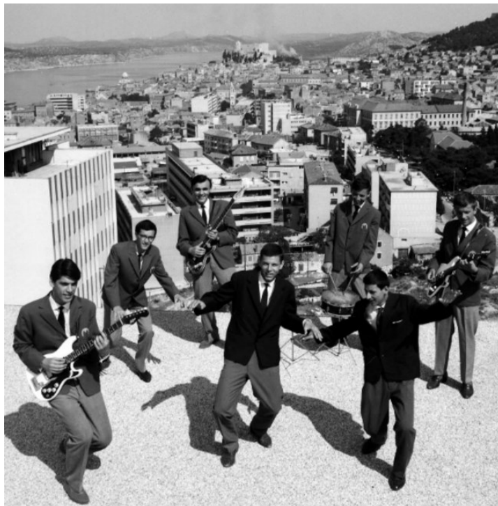
slika br. 8 Vokalno instrumentalni sastav „Magnet“