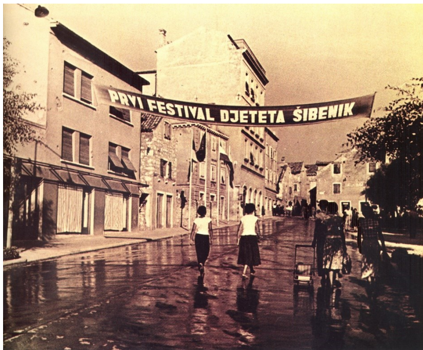
slika br. 10 Ulica bratstva i jedinstva(današnja ulica Stjepana Radića), ljeto 1958. godine

Festival je ipak na kraju otvoren u subotu 19. srpnja u dvorani „Partizan“, i to otvaranjem savezne izložbe dječjih crteža u 18 sati, dok je u 20 sati na Trgu Republike Festivalski orkestar, Dječji zbor Radio Zagreba zajedno s članovima plesnog ansambla Dječjeg kazališta „Ognjen Prica“ iz Osijeka izveo prigodni svečani program.