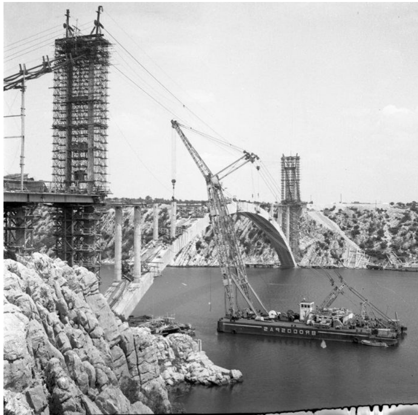
slika br. 4 Šibenski most u izgradnji, u prvom planu nalazi se plovna dizalica Veli Jože