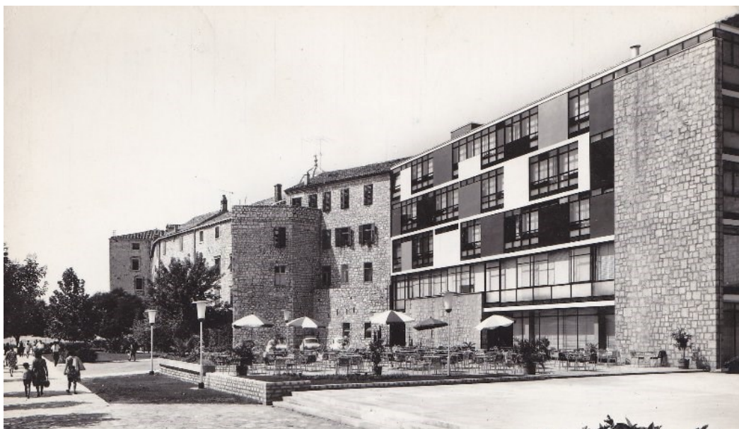
slika br.2. Kompleks Hotela Jadran, arhitekt Ivan Vitić

Vlada Narodne republike Hrvatske 1952. godine osniva Tvornicu i valjaonicu aluminijskih proizvoda u Šibeniku, iste godine otvara se poduzeće Vinoplod-Vinarija Šibenik, te turistička zajednica u Šibeniku. 20 Istih godina se grad razvija i po pitanju školstva, već 1945 osniva se Škola za učenike u privredi, 1946. se otvaraju dva dječja vrtića, a 1955. i 1956. osnivaju se srednja ekonomska i bolničarska škola, a 1957. osnovana je Industrijska škola za obojenu metalurgiju. 21 U travnju 1957. godine se osniva i lokalna, Komunalna banka Šibenik, kasnije poznatija pod imenom Jadranska banka, koja je kroz čitavo razdoblje socijalizma bila nositelj gospodarskog razvoja i stabilnosti u gradu. 22 Ivan Vitić već 1958. godine nastavlja sa radom u svom rodnom gradu, do 1964. godine po njegovim projektima traje izgradnja kompleksa suvremenih intermedijarnih zgrada hotela Jadran, kina Šibenik i nove zgrade Općine Šibenik. U gradu je 1959. godine osnovano i brodarsko poduzeće Slobodna plovidba, a iste godine započinje i izgradnja prvih nebodera u Dalmaciji, četrnaestokatnica popularno nazvanih po boji fasade, Plavi i Crveni neboder. 23