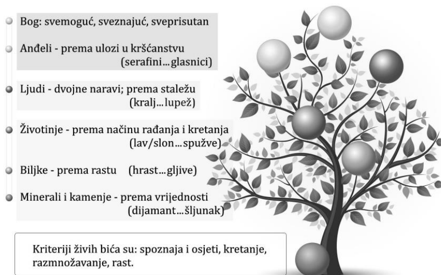
Slika 2. Scala naturae (preuzeto iz Znika i Znika, 2017: 245)

Langacker (1991: 306–307) u svojem tumačenju kategorije živosti upotrebljava pojam hijerarhija empatije . Ta je hijerarhija egocentrične naravi u kojoj položaj referenta ovisi o mogućnosti empatiziranja, a najvišu poziciju (kako biološki tako i jezično) u njoj zauzima govornik u komunikacijskom činu (ibid.). Nakon njega slijede ostali živi entiteti (redom slušatelji, ostali ljudi pa životinje), potom fizički objekti, dok najnižu poziciju zauzimaju apstraktni entiteti (ibid.). S druge strane, Dahl i Fraurud (1993, prema Yamamoto 1999: 11) pojam empatije zamjenjuju s točkom gledišta , a na vrhu njihove hijerarhije živi su entiteti koji djeluju na svoju neživu okolinu te svijet percipiraju s točke gledišta živih entiteta. Važno je istaknuti da su takve hijerarhije živih i neživih bića proizvod antropocentrične ljudske spoznaje (Yamamoto, 1999: 9).