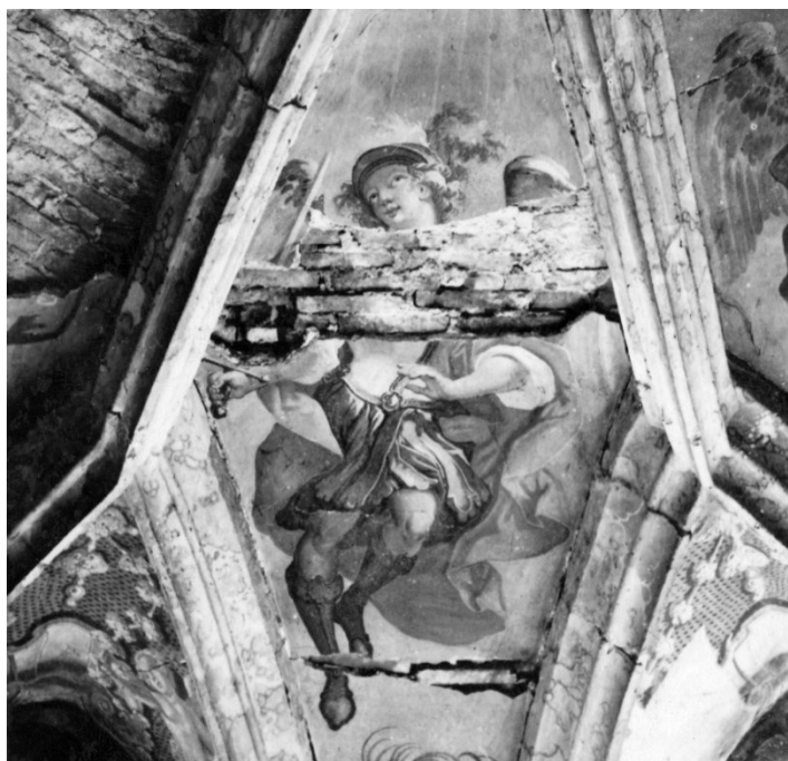
Slika 9 Lepoglava, župna crkva, oštećena zidna slika svoda svetišta, Antun Fuis, 1952.

Početkom studenog u Lepoglavu su doputovali Draginja Jurman-Karaman i fotoreporter JAZU Antun Fuis kako bi fotografirali oštećene zidne slikarije i štuko dekoraciju. (Slika 9) Oštećeni zidni oslik i štukatura su bili i razlog dolaska studenata Akademije likovnih umjetnosti Ivana Tomljanovića i Gyorjea Krstevskog. 135 Studenti su započeli s radovima skidanja štukature i zidnih slikarija 1. studenog 1952. godine, a nakon dolaska Milana Preloga detaljno su određeni koji dijelovi se skidaju. 136 Jurišić je također tada bila u Lepoglavi. Ona je s ing. Čorkom pregledala radove na sjevernom dijelu zapadnog pročelja. Sjeverni zid je ubrzo trebao biti dovršen čime bi bio zatvoren i otvor prema tavanu kaznionice. 137