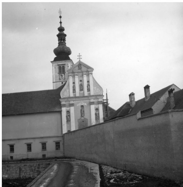
Slika 11 Lepoglava, župna crkva, pogled na zapadno pročelje nakon popravka, Vladimir Bradač, 1954.

U siječnju 1954. godine župnu crkvu u Lepoglavi fotografirao je fotograf Zavoda Vladimir Bradač. 159 (Slika 11) Lepoglavu su posjetili i sudionici konferencije republikanskih zavoda za zaštitu spomenika kulture i prirodnih rijetkosti koja se održavala u Zagrebu. 160