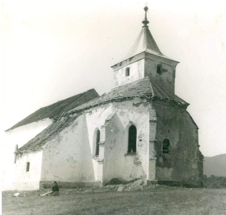
Slika 12 Očura, kapela sv. Jakova, pogled na oštećeno svetište, 1945.