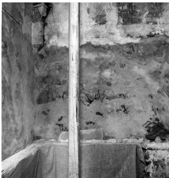
Slika 10 Lepoglava, župna crkva, dio zidnog oslika kora s najvećim oštećenjem, Antun Fuis, 1952.

Ana Deanović je 21. studenog putovala u Lepoglavu na pregled radova na zidnom osliku i skidanju štuko dekoracije u biblioteci. Skidanje fresaka je bilo završeno, a ostali radovi su se ubrzano završavali prije kraja građevne sezone. Slikarija na koru je, po njenom mišljenju, stradala do te mjere da se više ne može skinuti. (Slika 10) Ubrzano propadanje oslika uzrokovale su oborine koje kroz krov prodiru u međuprostor iza zida na kojima je oslik. Poslovođa joj je rekao da se stanje poboljšalo nakon popravka krova. Zaključila je da je nužno napraviti probnu sondu u zidu kako bi se izvidjelo postoji li međuprostor i šuta koja na sebe navlači vlagu. Preostali zidni oslik mogao se spasiti samo uklanjanjem izvora vlage. 138