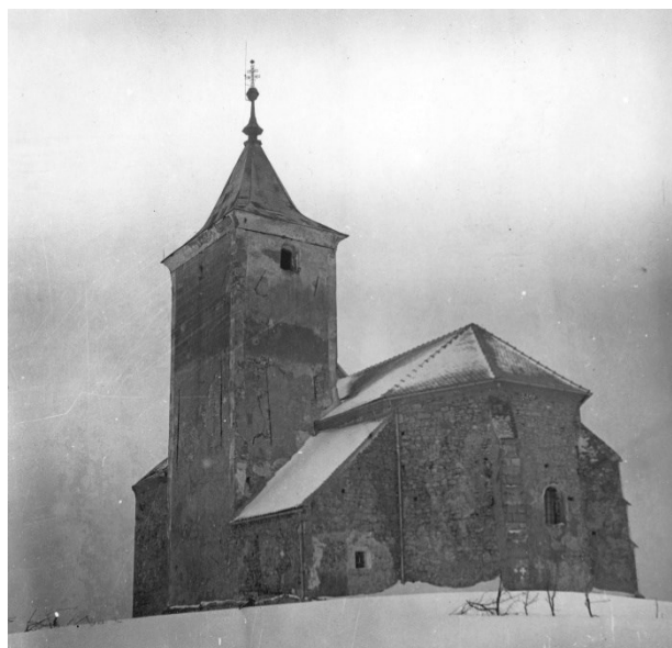
Slika 17 Očura, kapela sv. Jakova, pogled sa sjeveroistoka, Vladimir Bradač, 1953.

Stahuljak 256 , prof. Draginja Jurman-Karaman 257 i fotograf Vladimir Bradač poslani su u veljači 1953. godine u Zagorje fotografirati spomenike kulture, među njima i Očuru. 258 (Slika 17) Kapela je bila u dobrom stanju. 259