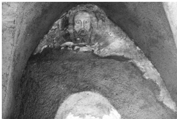
Slika 20 Belec, crkva sv. Jurja, oslik istočnog zida svetišta, Tošo Dabac, 1947.

Temelji sakristije i kapele sv. Katarine koji se također spominju u vizitacijama pronađeni su uz sjeverni zid broda. Pronalazak temelja samo jedne prostorije i nalaz oltarne menze naveo ih je na zaključak da se sakristija u 17. stoljeću proširivala i pretvorila u kapelu sv. Katarine. Vjerojatno je srušena u potresu 1775. godine kada su zazidana i pronađena vrata sakristije i kapele. Nova sakristija sagrađena je sjeverno od svetišta. 275 (Slika 21)