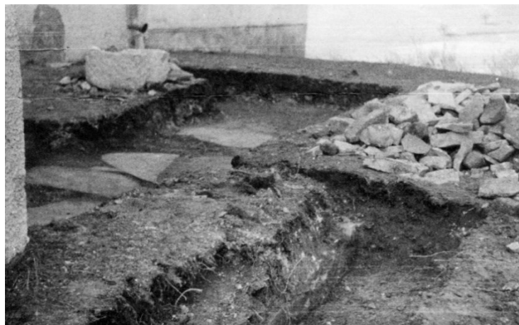
Slika 21 Belec, crkva sv. Jurja, temelji kapele sv. Katarine prilikom iskapanja, Tihomil Stahuljak, 1947.

Temelji sakristije i kapele sv. Katarine koji se također spominju u vizitacijama pronađeni su uz sjeverni zid broda. Pronalazak temelja samo jedne prostorije i nalaz oltarne menze naveo ih je na zaključak da se sakristija u 17. stoljeću proširivala i pretvorila u kapelu sv. Katarine. Vjerojatno je srušena u potresu 1775. godine kada su zazidana i pronađena vrata sakristije i kapele. Nova sakristija sagrađena je sjeverno od svetišta. 275 (Slika 21)