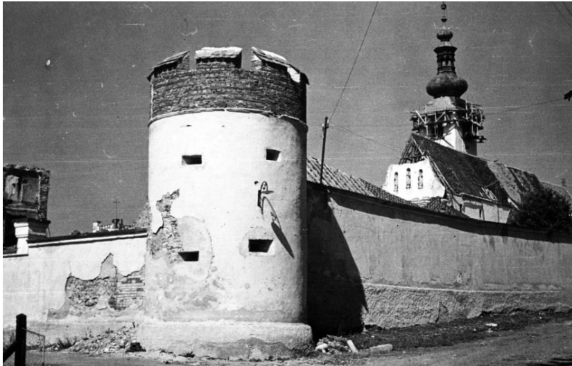
Slika 6 Lepoglava, nekadašnji samostan i župna crkva, jugozapadna ugaona kula perimetralnog zida, Tihomil Stahuljak, 1945.

izgradi se čunjasti krovčić. (Slika 6) Ispred zapadnog pročelja samostana trebale su se maknuti dvostrane stepenice, a oslik u refektoriju se morao do jeseni natkriti. 57