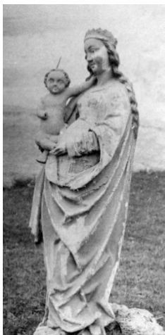
Slika 15 Očura, kapela sv. Jakova, kip Bogorodice s Djetetom, o. 1510., 1948.

Za radove na kapeli 1949. godine angažirano je Kotarsko građevno poduzeće Zlatar. U planu su bili pokrivanje krova iznad svetišta, sukladni limarski radovi i popravci stolarije vrata i prozora. 214 Zavod je dobio svotu od 100.000 dinara. 215 Jurišić je otputovala u Zlatar kako bi organizirala početak radova na Očuri. Za 7. lipanj 1949. je s direktorom građevinskog poduzeća dogovorila sastanak kod kapele kako bi im pokazala plan rada na samom objektu, a nakon toga je planirano potpisivanje ugovora. Predala mu je troškovnik i nacрте te ih uputila da do sastanka zatraže potreban građevinski materijal od Ministarstva građevina iako će radovi početi tek 1. kolovoza. 216