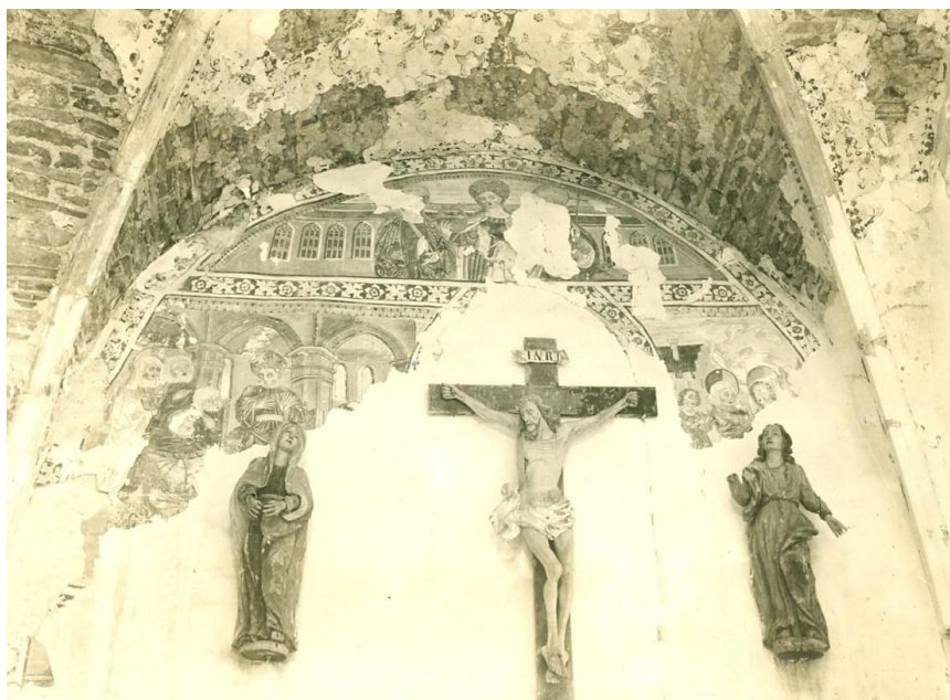
Slika 13 Očura, kapela sv. Jakova, ostaci zidnog oslika na južnom zidu kapele, druga polovica 15. stoljeća, 1946.

Za 1947. godinu je Konzervatorski zavod na kapeli sv. Jakova planirao popravak krovišta, ostakljenje prozora i učvršćivanje zidnih slikarija. 187 Za radove je bilo angažirano poduzeće Aranjoš. 188 Jedan od glavnih problema s kojima se Zavod suočio na terenskom radu bili su neadekvatno educirani radnici, što je u nekim slučajevima dovelo i do uništenja dijelova spomenika. Stahuljak je od 27. listopada do 4. studenog putovao u Belec i Očuru u nadzor konzervatorskih radova. Dana 1. i 2. studenog na Očuri je pregledao kapelu sv. Jakoba. U svetištu su uz desni zid sve do glavnog oltara bile podignute 2.5 m visoke skele. Utvrdio je da je zidni oslik na zidovima u visini od 3.8 m bio uništen prilikom skidanja sloja žbuke. Uništen je donji pojas zidnih slika iz 15. stoljeća s prikazom zastora, likova apostola na istočnoj i jugoistočnoj strani te neidentificirane scene na sjevernoj strani svetišta. Stahuljak je izvijestio i da je oštećena konstrukcija krovišta uklonjena nad čitavim prvim travejom svetište te ostaci svoda koji se srušio. (Slika 14) Nova konstrukcija nad svetištem nije započeta, ali je već bila izvedena nova krovna konstrukcija od greda iznad stare sakristije do zvonika i nove sakristije. Ostatak svoda uz desni zid prvog traveja štitio je djelomično preostali oslik i barokne kipove Krista s Marijom i Ivanom. 189