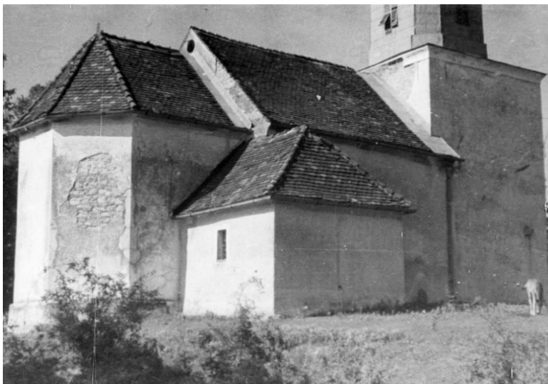
Slika 18 Belec, crkva sv. Jurja, stanje prije početka radova, Tihomil Stahuljak, 1946.

Prijedlog budžeta za 1947. godinu pokazuje da je Karaman planirao nastavak istraživanja i restauriranje crkve. 269 Od ukupnih 637.000 dinara kredita za sv. Jurja traženo je 80.000 dinara. 270