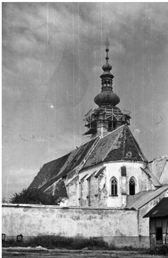
Slika 5 Lepoglava, župna crkva, pogled na oštećeno svetište te zvonik u tijeku popravka, Tihomil Stahuljak, 1945.

Zugmayer i Gruber u Zagrebu s kojom su pregovarali nabavku bakra postala državno vlasništvo i više nije mogla prodavati bakar bez odobrenja Ministarstva industrije i rudarstva. Župnik Mato Repić je zbog toga poslao Ministarstvu molbu za nabavu bakrenog lima. 55 Bakrenog lima nije bilo na zalihama pa je predloženo da se toranj privremeno pokrije npr. ljepljenkom. 56