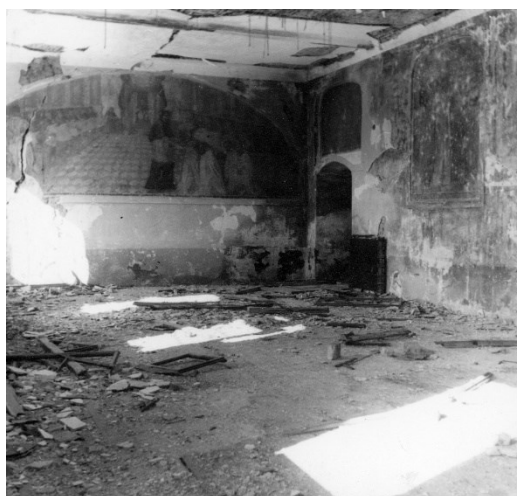
Slika 3 Lepoglava, nekadašnji samostan, refektorij samostana nakon oštećenja u ratu, Marcel Davila, 1945.

Lepoglavski sklop samostana i crkve dočekaio je kraj Drugog svjetskog rata iznimno oštećen. Požar 1943. godine je uništio većinu krova zgrade što je ugrozilo oslik u refektoriju samostana. (Slika 3) Najveću štetu učinilo je ipak detoniranje municije deponirane u dvorištu kaznionice ispred zapadnih pročelja crkve i samostana od strane njemačkih trupa 1945. godine. Od posljedica usisnog djelovanja eksplozije zapadno pročelje crkve se otklonilo od tijela građevine. (Slika 4) To je uzrokovalo prijelom zbog kojeg se zabat pročelja srušio, a zidovi su popucali na čitavom zapadnom dijelu crkve. Svodovlje crkve je također popucalo, a oslik u svetištu je djelomično otpao. 52