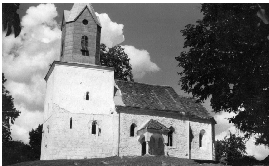
Slika 19 Belec, crkva sv. Jurja, pogled na južno pročelje za vrijeme trajanja radova, Tihomil Stahuljak, 1947.

je tlocrt koji će nacrtati u mjerilu 1:25 kako bi kasnije mogao dodavati detalje koji će se pronalaziti. U tu svrhu precizno je snimio i ostatke prozora, klesarske i bravarske detalje. 272