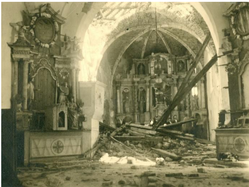
Slika 14 Očura, kapela sv. Jakova, stanje prije uklanjanja ostataka urušenog svoda svetišta, 1947.

Stahuljak je zabranio da se oslik dalje dira i naložio da se iznad južnog zida svetišta na prostoru prvog traveja gdje je uklonjen ostatak svoda konstruira privremena streha kako bi se zaštitile freske i kipovi. Iz kapele je uklonjeno kamenje i štuta. Kamenje urušenog svodovlja složeno je na početak broda, a ono gotičkih rebara u brod. Još je bilo potrebno ukloniti razorene dijelove propovjedaonice od opeke, materijal pospremiti u kapelu i popraviti južna vrata. 190 Stahuljak je na prethodnom službenom putu 2. listopada predstavniku poduzeća Aranjoš ing. Cesarcu pri obilasku kapele izričito naglasio važnost oslika i da se žbuka ne dira te da radnici nikako ne oslanjaju skele potrebne za popravak svoda uz zidove. Stahuljak je kapelu posljednji puta na tome putovanju obišao 3. listopada 191 , a 5. listopada dokumentirao je oslik izvješćem i crtežom. Dan poslije Anđela Horvat ga je i fotografirala. 192