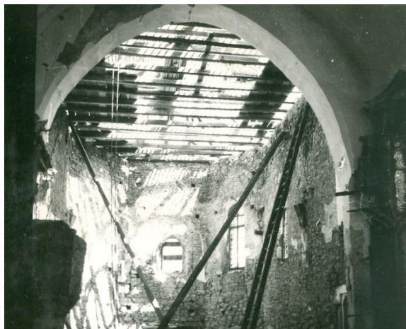
Slika 16 Očura, kapela sv. Jakova, pogled na svetište sa novim stropnim gredama