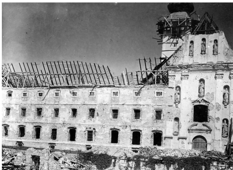
Slika 4 Lepoglava, nekadašnji samostan i župna crkva, pogled na zapadno pročelje oštećeno eksplozijom municije, Tihomil Stahuljak, 1945.

Karaman je u travnju 1946. godine poslao Odjelu kaznenih zavoda Ministarstva unutarnjih poslova preko Odjela za kulturu i umjetnost Ministarstva prosvjete elaborat o Lepoglavi. U tekstu je iznio povijest samostana i crkve, sve nedaće koje su ih snašle, od adaptacije u kaznionicu, pregradnji i rušenja dijelova kompleksa do štete nastale u Drugom svjetskom ratu. Posebno ističe da je velika šteta za vrijednost kompleksa bilo rušenje zgrada koje su zatvarale dvorište ispred zapadnog pročelja. Karaman je sadašnju situaciju vidio kao priliku da se pogreške učinjene na spomeniku uklone ili ublaže, ali je nužno paziti da se ne naprave nove. 53