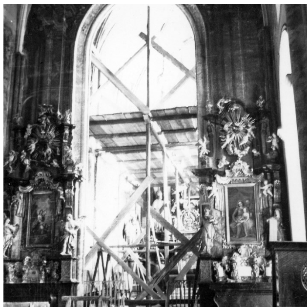
Slika 8 Lepoglava, župna crkva, pogled prema skelama u svetištu, Greta Jurišić, 1952.

U Lepoglavi je bila još nekoliko puta tokom mjeseca na pregledu radova, a krajem rujna u putnom izvještaju navela je da se radi na svodu u brodu crkve, a radove na zidovima je zaustavila jer se prvo moraju istražiti ostaci gotičke arhitekture. Za radove na zapadnom pročelju nužno je bilo što prije donijeti plan rada jer će se bez intervencija pročelje oštetiti. S novim poslovođom građevnog poduzeća je pregledala crkvu i primijetila da će se radovi ponovno usporiti dok se njega ne uvede u osjetljivu prirodu konzervatorskih poslova. 127 Na svodu broda crkve su osiguravali kamena rebra, prezidavali polja koja su uleknuta, a u središtu broda je nedostajao cijeli središnji križ rebara koji je sada bio zamijenjen novim daskama i ožbukani. Na sjevernoj strani zapadnog pročelja započelo je usidrenje i osiguranje zida prije početka ostalih radova. 128