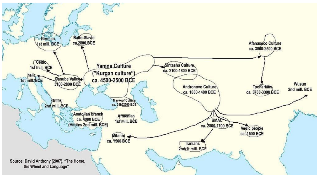
Slika 1. kurganska teorija. (preuzeto iz Anthony, David (2007), The Horse, the Wheel and Language)

Najuspjelija je i najprihvaćenija teorija litavsko-američke arheologinje i antropologinje Marije Gimbutas, koja je povezala lingvistička i arheološka otkrića u otkrivanju teritorija na kojemu su nedvojbeno obitavali Indoeurolpljani. Riječ je o kurganskoj teoriji, odnosno posebnoj grobnoj kulturi kurgana koja je bila rasprostanjena na istome teritoriju na kojemu su pronađeni dokazi za širenje indoeuropskih jezika, stoga je Gimbutas zaključila da je pradomovina Indoeurolpljana usko povezana s prostorom postojanja kulture kurgana, što nije uočljivo među običajima nekih drugih civilizacija ili kultura. Pretpostavlja prostor sjeverno od Crnoga mora i Kaspijskoga jezera, prema središnjoj Europi sve do Baltika na sjeveru i prema Maloj Aziji preko Balkanskog poluotoka na jugu. No, također je važno napomenuti da Marija Gimbutas ne tvrdi da je postojao jedan homogeni indoeuropski jezik, već da su se diljem teritorija rasprostirali različiti dijalekti, što potvrđuju i različita arheološka otkrića. S obzirom na prodiranja raznih elemenata lokalnih kultura i jezika među Indoeurolpljane na poprilično velikom teritoriju koji su naseljavali i drugi narodi, ubrzo su se počele stvarati različite indoeuropske skupine. Formiranje pojedinih skupina poput Balta, Slavena, Germana i dr. Gimbutas smješta u drugo tisućljeće prije Krista.